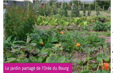
Le jardin partagé de l'Orée du Bourg

sur la cour pavée de la bibliothèque et une initiation à la permaculture aura lieu le samedi 5 juin , avec Arnaud MEILLAREC.