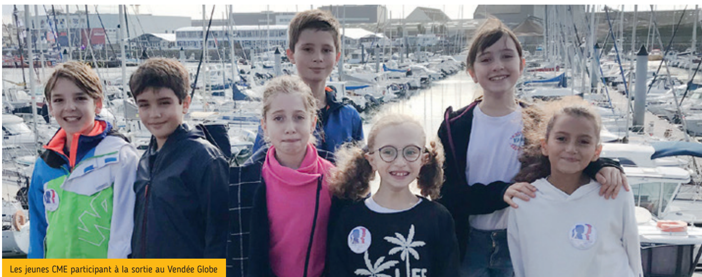
Les jeunes CME participant à la sortie au Vendée Globe