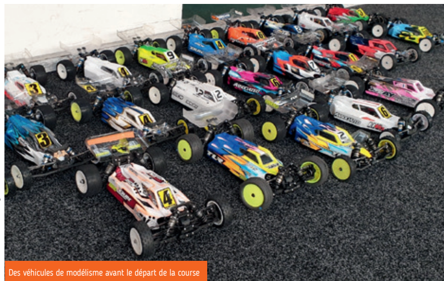
Des véhicules de modélisme avant le départ de la course

L'association Atlantic Racing Club fait la part belle à la pratique de véhicules radio-commandés en indoor (pour simplifier, du modélisme), dans des locaux partagés avec Buggy Events. L'activité se fait sur un revêtement de moquette et concerne principalement des voitures électriques de piste et de tout-terrain, à l'échelle 1/10 e et 1/12 e . À ce jour, l'association regroupe 35 membres actifs qui viennent de tous horizons, certains font même jusqu'à 100 km pour les rejoindre.