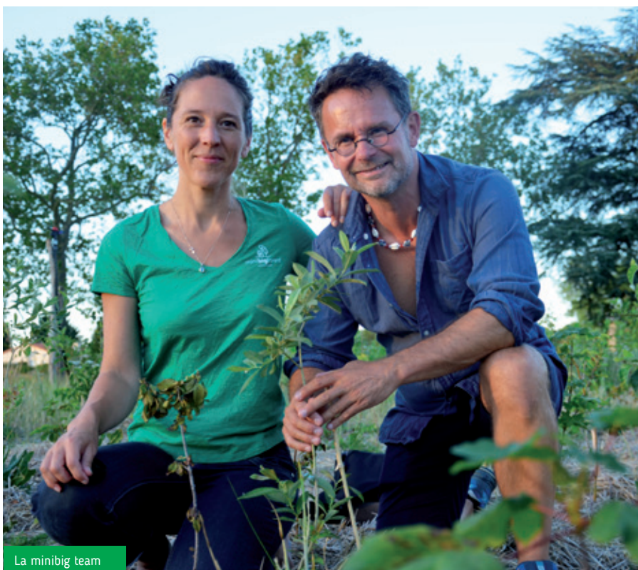
La minibig team