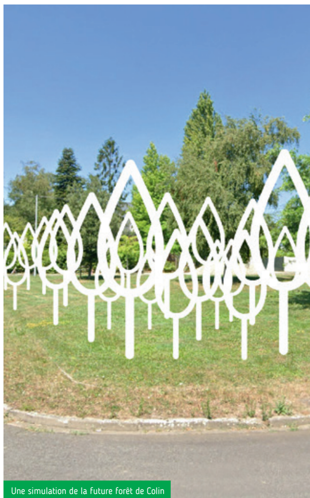
Une simulation de la future forêt de Colin