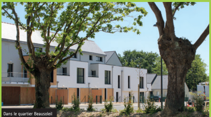
Dans le quartier Beausoleil