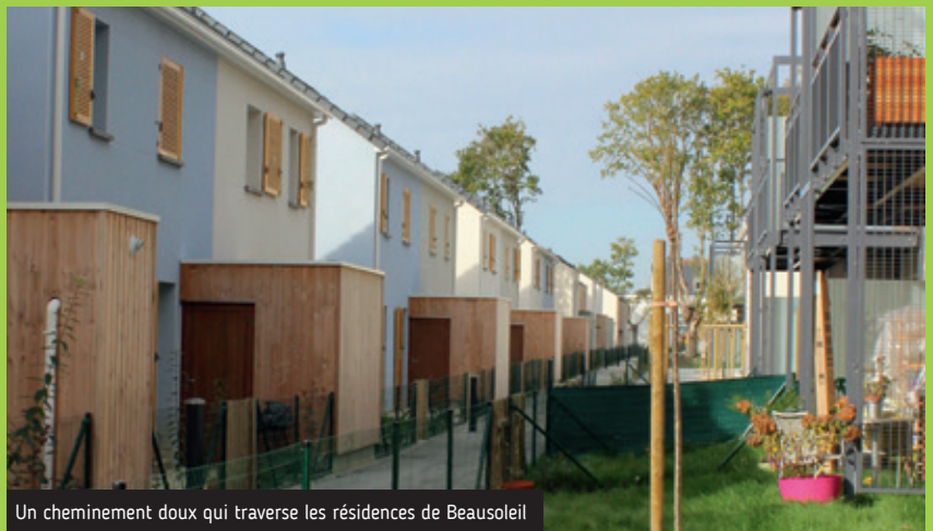
Un cheminement doux qui traverse les résidences de Beausoleil