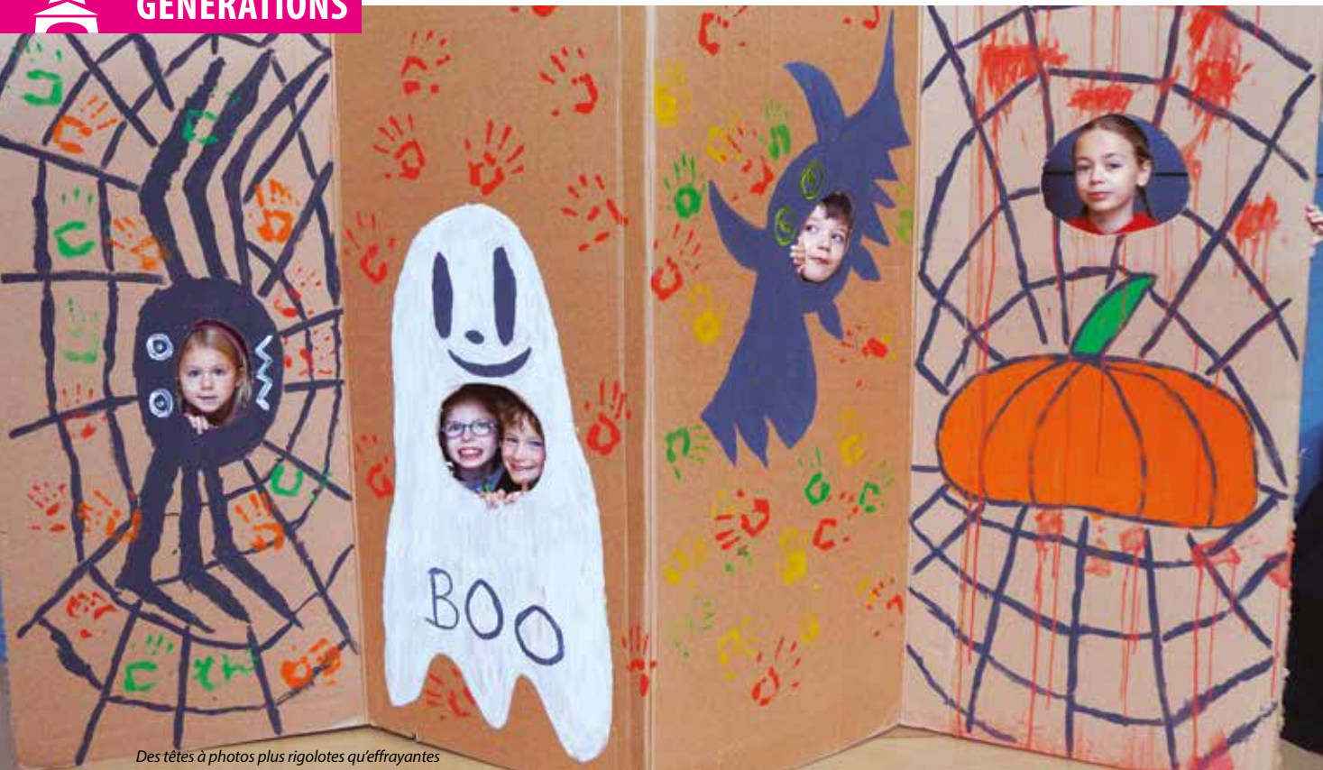
Des têtes à photos plus rigolotes qu'effrayantes