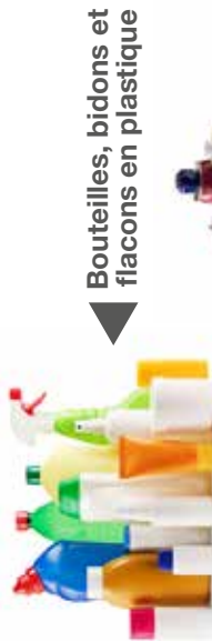
Bouteilles, bidons et flacons en plastique