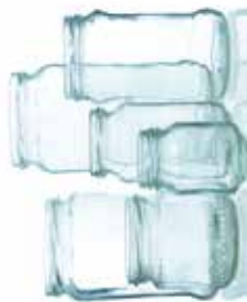
Pots et bocaux