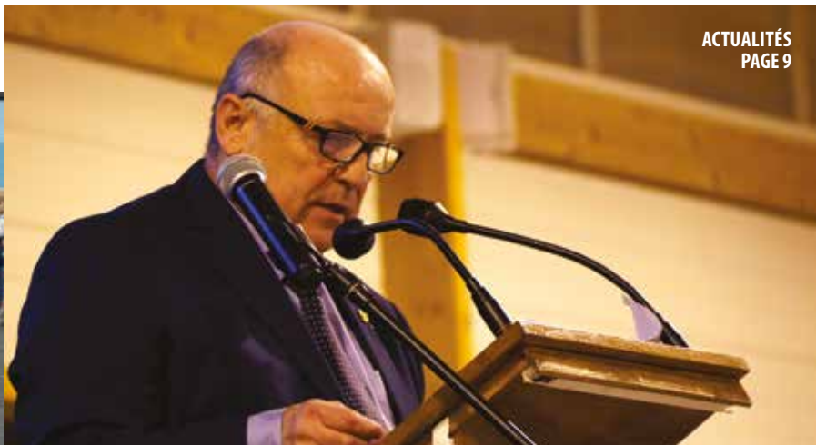
ACTUALITÉS PAGE 9