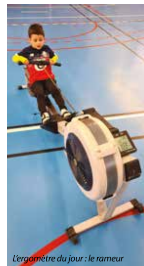
L'ergomètre du jour : le rameur