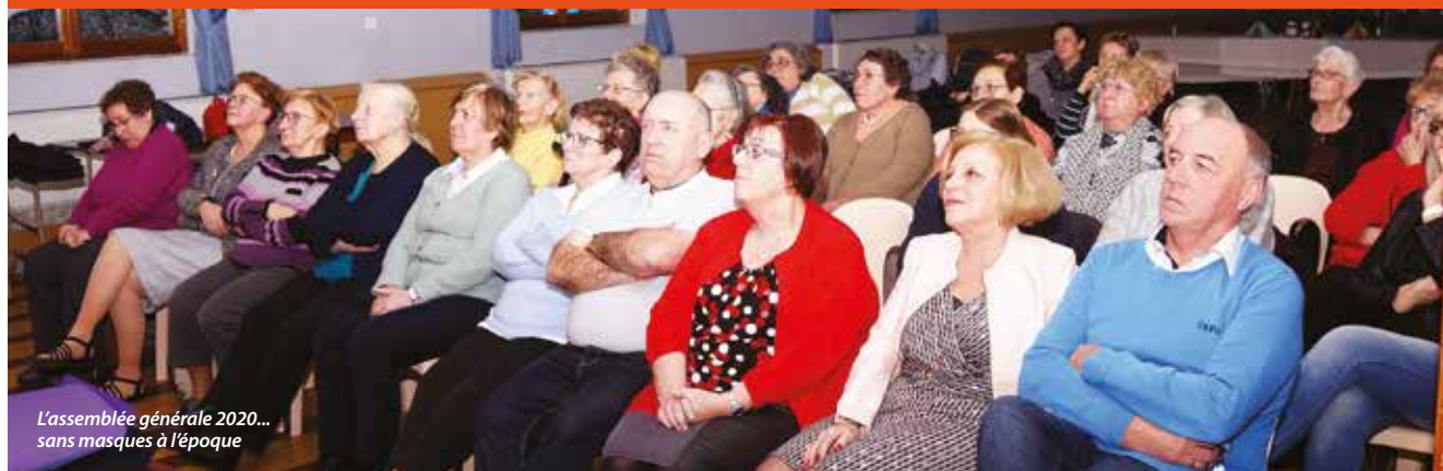
L'assemblée générale 2020... sans masques à l'époque