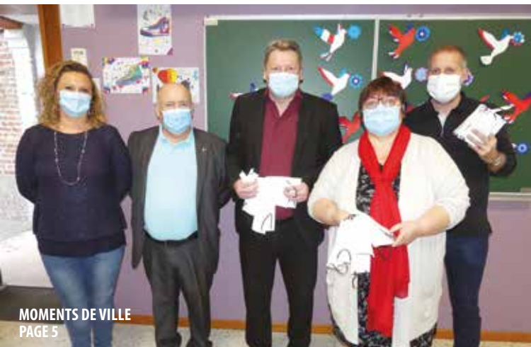
MOMENTS DE VILLE PAGE 5