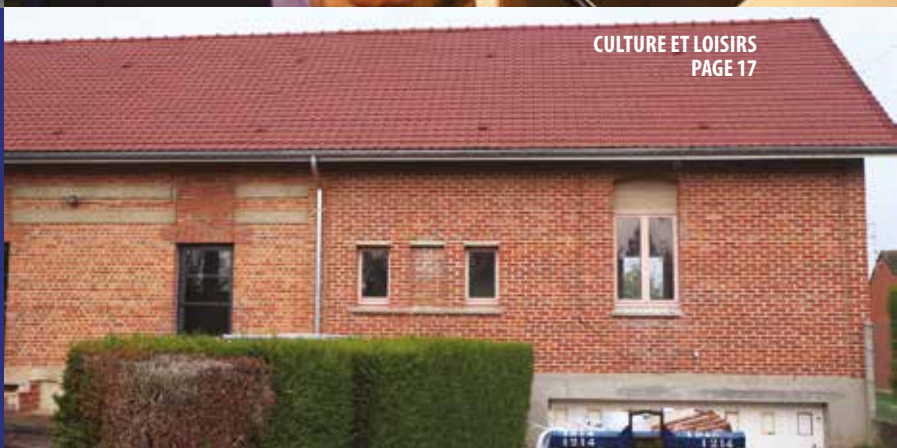
CULTURE ET LOISIRS PAGE 17