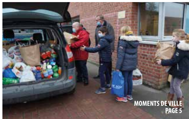
MOMENTS DE VILLE PAGE 5