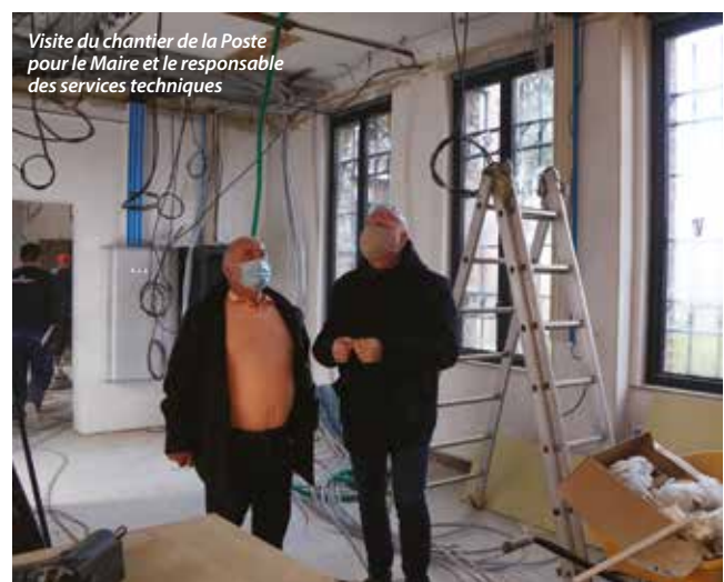
Visite du chantier de la Poste pour le Maire et le responsable des services techniques