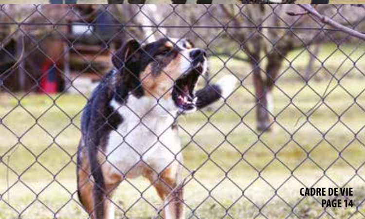
CADRE DE VIE PAGE 14