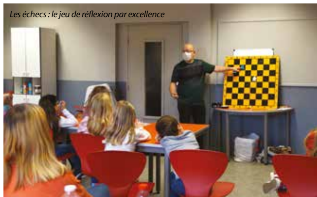
Les échecs : le jeu de réflexion par excellence

Halloween oblige, de nombreuses activités ont tourné autour de cette thématique de saison. Réalisation de masques, chasse à la citrouille, têtes à photos araignées et fantômes, confection de magnets de monstres... les enfants s'en sont donnés à cœur joie pour leurs créations manuelles. Les différents jeux organisés avaient aussi un nom évocateur : « Un monstre en or », « Sur les traces du fantôme », « Le disparu » !