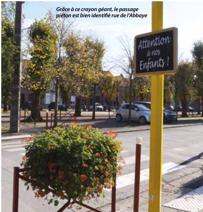
Grâce à ce crayon géant, le passage piéton est bien identifié rue de l'Abbaye