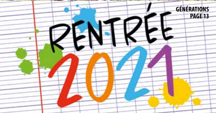
GÉNÉRATIONS PAGE 13