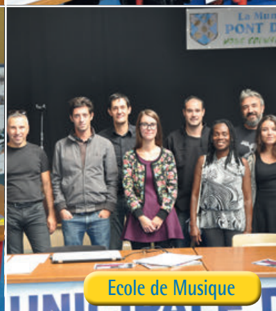
Ecole de Musique