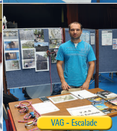
VAG - Escalade