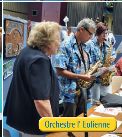
Orchestre l' Eolienne