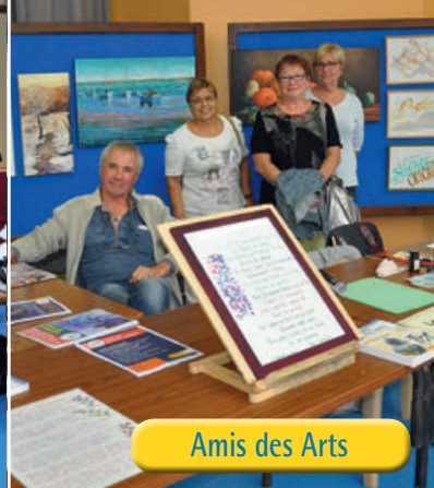
Amis des Arts