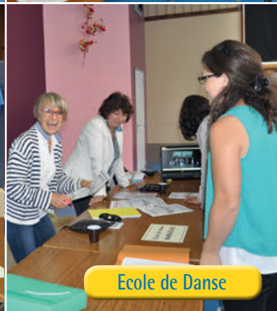
Ecole de Danse