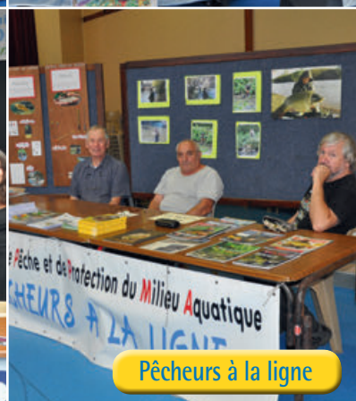
Pêcheurs à la ligne