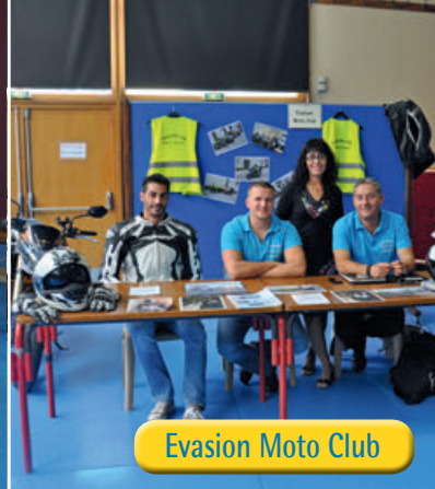
Evasion Moto Club