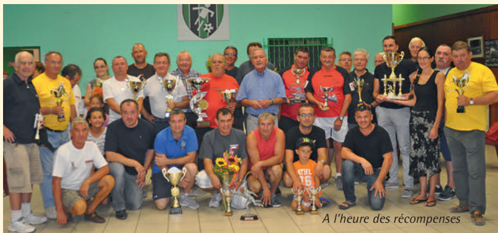
A l'heure des récompenses