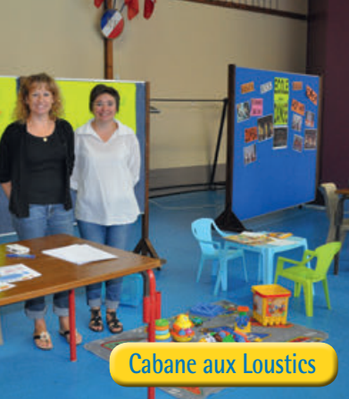
Cabane aux Loustics