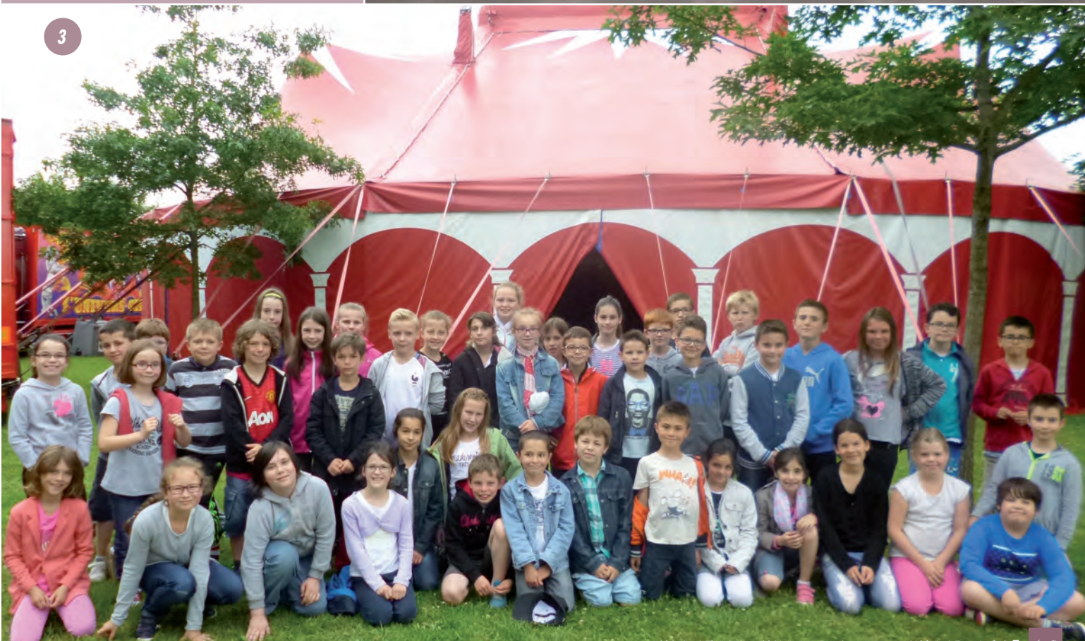
3- Installation d'un cirque dans le centre du bourg.