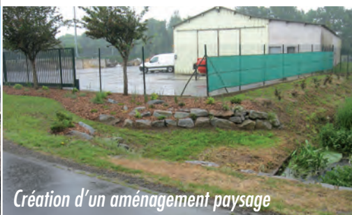
Création d'un aménagement paysage