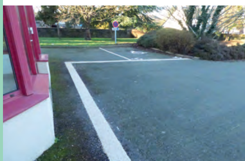
Parking réservé avec bande podotactile pour les malvoyants

Voici quelques photos de nos réalisations :