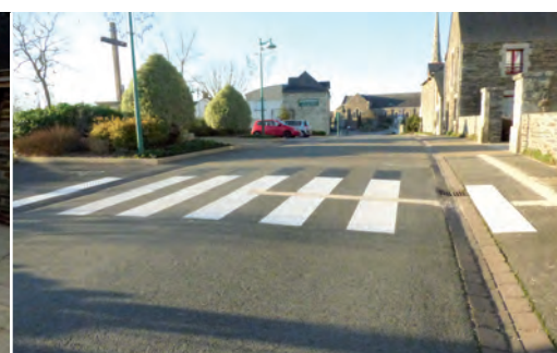
Passage piéton avec bande podotactile