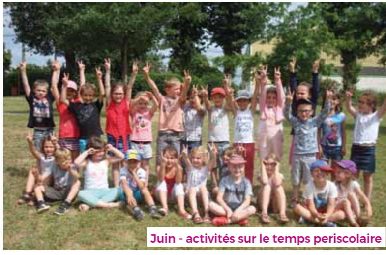
Juin - activités sur le temps periscolaire