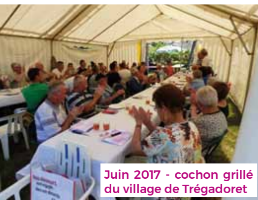
Juin 2017 - cochon grillé du village de Trégadoret