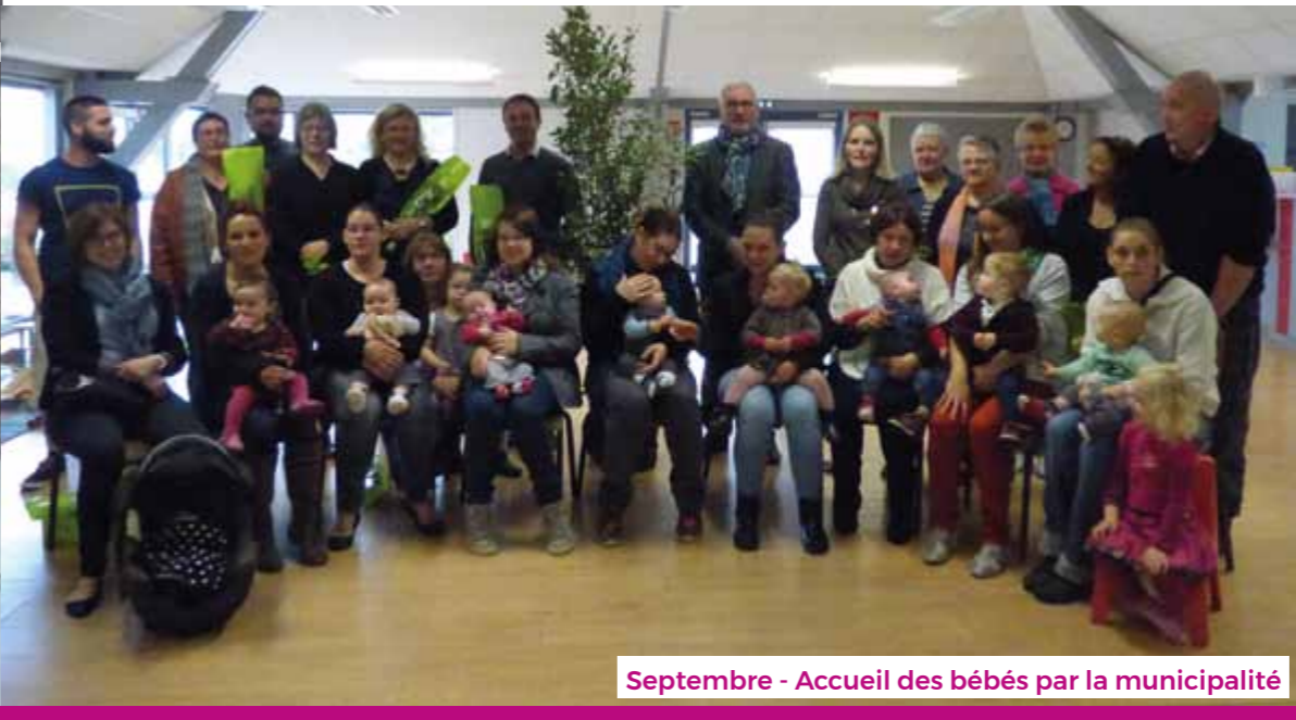
Septembre - Accueil des bébés par la municipalité