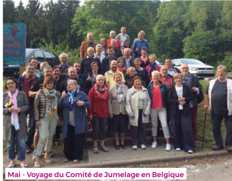
Mai - Voyage du Comité de Jumelage en Belgique