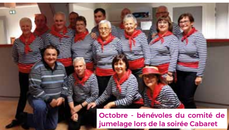
Octobre - bénévoles du comité de jumelage lors de la soirée Cabaret