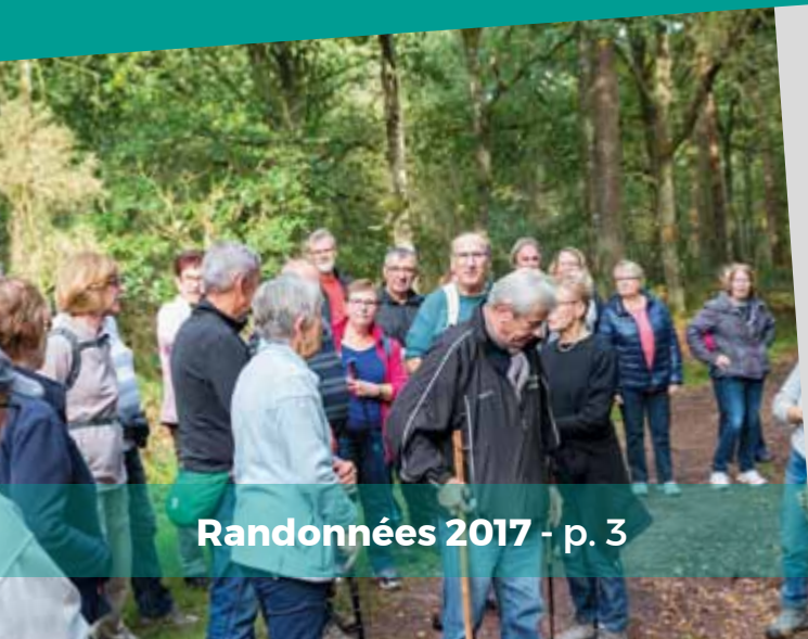
Randonnées 2017 - p. 3

Maison de l'enfance Avant-projet susceptible de légères modifications