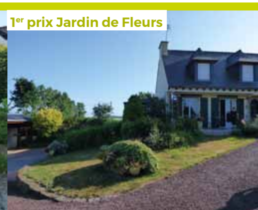
1 er prix Jardin de Fleurs