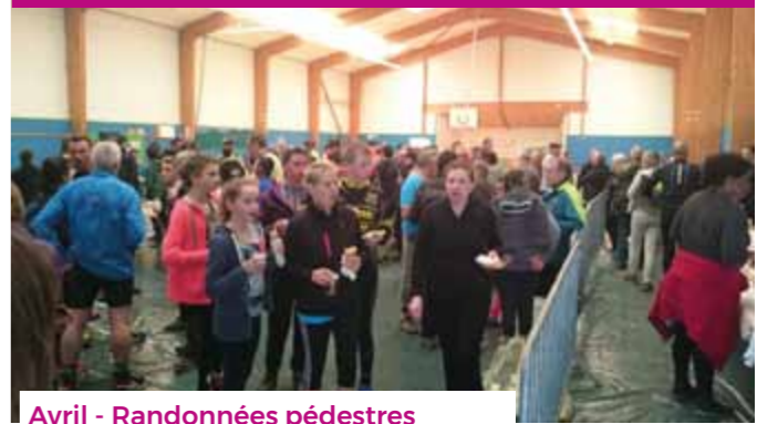
Avril - Randonnées pédestres et VTT organisées par le Club de VTT