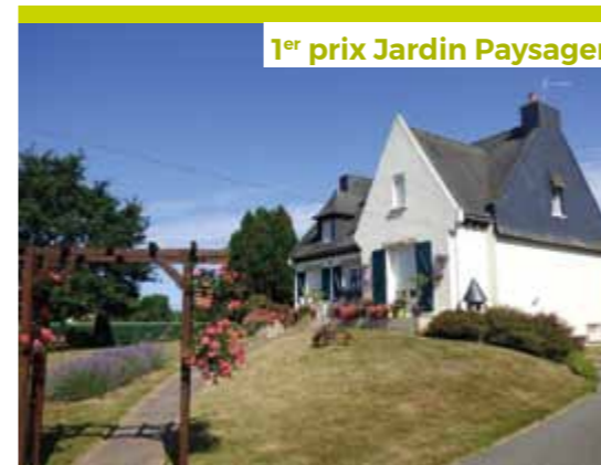
1 er prix Jardin Paysager