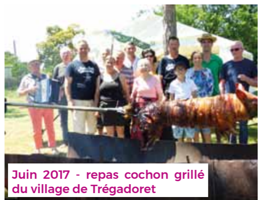
Juin 2017 - repas cochon grillé du village de Trégadoret