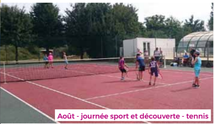
Août - journée sport et découverte - tennis