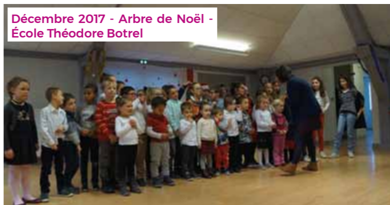
Décembre 2017 - Arbre de Noël - École Théodore Botrel