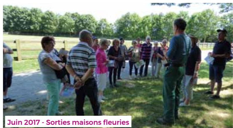
Juin 2017 - Sorties maisons fleuries