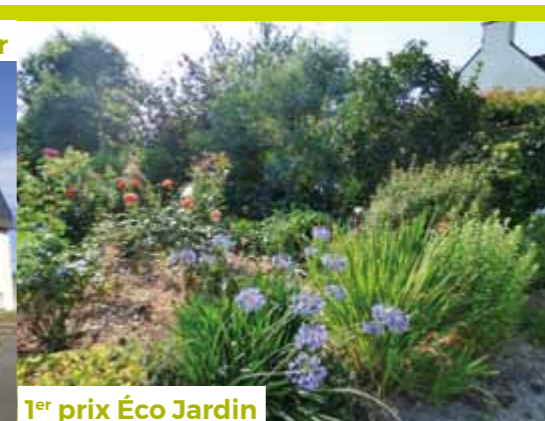
1 er prix Éco Jardin