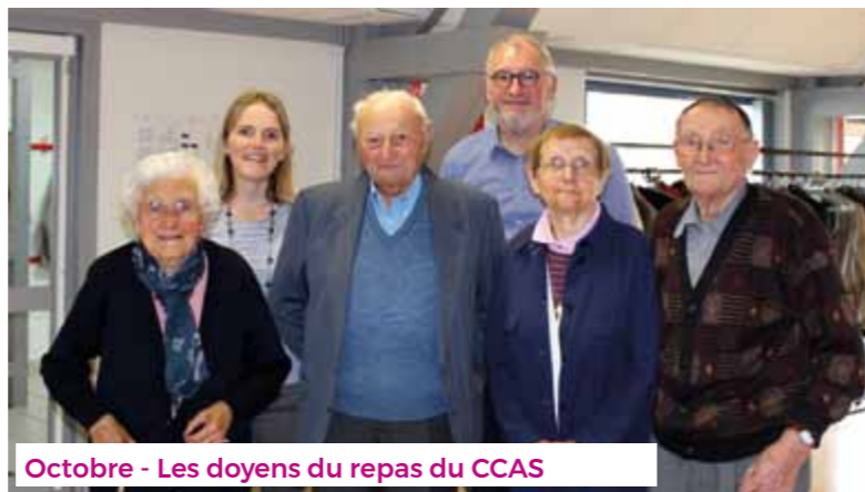
Octobre - Les doyens du repas du CCAS