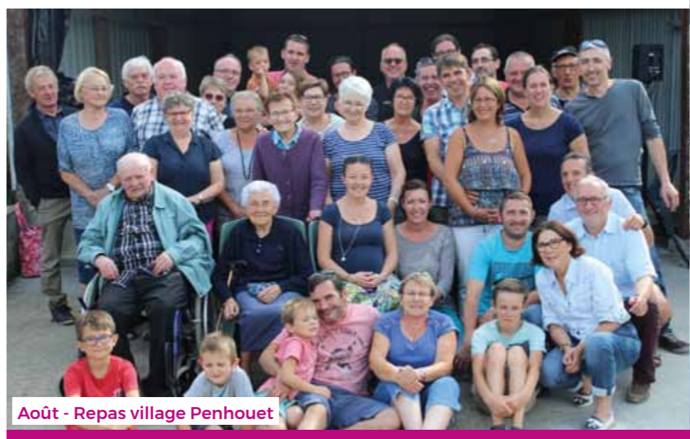
Août - Repas village Penhouet