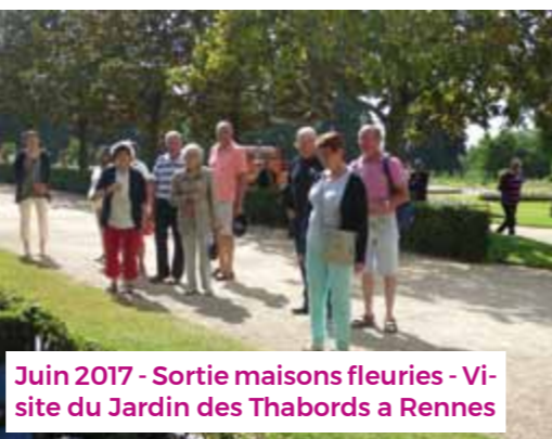
Juin 2017 - Sortie maisons fleuries - Visite du Jardin des Thabords a Rennes