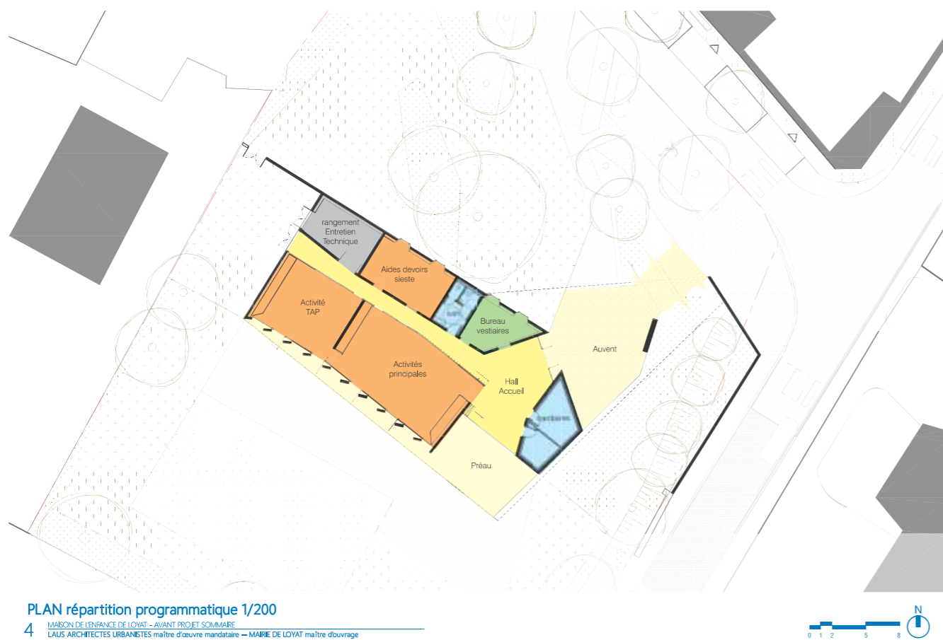
PLAN répartition programmatique 1/200

4 MAISON DE L'ENFANCE DE LOYAT - AVANT PROJET SOMMAIRE LAUS ARCHITECTES URBANISTES maître d'œuvre mandataire - MARIE DE LOYAT maître d'ouvrage