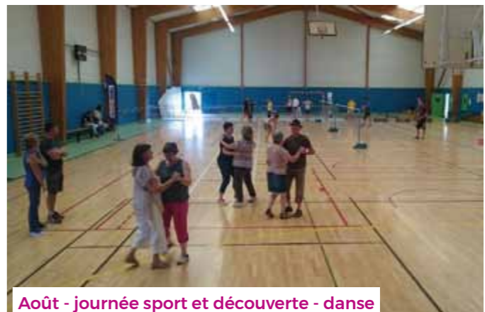
Août - journée sport et découverte - danse