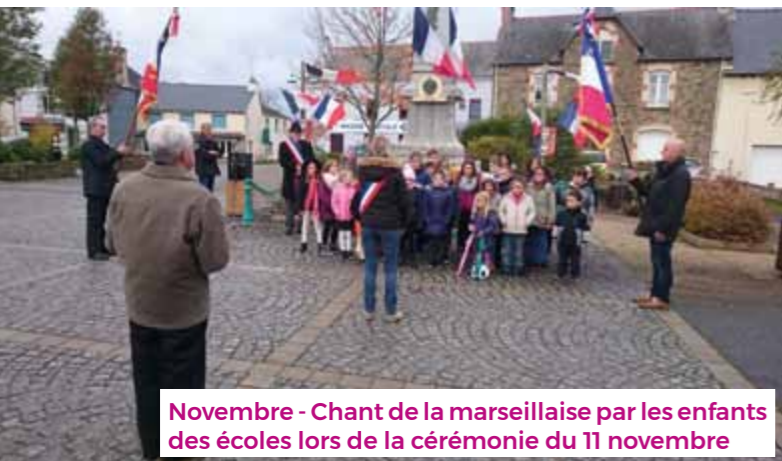
Novembre - Chant de la marseillaise par les enfants des écoles lors de la cérémonie du 11 novembre