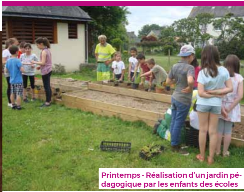
Printemps - Réalisation d'un jardin pédagogique par les enfants des écoles

// Enregistrement du PACS Les futurs partenaires doivent se présenter en personne et ensemble devant l'officier de l'état-civil de la Mairie. Un rendez-vous est fixé pour la signature des documents et la remise du récépissé d'enregistrement.