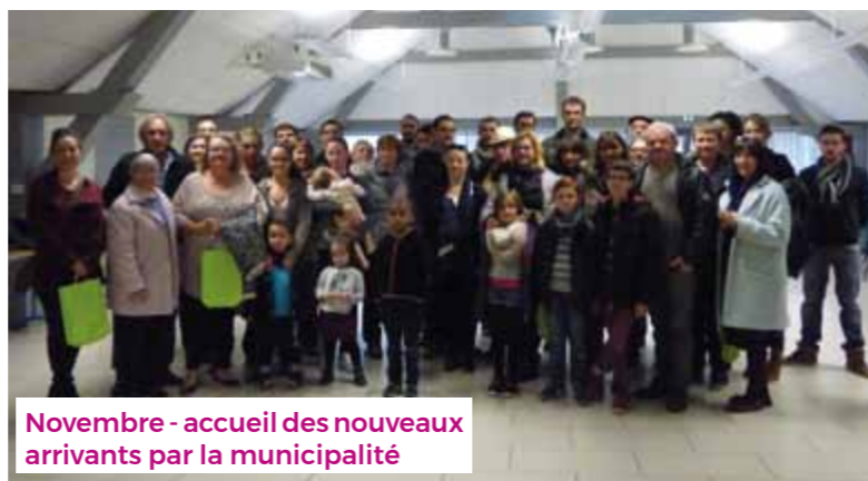
Novembre - accueil des nouveaux arrivants par la municipalité