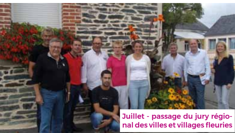
Juillet - passage du jury régional des villes et villages fleuries