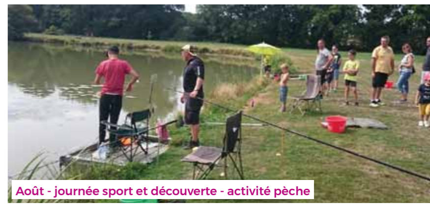
Août - journée sport et découverte - activité pêche