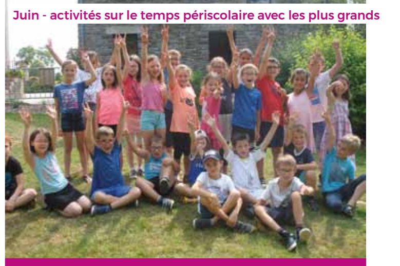
Juin - activités sur le temps périscolaire avec les plus grands