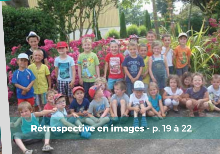
Rétrospective en images - p. 19 à 22