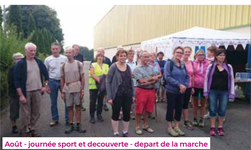
Août - journée sport et découverte - depart de la marche