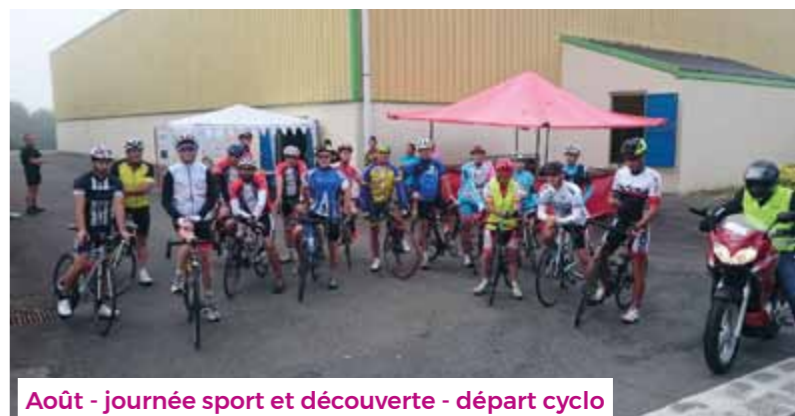
Août - journée sport et découverte - départ cyclo