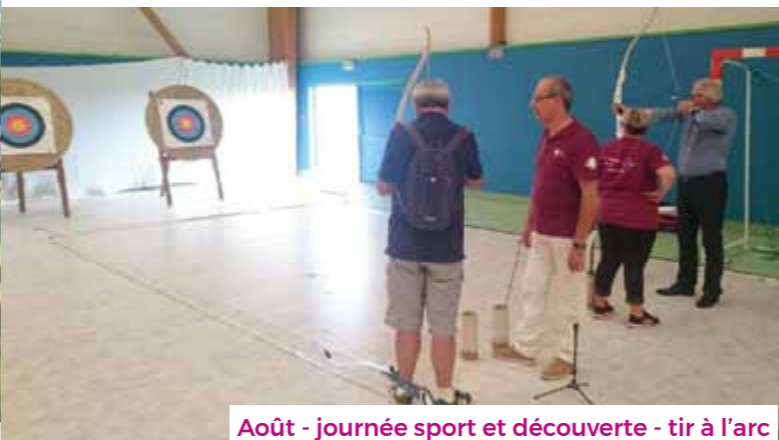
Août - journée sport et découverte - tir à l'arc