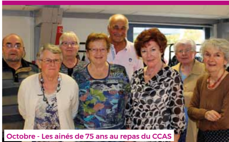
Octobre - Les aînés de 75 ans au repas du CCAS