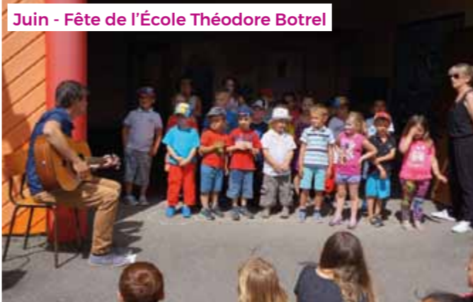
Juin - Fête de l'École Théodore Botrel