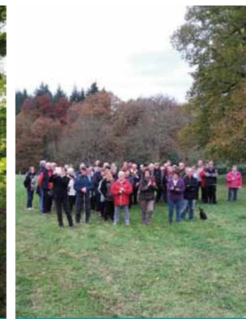
cérémonie des vœux du Maire le 14 janvier 2018