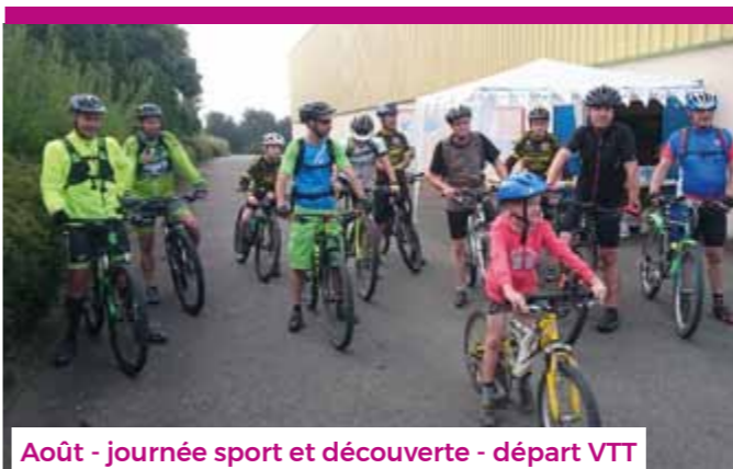
Août - journée sport et découverte - départ VTT