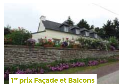
1 er prix Façade et Balcons

Elue en charge de la commission embellissement.