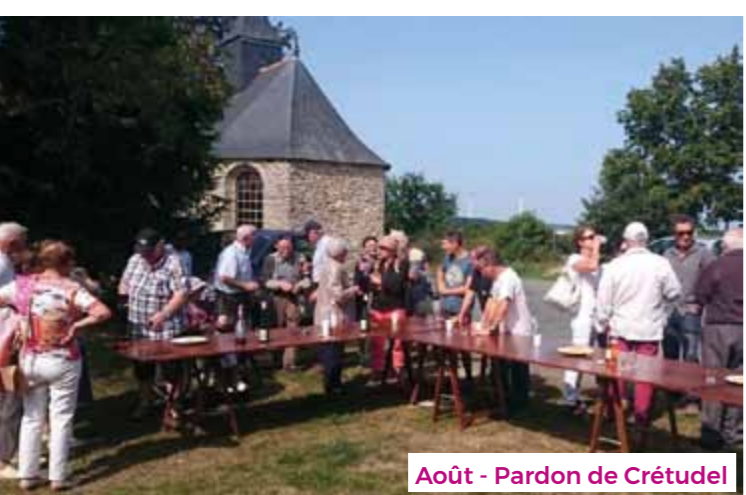
Août - Pardon de Crétudel