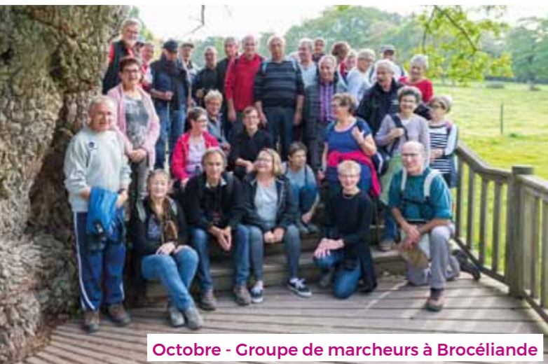
Octobre - Groupe de marcheurs à Brocéliande