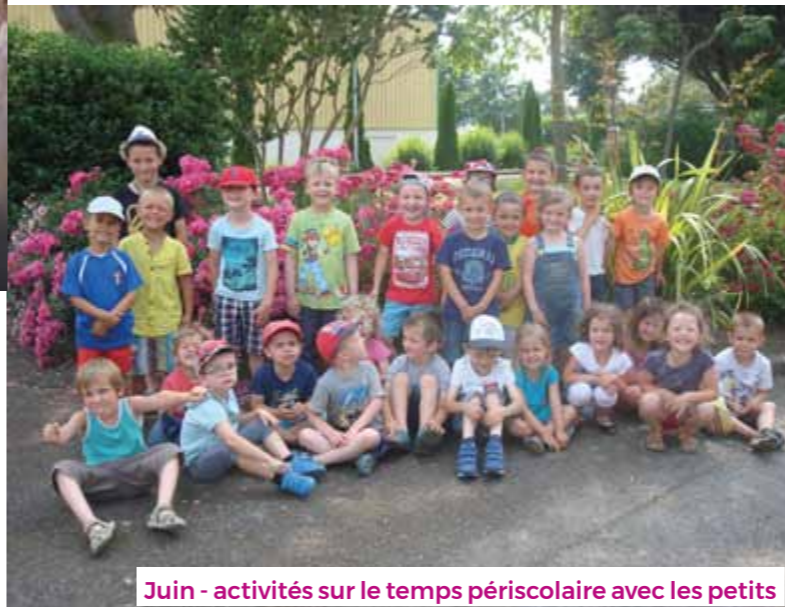
Juin - activités sur le temps périscolaire avec les petits