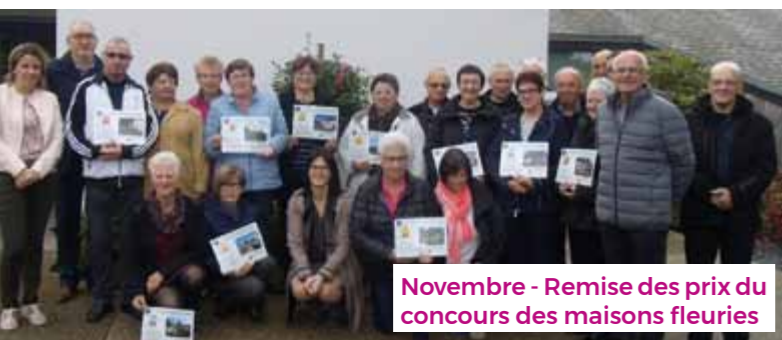
Novembre - Remise des prix du concours des maisons fleuries