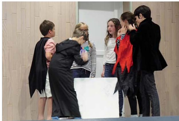
Le spectacle de fin d'année des enfants et ados.

Notre association a refait le plein (ou presque) de ses adhérents en septembre dernier. Pour celles et ceux qui l'ignoraient encore, nous proposons de multiples activités à tous les habitants, de tout âge, de Saint-Martin et des localités avoisinantes. Nous vous les rappelons dans le tableau ci-dessous afin de prendre le temps de vous décider pour les inscriptions 2020/21.