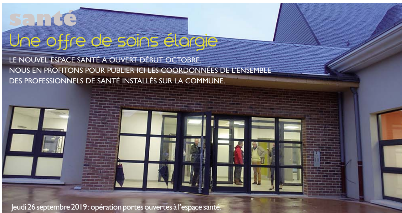
Jeu di 26 septembre 2019 : opération portes ouvertes à l'espace santé.

LE NOUVEL ESPACE SANTÉ A OUVERT DÉBUT OCTOBRE. NOUS EN PROFITONS POUR PUBLIER ICI LES COORDONNÉES DE L'ENSEMBLE DES PROFESSIONNELS DE SANTÉ INSTALLÉS SUR LA COMMUNE.