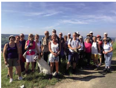
En rando, on pause pour la pose photo.

LE CLUB DE RANDONNÉE CHANGE DE DIRECTION MAIS PAS DE CAP.