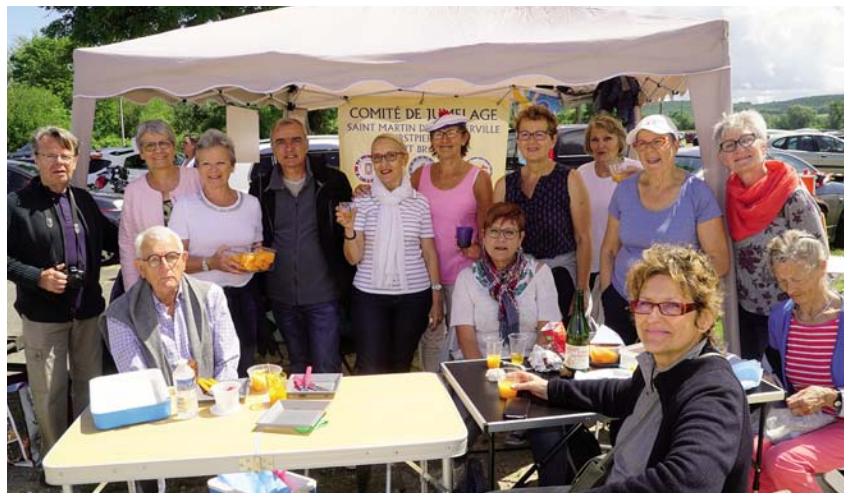
Forte présence de l'équipe du Comité de jumelage à la Grande Parade de l'Armada.