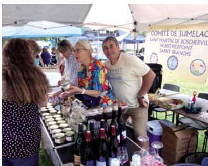
Ambiance franco-britannique sur les marchés de juin.