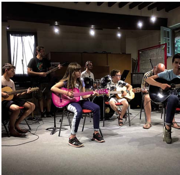
Les auditions de l'école de musique.

TROIS IMAGES DE L'ANNÉE PASSÉE, ET LE RAPPEL DES ACTIVITÉS PROPOSÉES PAR NOTRE ASSOCIATION.