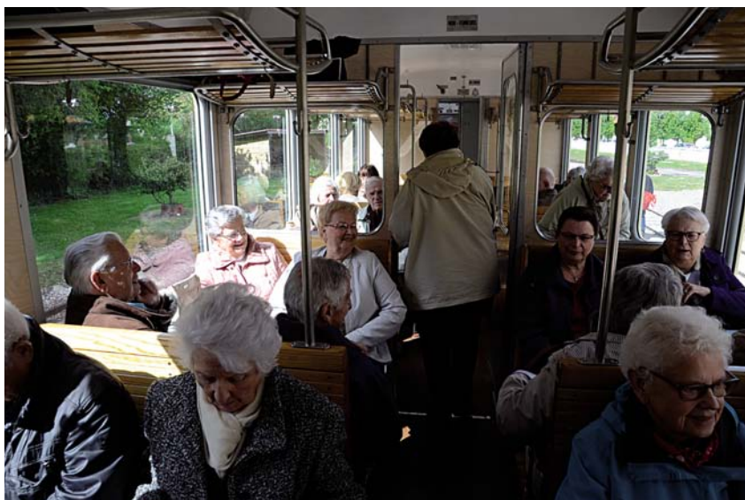
Dans le petit train à vapeur de la baie de Somme, en mai dernier.

En septembre, pour la « rentrée » du club, nous nous retrouvons désormais autour d'un buffet campagnard. Le 9 septembre dernier, il était préparé par la boucherie-charcuterie et la boulangerie-pâtisserie de Saint-Martin. Les salades, épluchées et mises en sauce par nos soins, nous