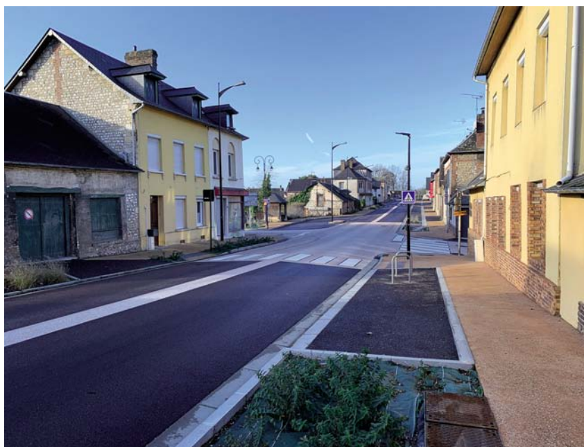
Une traversée du village plus esthétique et sécurisée.

sionnels de santé déjà installés et à ceux qui les ont rejoints, d'avoir des locaux de qualité adaptés à leurs activités. En parallèle, nous avons consacré de nombreuses heures pour convaincre d'autres professionnels de les rejoindre. Efforts 100% gagnants car 100% de la capacité du nouveau bâtiment est utilisée !