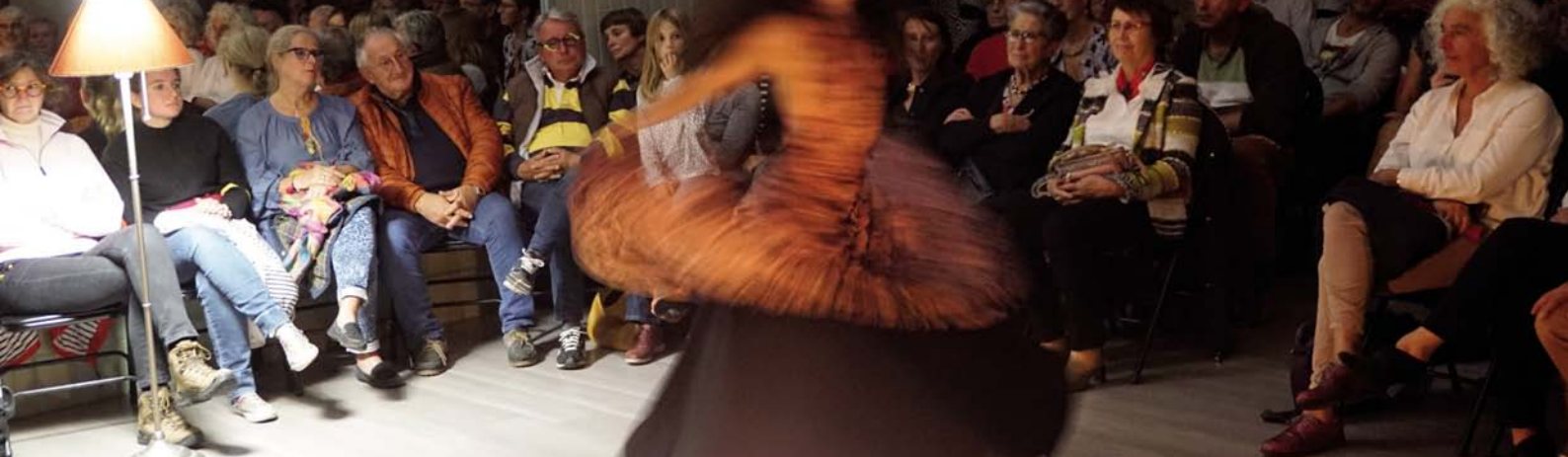
Après le flamenco, envoûtante séance de derviche tourneur.

NOUVEAU ET ORIGINAL, CE RENDEZ-VOUS MUSICAL A INVESTI DES LIEUX INSOLITES.