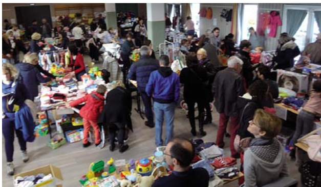
Deux temps forts de l'année : le Salon de la puériculture et du jouet et le marché de Noël.