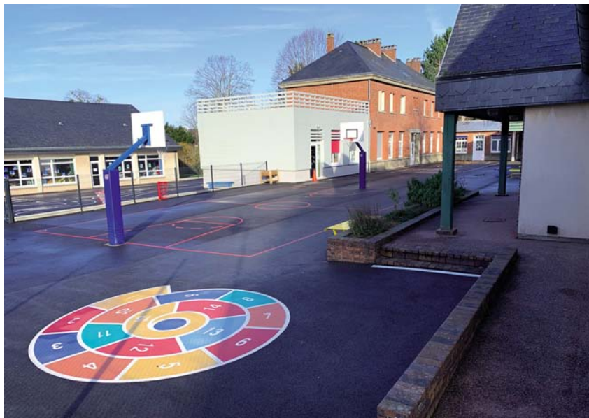
Une nouvelle cour d'école aux normes PMR.

À une époque où les déserts médicaux font la une des journaux, l'équipe municipale a souhaité développer un projet de maison médicale pour assurer un service de qualité aux Boschervillais(es) dans les années à venir. Ce projet initié en septembre 2018 a été conçu en partenariat avec les professionnels de santé déjà installés dans notre commune, afin que les futurs équipements répondent à leurs attentes. Il s'agit d'un seul et même projet décomposé en deux tranches pour un seul permis de construire : une tranche ferme (la première phase de travaux) concernant la construction d'un nouveau bâtiment ; une tranche conditionnelle (celle qui a été lancée partiellement), reposant sur la restructuration du bâtiment de la Poste, prévue initialement pour accueillir des commerces mais finalement consacrée à l'arrivée d'autres professionnels de santé venant encore élargir l'offre de soins. Nous n'avons pas ménagé notre énergie pour garantir aux profes-