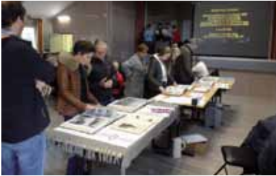
L'exposition de la salle des fêtes.

Moment émouvant, car rendu très vivant, d'évoquer les espoirs et les peurs de ces soldats, souvent jeunes, engagés dans un conflit dont l'ampleur et l'absurdité les dépassaient. L'intérêt que cette exposition a suscité, les échanges et témoignages, sont l'illustration que la Première Guerre mondiale a profondément marqué nos inconscients et est toujours très présente encore aujourd'hui.