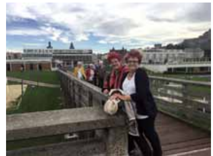
Ambiance cabaret pendant le déjeuner, et bouffée d'air marin pour digérer...