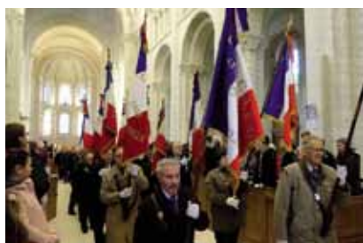
La messe du souvenir.