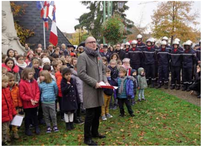
La lecture du poème For the fallen devant le monument aux morts.