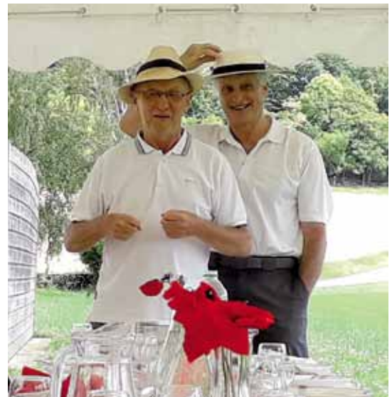
Visite à Jumièges et repas, en présence des présidents anglais et français des deux comités de jumelage. Ci-dessous : à Saint-Martin après le tournoi de golf, avec nos amis d'outre-Manche.