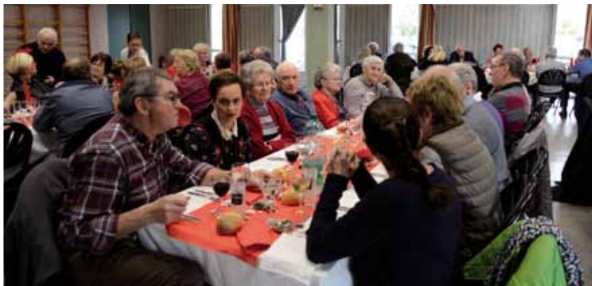
La croisière sur le lac de Rabodanges et le repas de Noël.

Le club Au fil de l'amitié vous propose des jeux, des sorties, de la convivialité... Nous nous réunissons le plus souvent le premier lundi de chaque mois, sauf en juillet-août, à 14h au foyer socio-culturel pour y jouer aux cartes, dominos ou triominos, Scrabble, selon les goûts de chacun ou les partenaires du jour. Vers 16h, un goûter est servi : chocolat, thé ou autre boisson accompagnée de brioche de la boulangerie Chef-deville de Saint-Martin. Il y a aussi quelques rendez-vous exceptionnels : en février, le goûter crêpes confectionnées par les adhérent(e)s ; en mai, une sortie en car d'une journée.