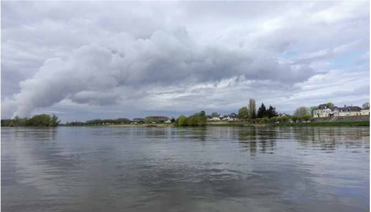
Reflets du ciel de Touraine dans les eaux calmes de la Loire : comme dans un tableau...

L'ANNÉE PASSÉE S'EST NOTAMMENT TRADUITE PAR UNE BELLE VIRÉE TOURANGELLE, ENTRE FOIRE AUX OIGNONS, EXCURSION FLUVIALE, CONCERT ET DÎNER.