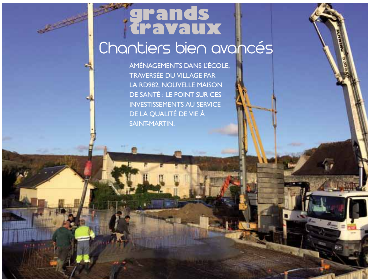
Le chantier de la maison pluridisciplinaire de santé.