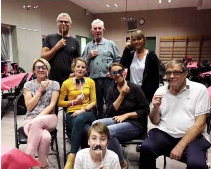
Moustaches et nœuds pap' pour les bénévoles de la soirée magie.

ENTRE SOIRÉE DANSANTE AVEC TOURS DE MAGIE, FÊTE DE JUIN ET RANDONNÉE GOURMANDE, LES BOSCHERVILLAIS SONT VENUS NOMBREUX AUX RÉJOUISSANCES ORGANISÉES EN 2018 PAR LE COMITÉ DES FÊTES.