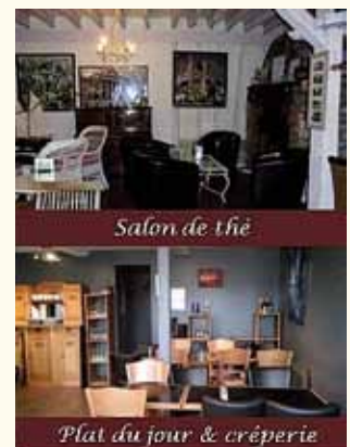
Plat du jour & crêperie

2, place de l'Abbaye 76840 Saint-Martin de Boscherville Tél. 02 32 80 18 38 - labelledemai76@orange.fr