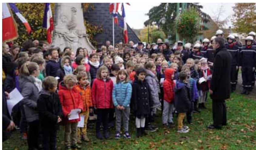
Cérémonie du 11 novembre : les enfants chantent sous la conduite de leur professeur.

Les enseignants sollicités ont tout de suite adhéré avec enthousiasme au projet. Outre l'apprentissage de quelques chants, ils ont fait réfléchir les élèves de l'école primaire sur le souvenir et l'évocation de cette période marquante de notre histoire