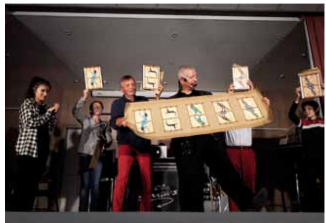
Soirée magie : la préparation des « ardoises » de charcuterie et l'un des tours spectaculaires des « Christies ».