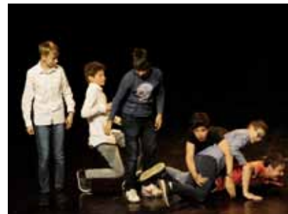
La pièce jouée par la troupe adulte d'Ensemble et le spectacle de fin d'année scolaire des jeunes.