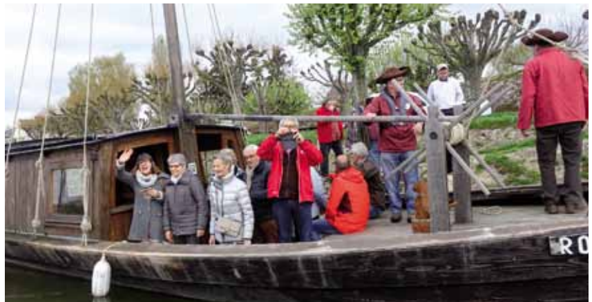
La balade en gabarre sur la Loire (autre photo en page 14).

Après une courte nuit, visite de la Foire aux oignons (qui est également un gigantesque vide-grenier). Après avoir englouti la soupe à l'oignon et les grillades, retour vers la Normandie.