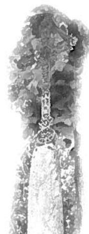
La Croix de Mission du Plamaz a été montée sur un socle de la période Burgonde

Beaucoup de croix de mission ont été construites pour perpétuer le souvenir de ces événements, sur proposition du curé Chevalier, curé de St Jean d'Arvey de 1820 à 1861.