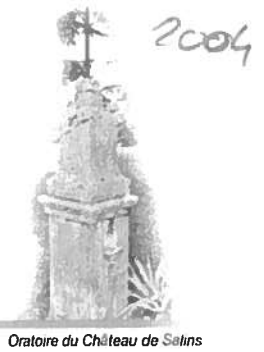
Oratoire du Château de Selins

La fête du patrimoine en 2003 avait pour thème «le patrimoine spirituel». La Paroisse de St Jean d'Arvey a proposé une exposition et la visite de l'église.