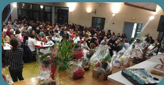
Loto des écoles - novembre 2019