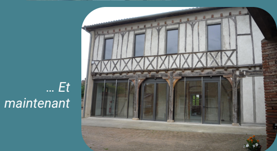
... Et maintenant