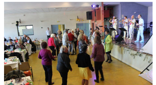
Repas des aînés, janvier 2020

En 2021, dans la situation sanitaire actuelle, le repas des aînés n'aura pas lieu. En Janvier, un colis sera offert aux couples ou personnes isolées âgés de 80 ans au 31 décembre 2020 pour pallier à l'annulation de cet événement cher au cœur des dauxéens.