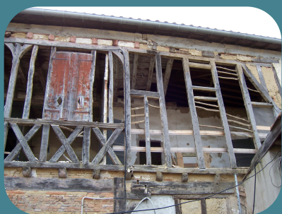
Pendant les travaux...