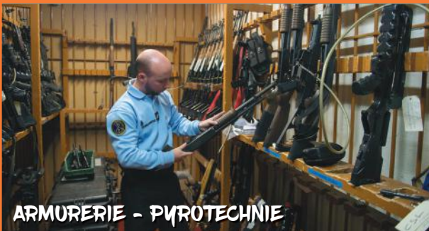
ARMURERIE - PYROTECHNIE