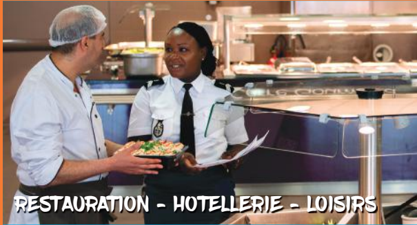
RESTAURATION - HOTELLERIE - LOISIRS