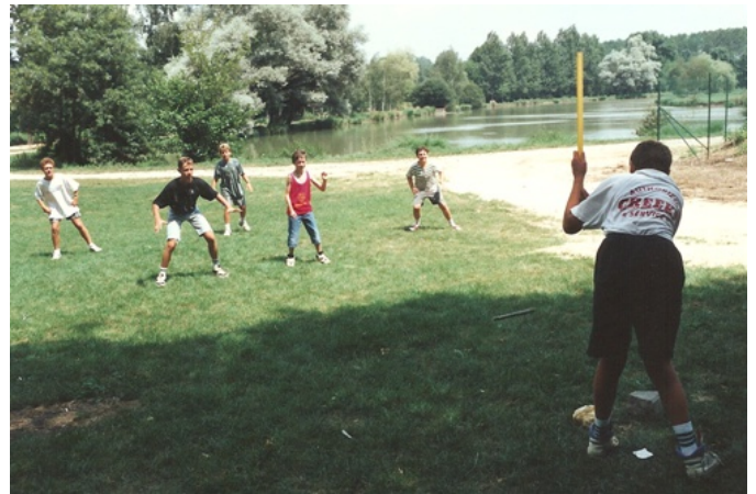
JEU DE LA PIROUETTE Au plan d'eau en Juillet 1995

Le matériel nécessaire : deux grosses pierres, un grand bâton de 80 cm à 1 m, et un petit bâton de 20-25 cm (la piroquette) ; les joueurs de l'équipe qui est « aux pierres » lancent les uns à la suite des autres la « piroquette », en la frappant avec le grand bâton, vers l'espace où sont dispersés les joueurs de l'autre équipe, dont le rôle est de rapprocher la « piroquette » le plus près possible des pierres ; on compte la distance à l'aide du grand bâton ; seule l'équipe des lanceurs marque.