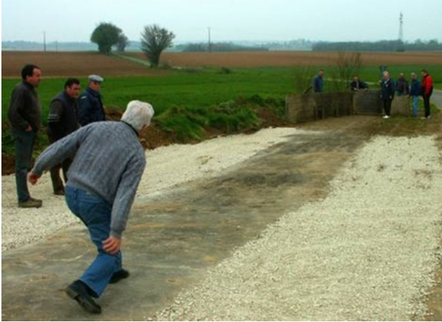
JEU DE RAMPEAU à VILLEFAGNAN (16) en 2003

Le Rampeau est un jeu de quilles (trois quilles en ligne) ; les joueurs misent, et re-misent selon le résultat des lancers ; les sommes en jeu peuvent devenir très importantes, et c'est pourquoi le jeu a subi des interdictions.