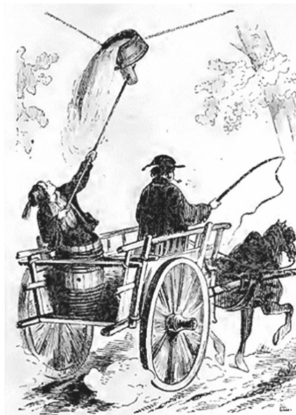
Le JEU DU BAQUET

Il nous a été signalé à Gençay un jeu assez ancien qui se pratiquait généralement dans les régions depuis le Moyen-Age : le jeu du baquet.