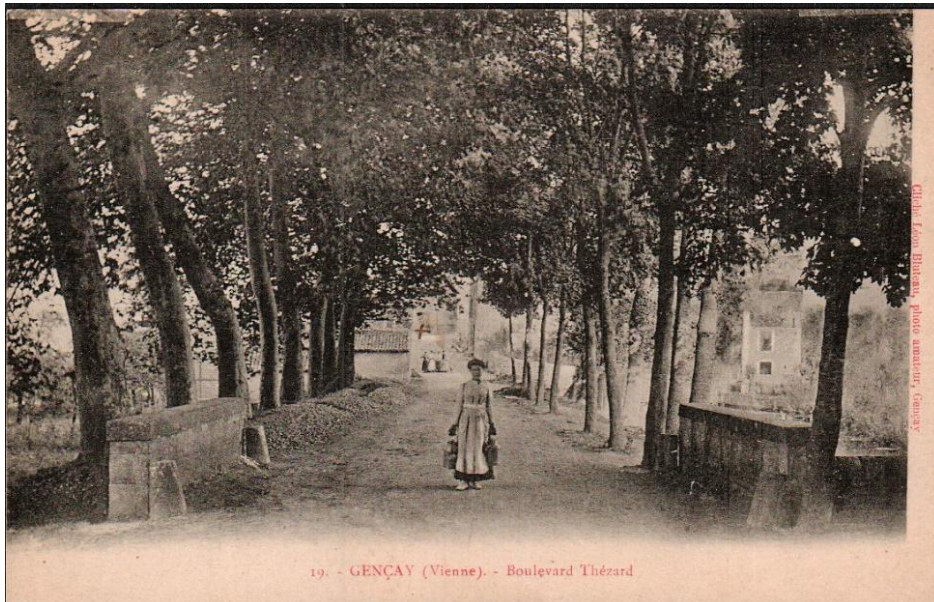
Gençay, Boulevard Thézard