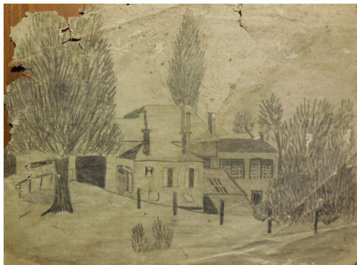
Dessin de Arlette Guillemot

Nous ne connaissons pas l'état civil de cet arbre majestueux qui trônait à l'entrée de la cour de la laiterie-fromagerie. Nous connaissons sa fin tragique lors de l'ouragan de 1999. Peut-être, peut-on imaginer, qu'il ait été planté lors de la construction de la laiterie en 1933.