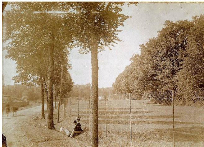
La route de Poitiers bordée d'arbres au début du 20 e s.

Au début du XX e siècle, comme en témoigne la photo, la route venant de Poitiers était bordée d'arbres jusqu'au pont à l'entrée du bourg. Nous n'avons pas de renseignements précis sur cette plantation.