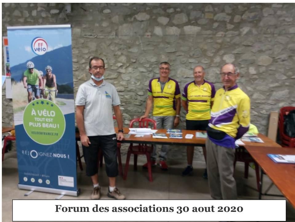
Forum des associations 30 aout 2020