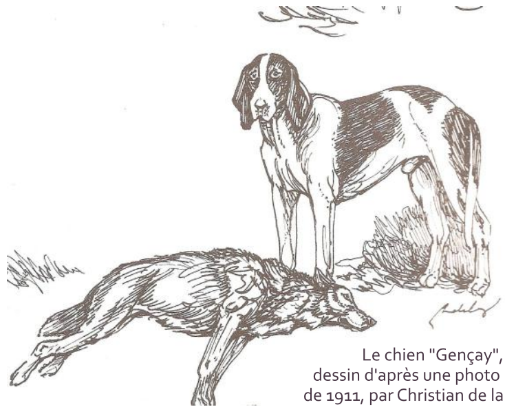
Le chien "Gençay", dessin d'après une photo de 1911, par Christian de la Verteville pour l'édition de "Ecoute en Tête!" de 1990.

« Si un milliardaire, épris du courre du grand maraudeur, était venu m'offrir un lingot d'or, représentant une somme excentrique, il ne m'aurait pas tenté, car pour le fanatique que je suis, rien ne peut payer le plaisir fou de voir le travail et le courre d'un vieux loup par un lot de chiens volants sur la voie (...) Parmi cette pléiade, se place en tête mon célèbre « Gençay » dont la réputation restera légendaire dans le pays ! »