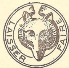
Le bouton de l'équi- page "Rallye-Gençay" (1902-1955)

Chiens : tout à gauche: Maraudeur (50% loup) Rasta (50% loup), puis Quasimodo, Wagram, Gençay, Noctambule.....