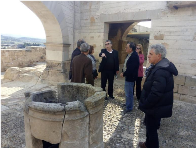
Vue intérieure de la cour du Château