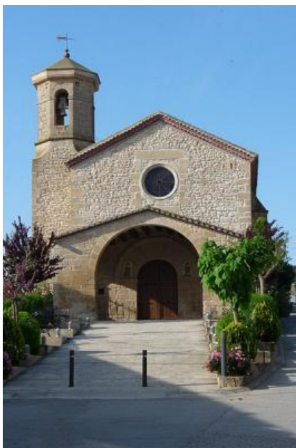
Chapelle de l'Ermitage