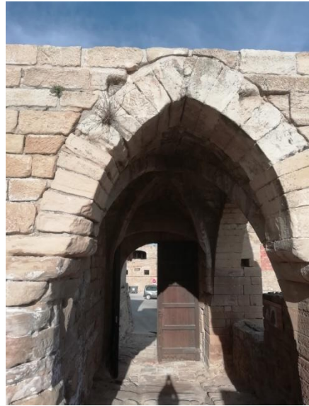
Vue de l'entrée principale du Château