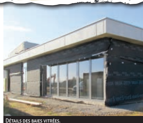
DÉTAILS DES BAIES VITRÉES.