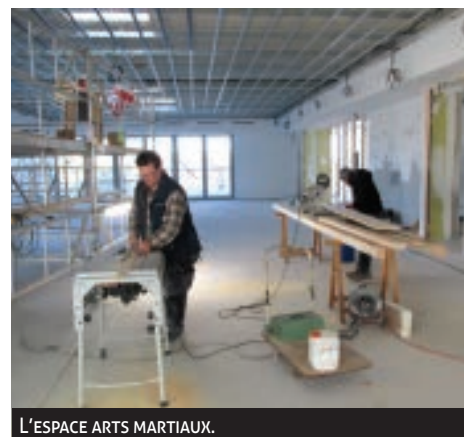
L'ESPACE ARTS MARTIAUX.