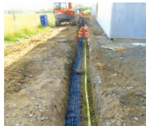
ENFOUISSEMENT DES RÉSEAUX.