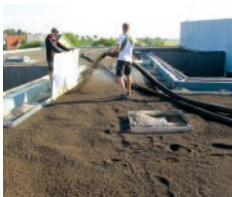
PRÉPARATION DES TOITURES VÉGÉTALISÉES.