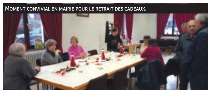
MOMENT CONVIVAL EN MAIRIE POUR LE RETRAIT DES CADEAUX.