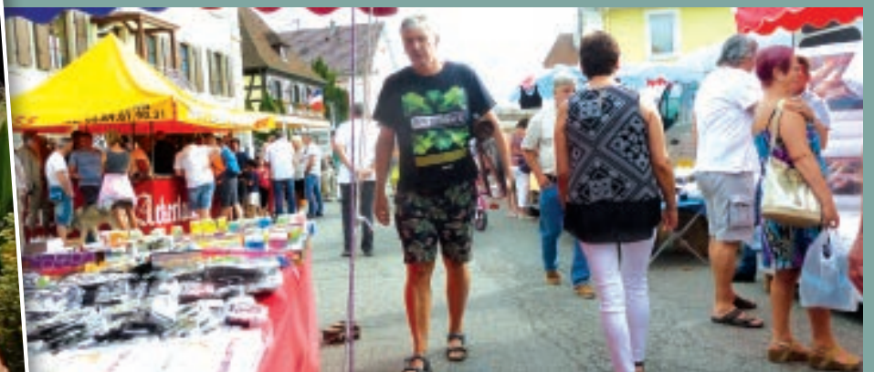
LE DIMANCHE LE TRADITIONNEL MARCHÉ AUX PUCES ET LE CHÂTEAU GONFLABLE POUR LES ENFANTS.