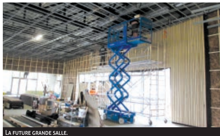
LA FUTURE GRANDE SALLE.