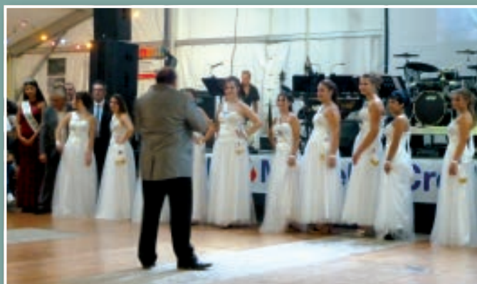
LES CANDIDATES DE LA 39 e ÉDITION DE LA FÊTE DES LENTILLES.