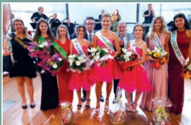
LA MISS 2019 ET SES DAUPHINES, AINSI QUE LA MISS 2018 ET SA 1 re DAUPHINE (À DROITE) ET LES REPRÉSENTANTES DE VATAN.