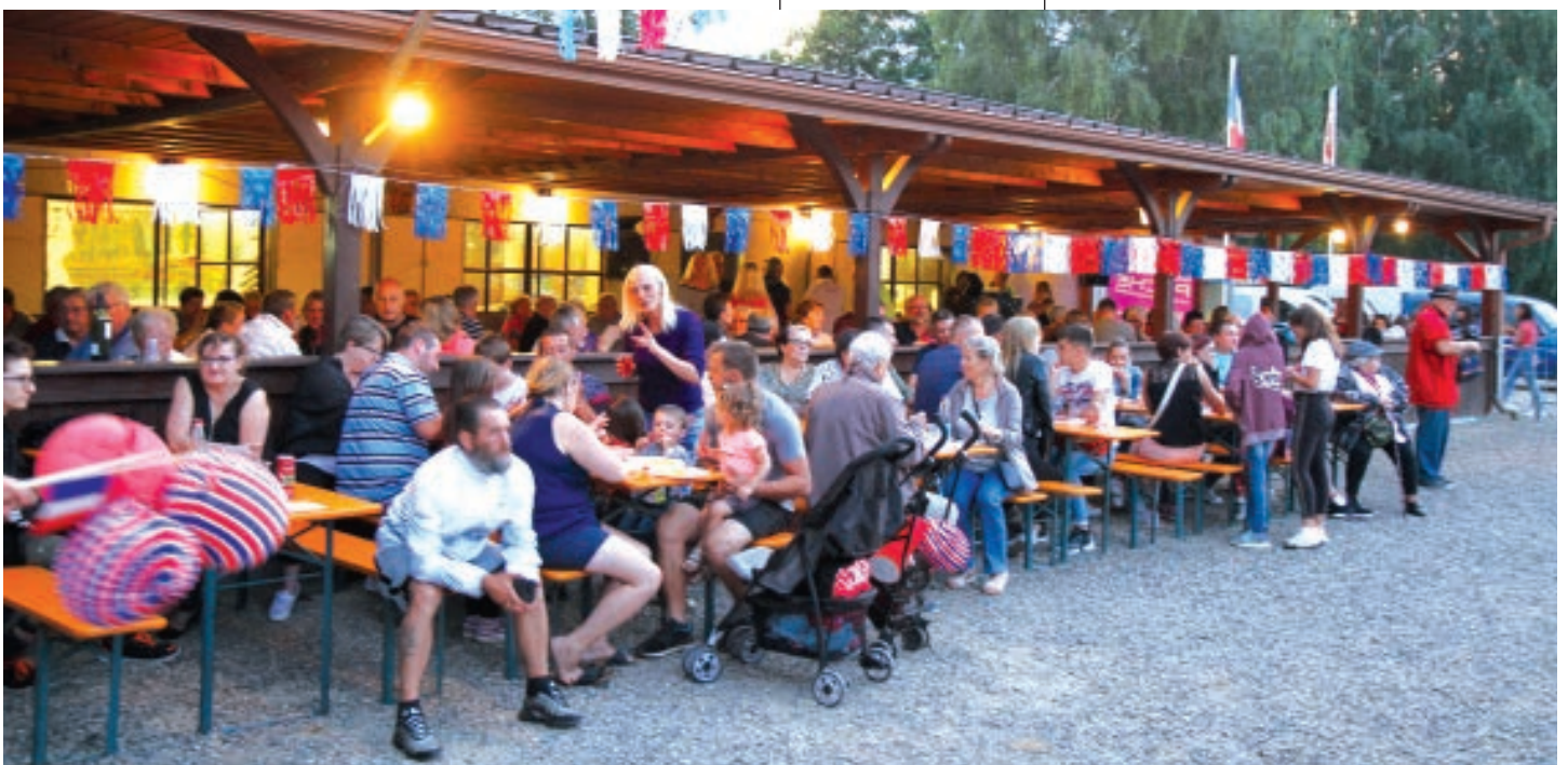
LA JOURNÉE S'EST CONTINUÉE À L'ÉTANG DE PÊCHE EN ATTENDANT LE FEU D'ARTIFICE.

Il est prévu aussi d'améliorer la visibilité dans une courbe rue des Mésanges en supprimant de la végétation sur le domaine public. ■