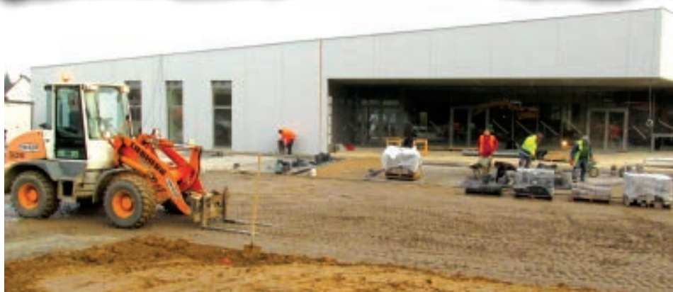
TRAVAUX D'ACCÈS DE L'ENTRÉE PRINCIPALE.