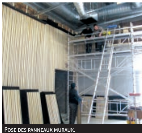
POSE DES PANNEAUX MURAUX.