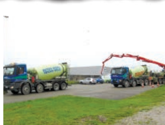
ROTATION DES CAMIONS CIMENT.