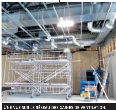
UNE VUE SUR LE RÉSEAU DES GAINES DE VENTILATION.