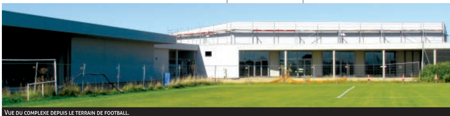
VUE DU COMPLEXE DEPUIS LE TERRAIN DE FOOTBALL.