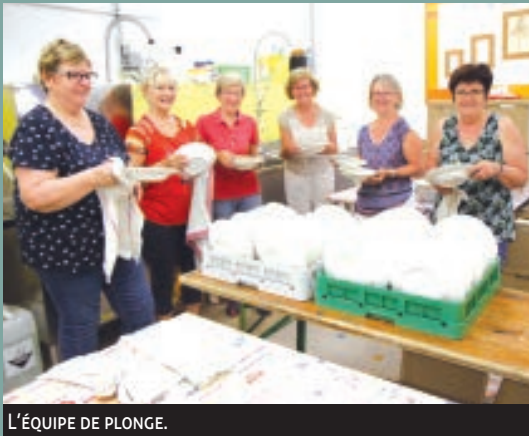
L'ÉQUIPE DE PLONGE.