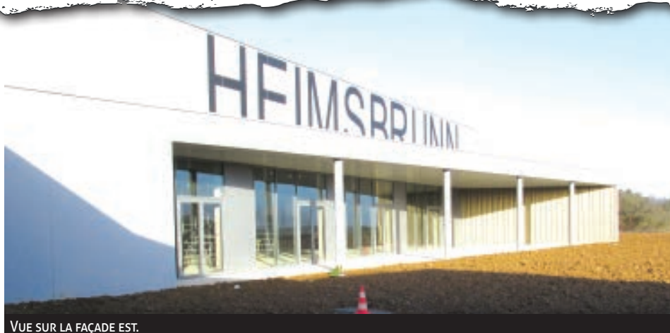
VUE SUR LA FAÇADE EST.