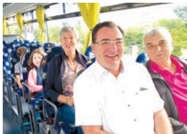
RETOUR VERS HEIMSBRUNN AVEC LES ÉLÈVES DE GALVINGUE.