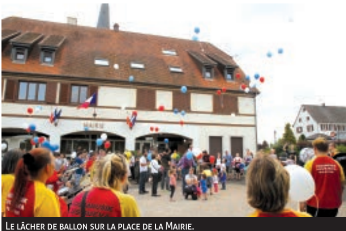
LE LÂCHER DE BALLON SUR LA PLACE DE LA MAIRIE.