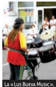
LA «LUS BUEVA MUSIC».