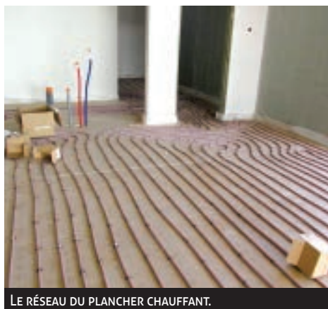
LE RÉSEAU DU PLANCHER CHAUFFANT.