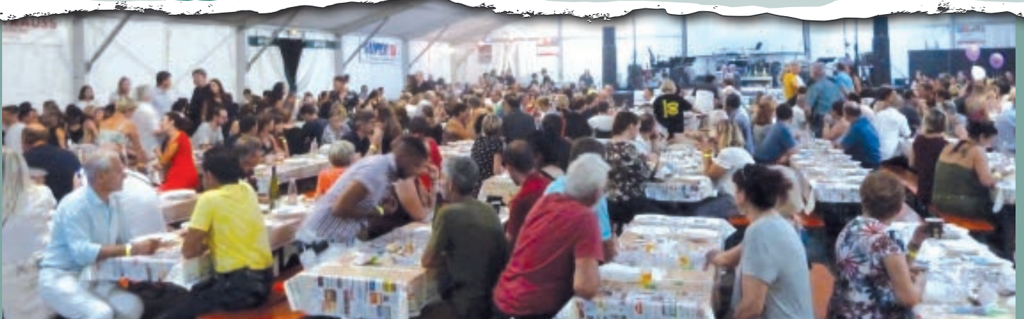
DE NOMBREUX AMATEURS DE LA SOUPE AUX LENTILLES.