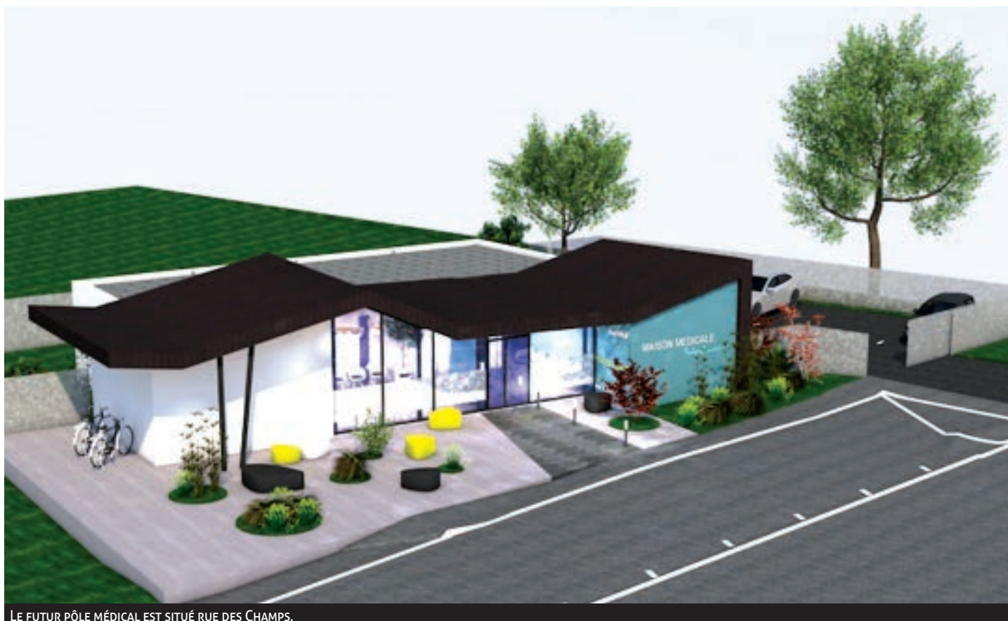
LE FUTUR PÔLE MÉDICAL EST SITUÉ RUE DES CHAMPS.