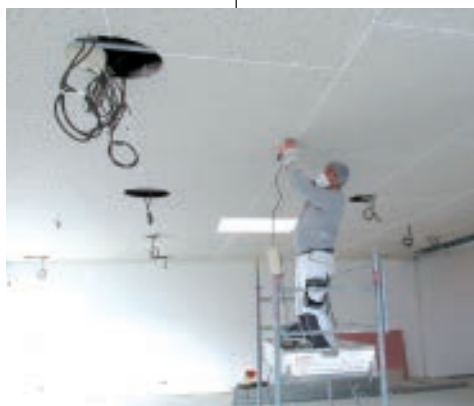
PONÇAGE DES PLAFONDS.