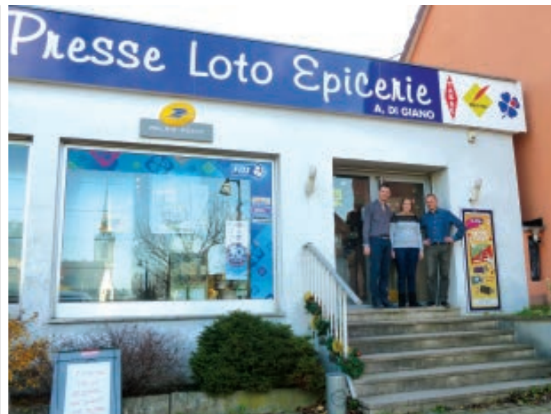
LE TABAC-PRESSE-LOTO-ÉPICERIE TRÈS APPRÉCIÉ PAR LES HABITANTS.