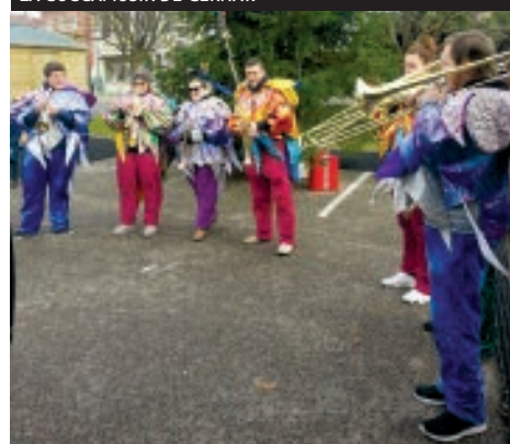
LA GUGGAMUSIK DE CERNAY.

Le Père Noël est également passé au marché de Noël pour distribuer des clémentines et chocolat et récupérer les lettres que les enfants lui ont déposés dans la boîte prévue à cet effet. ■