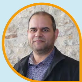
Maire Christophe MASSALOUP