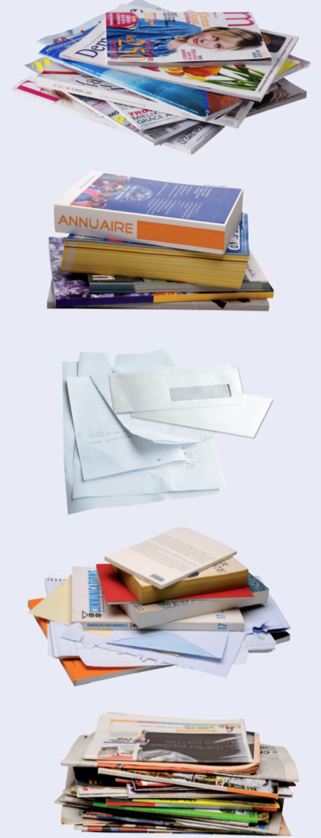
Tous les papiers