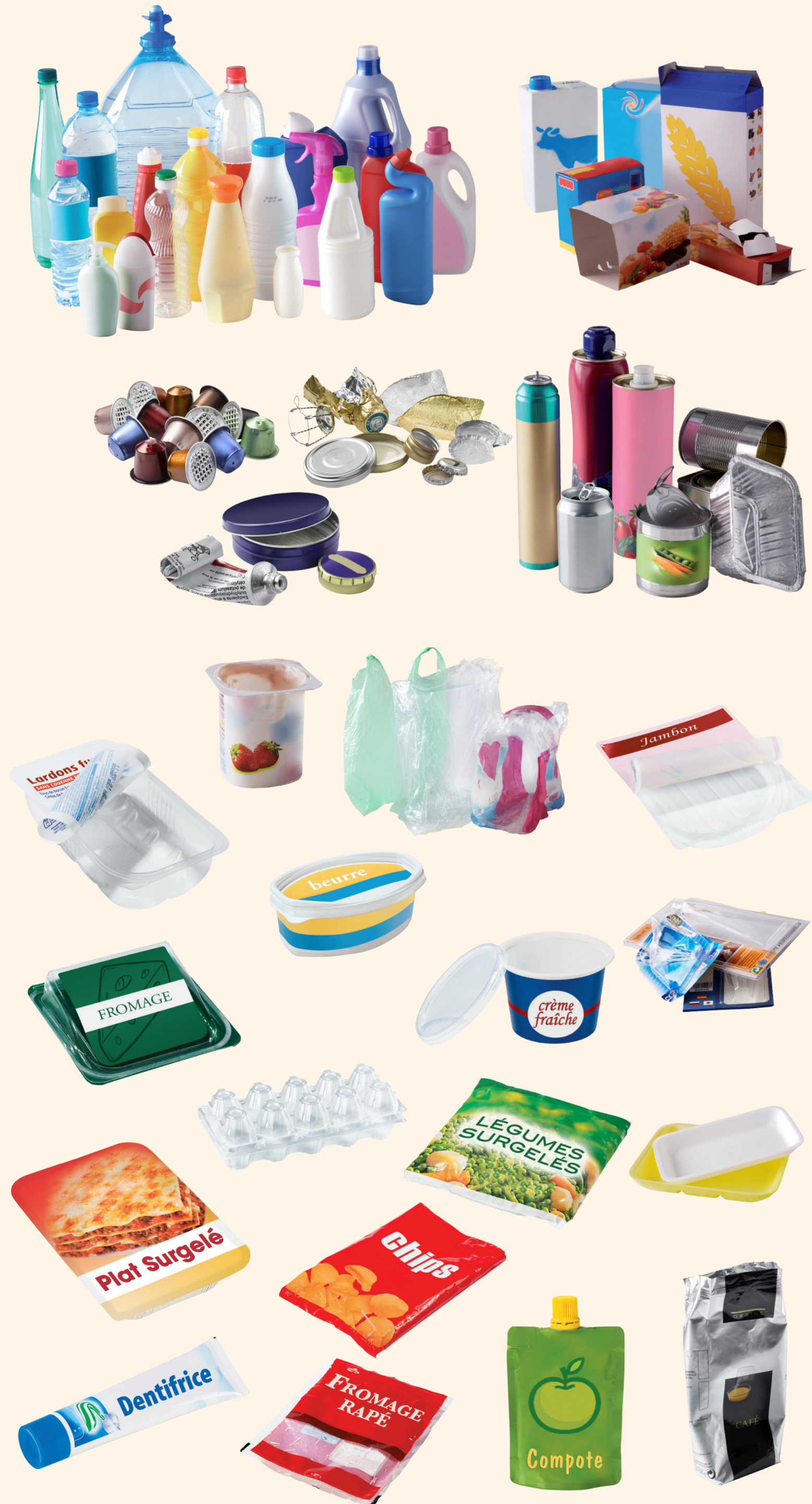
Tous les emballages