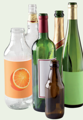
Bouteilles, pots et bocaux