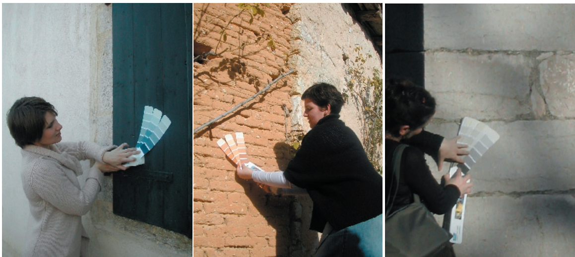
Sur le terrain, relevés chromatiques à l'aide de nuanciers

La charte chromatique est un outil qui n'entrave pas les goûts et les aspirations individuelles tout en s'incluant dans une problématique générale. Cette charte est consultable par tous les Monteillais à la mairie.