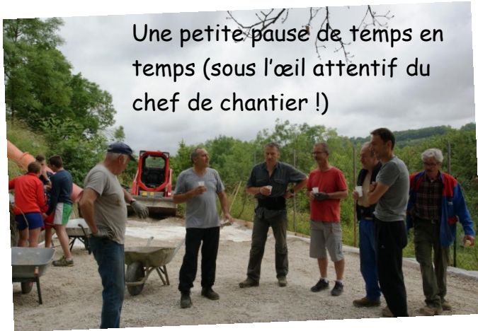
Une petite pause de temps en temps (sous l'œil attentif du chef de chantier !)

rencontres et les animations pour atteindre l'objectif visé : que les habitants de la commune se saisissent de cet espace dans un esprit de partage. Cela paraît indispensable en cette période agitée, afin de favoriser au mieux le vivre et le faire ensemble.