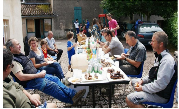
Un chantier terminé dans la convivialité