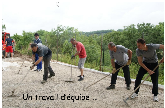
Un travail d'équipe ...

Enfin, l'aménagement du terrain de boules de l'E.C.S. a été réalisé avec l'aide de nombreux Saliessois, jeunes et adultes confondus, dans une excellente ambiance. Merci à tous !