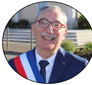
Le maire, Jean-Philippe LHÔTELAIS Quartier des Pavillons de la Côte

Le mercredi en semaine paire Le samedi en semaine impaire De 9 h 00 à 11 h 30