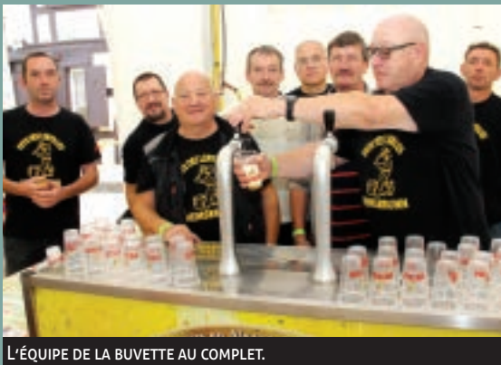
L'ÉQUIPE DE LA BUVETTE AU COMPLET.