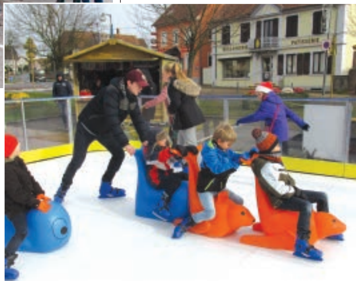
LA PATINOIRE A SON PUBLIC.

Nous vous donnons rendez-vous en 2019 pour notre 13 e marché de Noël. ■