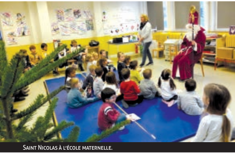
SAINT NICOLAS À L'ÉCOLE MATERNELLE.