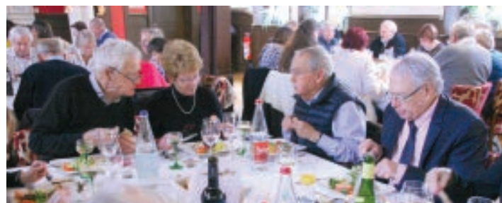
MOMENT CONVIVAL EN MAIRIE POUR LE RETRAIT DES CADEAUX.