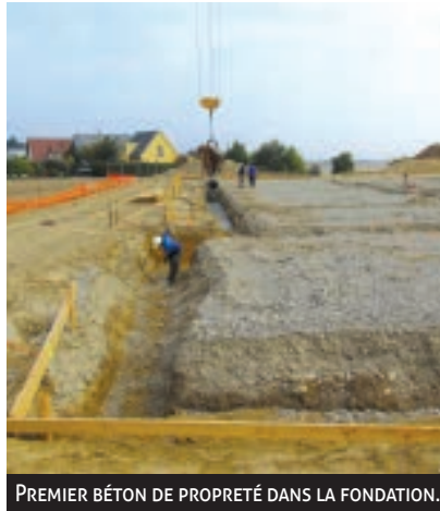
PREMIER BÉTON DE PROPRIÉTÉ DANS LA FONDATION.