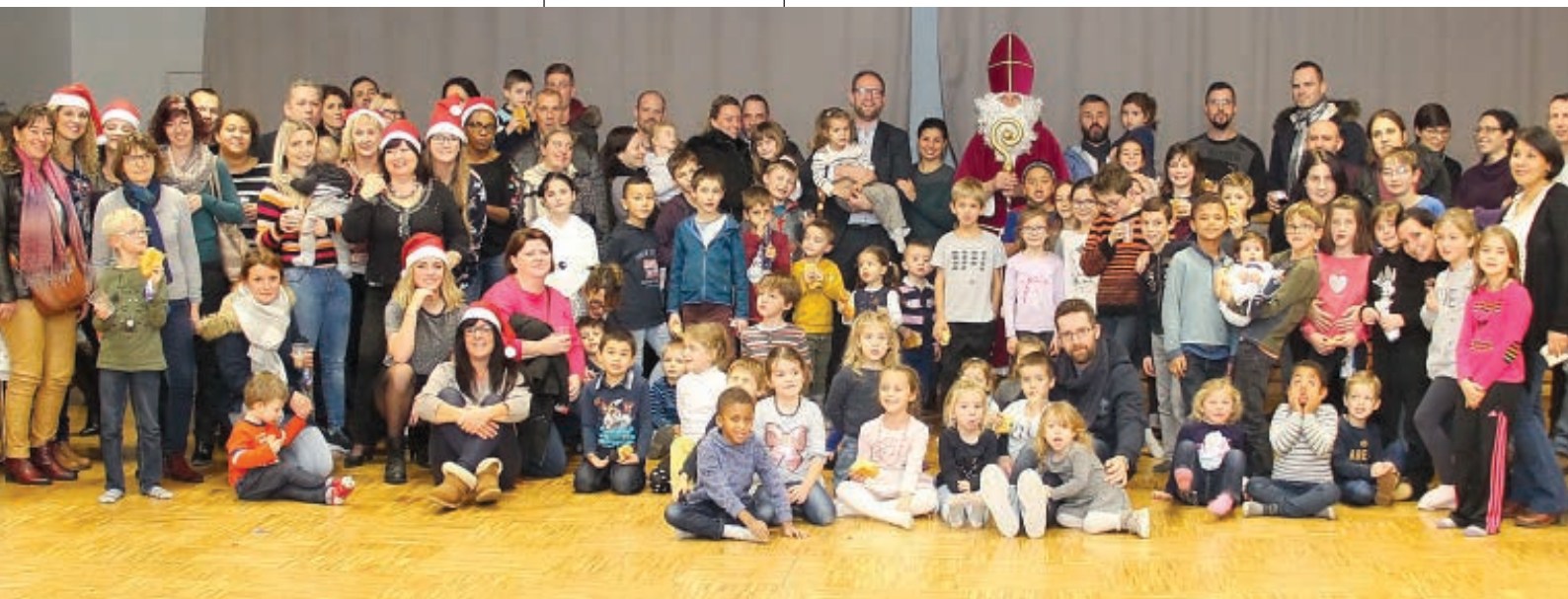
PRÈS DE 150 PERSONNES ÉTAIENT PRÉSENTES AUTOUR DE SAINT NICOLAS.