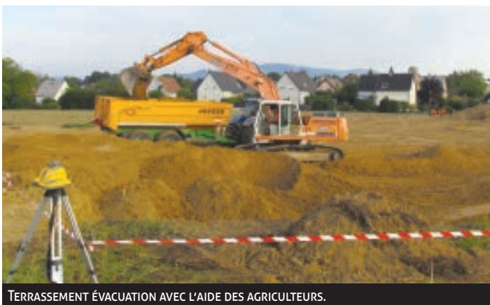
TERRASSEMENT ÉVACUATION AVEC L'AIDE DES AGRICULTEURS.