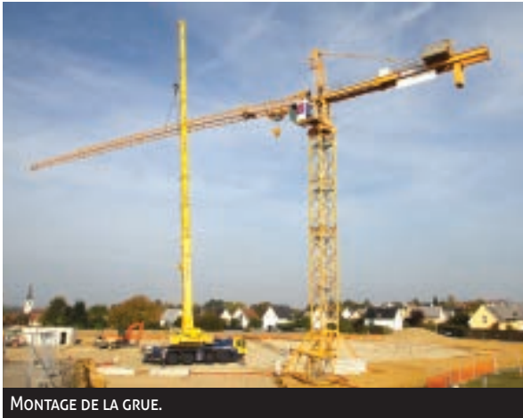
MONTAGE DE LA GRUE.