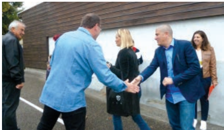
ACCUEIL DES PARENTS PAR LES DEUX MAIRES ET LA DIRECTRICE, À GALFINGUE.