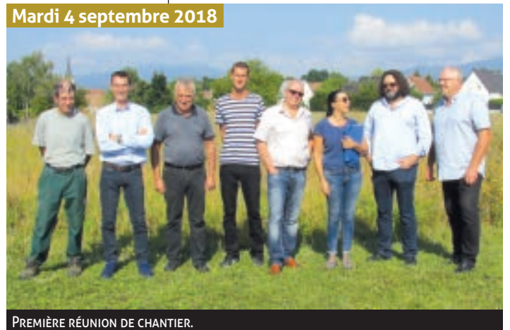
PREMIÈRE RÉUNION DE CHANTIER.