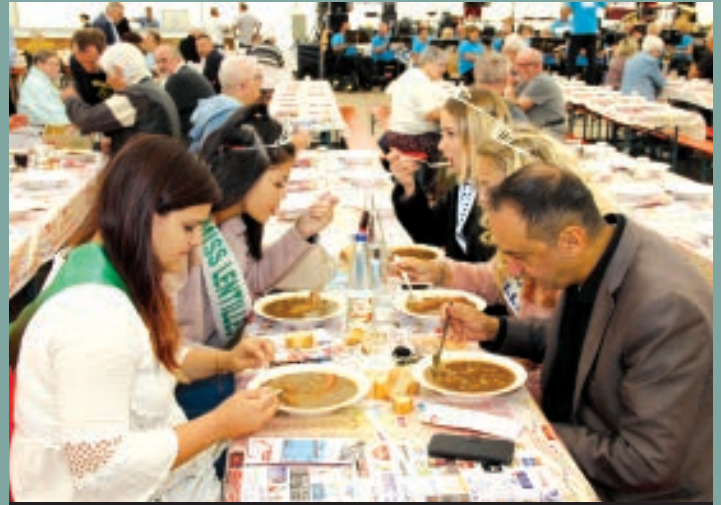
LES MISS AIMENT AUSSI LA SOUPE DE LENTILLES.