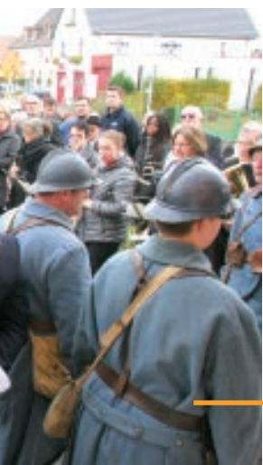
DES SAPEURS-POMPIERS ONT ÉGALEMENT ÉTÉ MIS À L'HONNEUR.