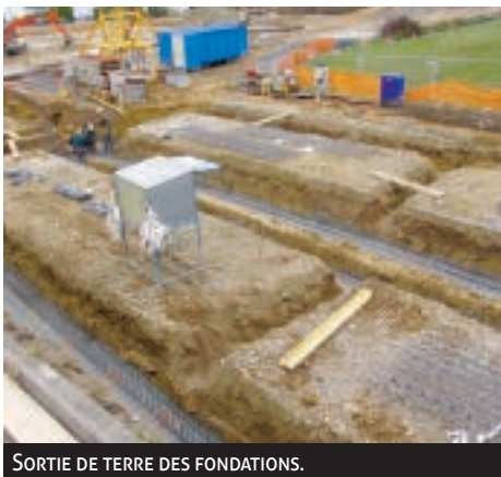
SORTIE DE TERRE DES FONDATIONS.