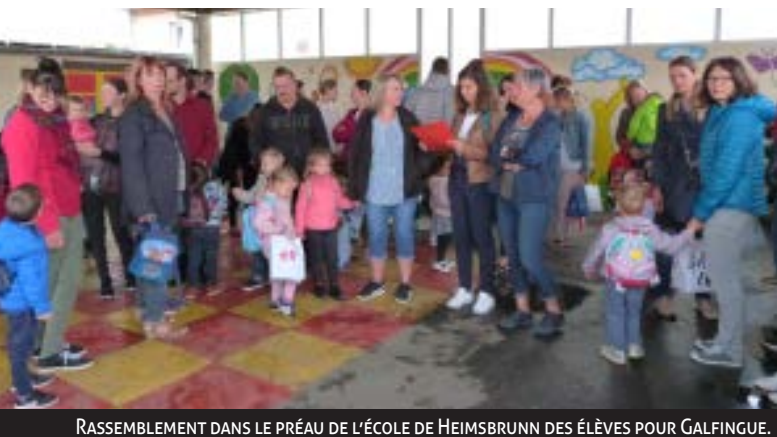
RASSEMBLEMENT DANS LE PRÉAU DE L'ÉCOLE DE HEIMSBRUNN DES ÉLÈVES POUR GALFINGUE.

La fusion administrative des deux écoles souhaitée par les communes et privilégiée par l'Éducation Nationale a permis de désigner une direction unique pour les deux sites permettant ainsi une réelle cohérence dans le parcours scolaire et un projet pédagogique commun.