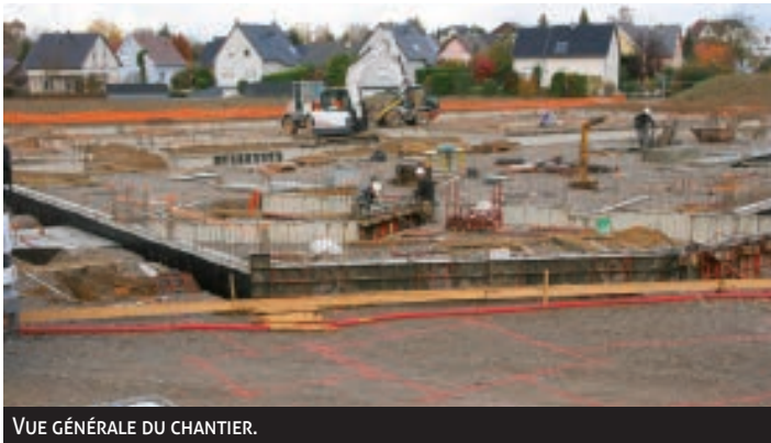
VUE GÉNÉRALE DU CHANTIER.