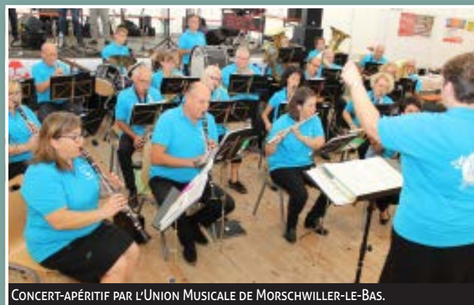
CONCERT-APÉRITIF PAR L'UNION MUSICALE DE MORSCHWILLER-LE-BAS.