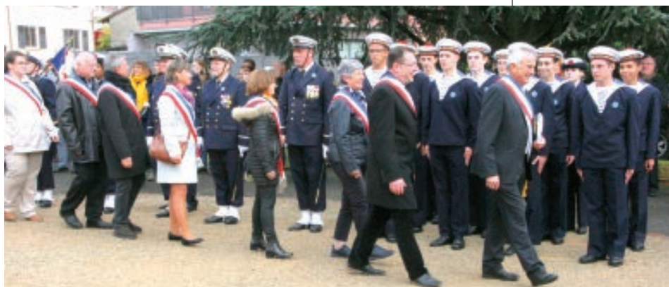
LA PRÉPARATION MILITAIRE MARINE DE BELFORT.