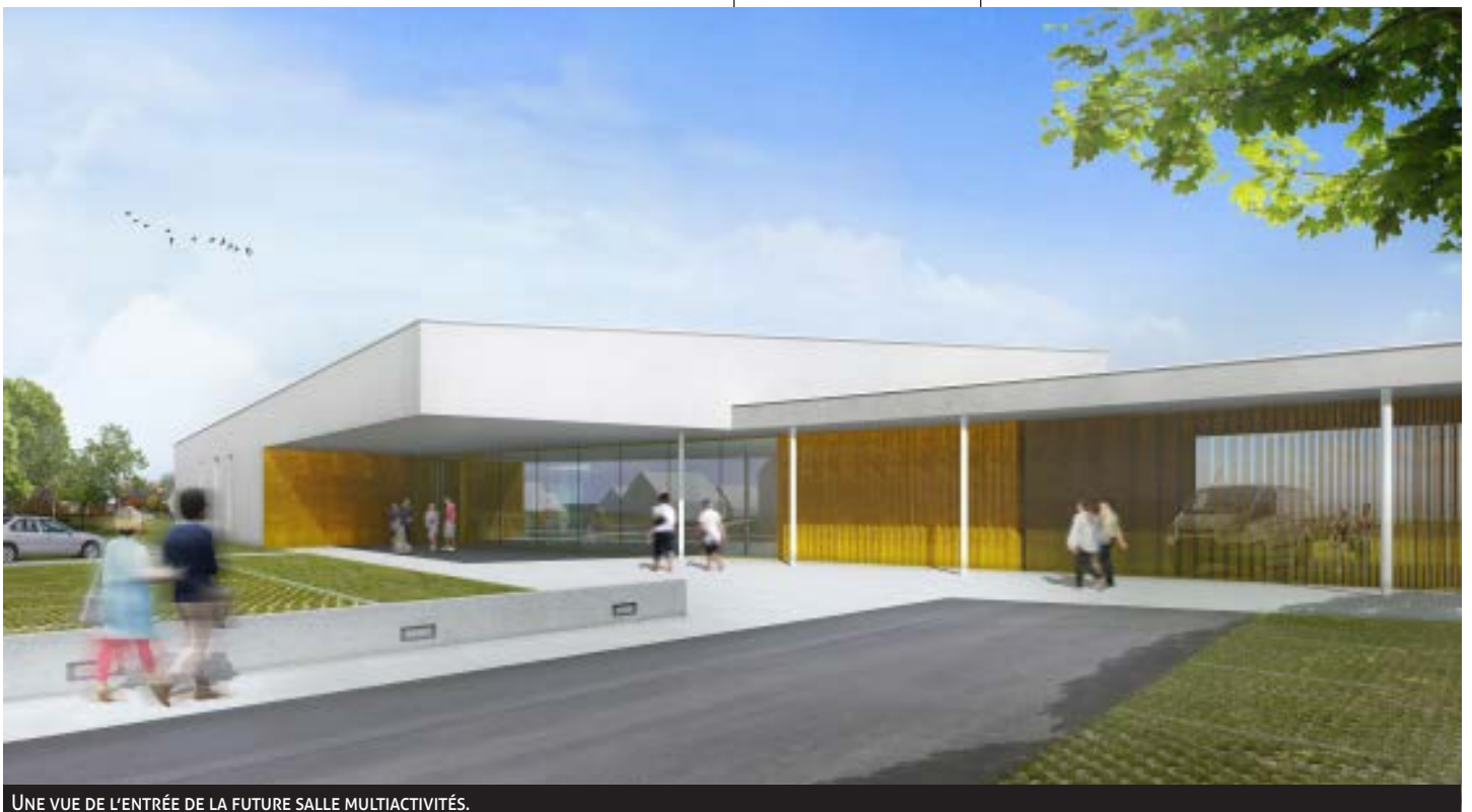
UNE VUE DE L'ENTRÉE DE LA FUTURE SALLE MULTIACTIVITÉS.