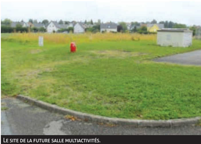
LE SITE DE LA FUTURE SALLE MULTIACTIVITÉS.