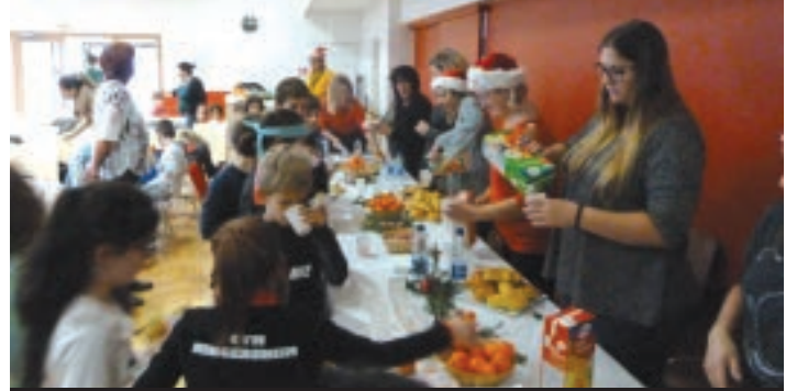
LE GOÛTER SERVI À L'ISSUE DU SPECTACLE.

L'après-midi s'est terminé par des chants de Noël sous la direction de Véronique BAUDENDISTEL, devant des parents conquis. E. L.