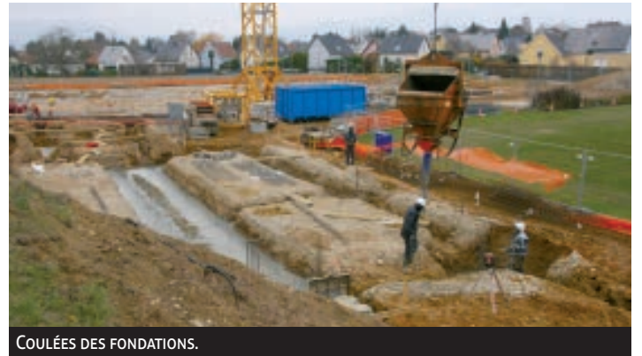
COULÉES DES FONDATIONS.