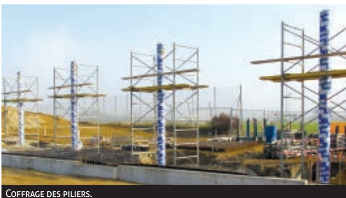
COFFRAGE DES PILIERS.