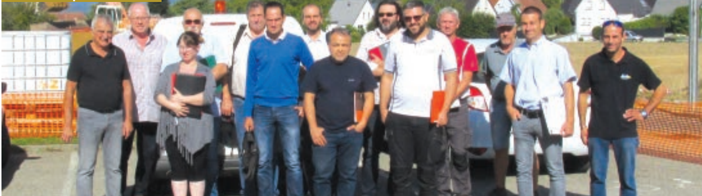
DEUXIÈME RÉUNION DE CHANTIER, EN PRÉSENCE DES ARCHITECTES DU CABINET ÉMERGENCE ET DE TOUTES LES ENTREPRISES IMPLIQUÉES PAR CE PROJET.