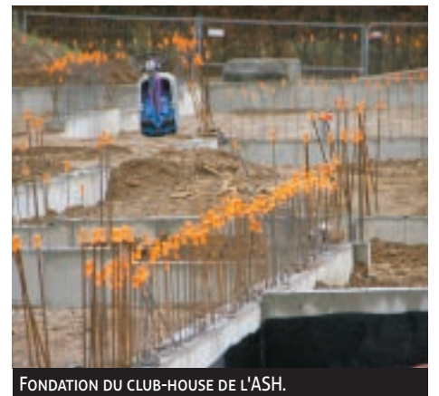
FONDATION DU CLUB-HOUSE DE L'ASH.