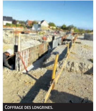
COFFRAGE DES LONGRINES.