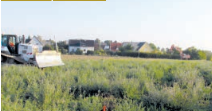
DÉMARRAGE DES TRAVAUX.