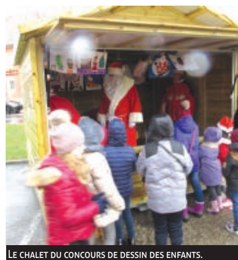
LE CHALET DU CONCOURS DE DESSIN DES ENFANTS.

COMME chaque année, et ce malgré le mauvais temps, beaucoup de visiteurs sont passés nous voir lors de notre traditionnel marché de Noël. Ils en ont profité pour se retrouver autour d'un bon vin chaud ou d'une bonne tarte flambée et partager un moment convivial et chaleureux. La patinoire a réjoui petits et grands et éclats de rires étaient de la partie.