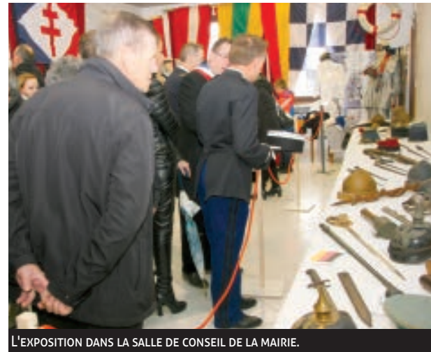
L'EXPOSITION DANS LA SALLE DE CONSEIL DE LA MAIRIE.