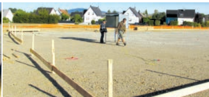
APRÈS LA MISE À NIVEAU DE LA PLATEFORME, LA SOCIÉTÉ ARMINDO A COMMENCÉ LES TRAVAUX DE CONSTRUCTION, C'EST-À-DIRE, POSITIONNEMENT DES BÂTIMENTS, FONDATIONS, ETC.