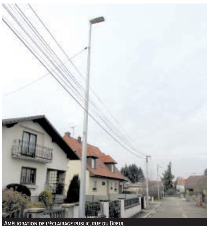
AMÉLIORATION DE L'ÉCLAIRAGE PUBLIC, RUE DU BREUL.