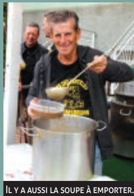
IL Y A AUSSI LA SOUPE À EMPORTER.