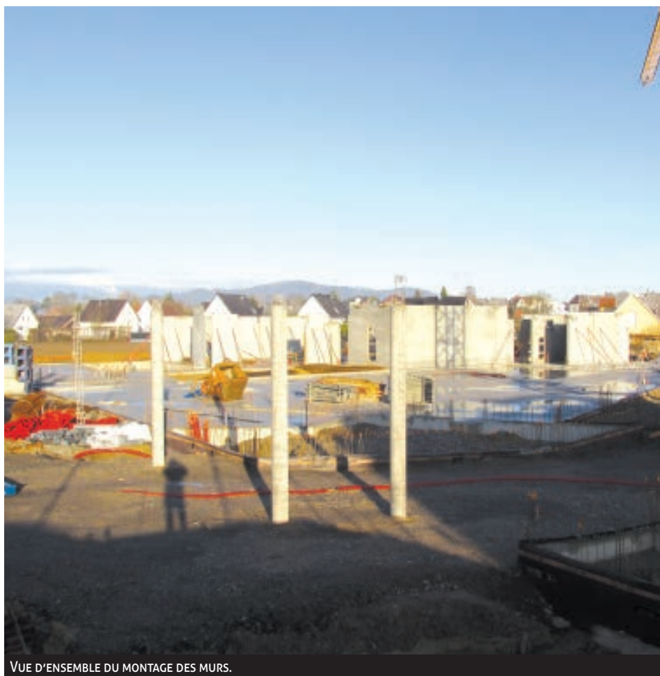
VUE D'ENSEMBLE DU MONTAGE DES MURS.