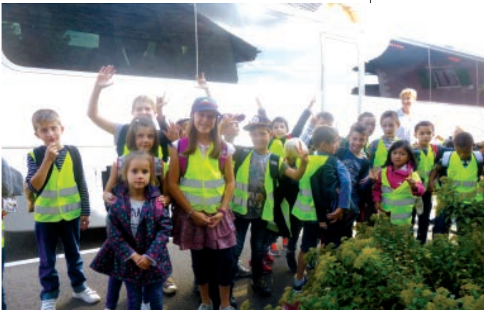
LE RETOUR DES ÉLÈVES VERS HEIMSBRUNN.

Après le mot d'accueil formulé par les deux maires aux enseignants et aux familles de Galfingue et Heimsbrunn, le bus a repris la route en sens inverse avec les élus des deux communes et les enfants de Galfingue venant à Heimsbrunn (où les cours démarrent à 8 h 15) tous équipés d'un gilet de sécurité fourni par les communes.