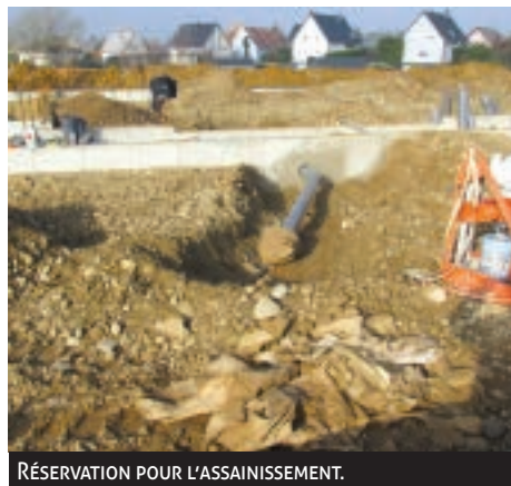
RÉSERVATION POUR L'ASSAINISSEMENT.