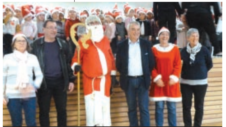
LE PÈRE NOËL ENTOURÉ DES MAIRES ET DES ADJOINTES.