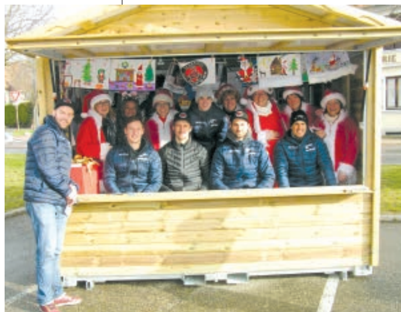
L'ÉQUIPE DES SCORPIONS TEAM SYNERGLACE DE MULHOUSE.