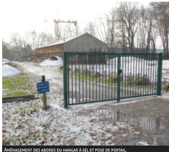
AMÉNAGEMENT DES ABORDS DU HANGAR À SEL ET POSE DE PORTAIL.