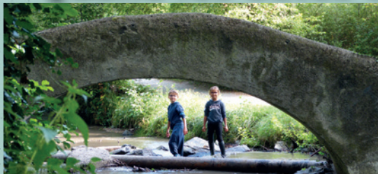
■ Nettoyage de l'Auzon : mise en place en 1996 par les services municipaux, et soutien de la population depuis 2004