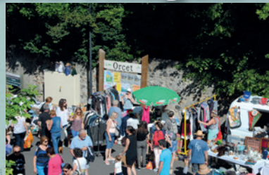
■ Vide-greniers : initié en 1990 tous les jeudis de l'Ascension