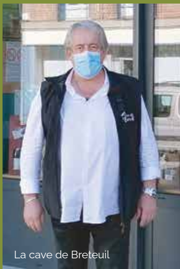
La cave de Breteuil