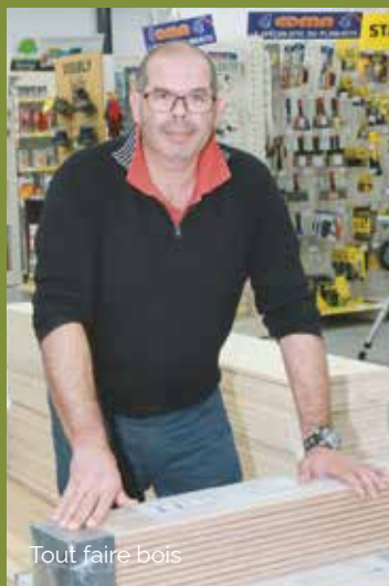
Tout faire bois