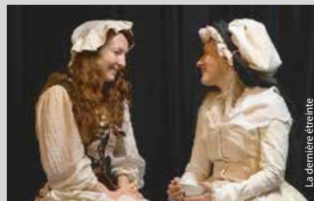
La dernière étreinte