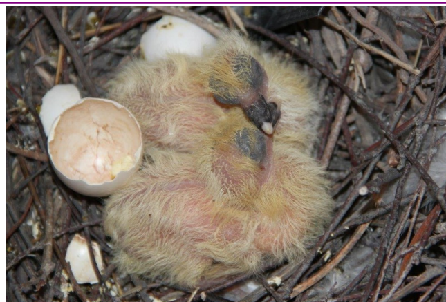
C'est le printemps et les nids se peuplent dans le silo.

* SIAEP : Syndicat Intercommunal d'adduction d'eau potable