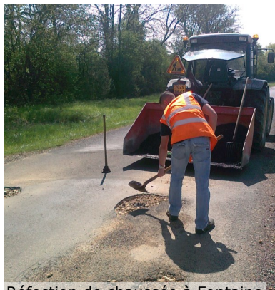
Réfection de chaussée à Fontaine

Un petit aperçu des réalisations depuis nos rencontres