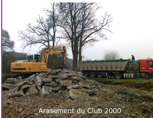
Arasement du Club 2000