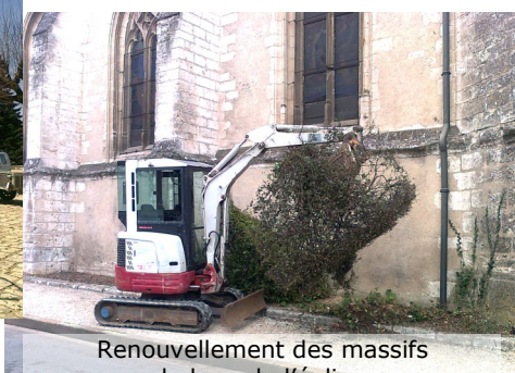
Renouvellement des massifs le long de l'église