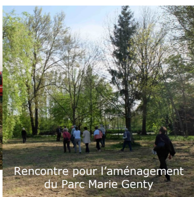
Rencontre pour l'aménagement du Parc Marie Genty