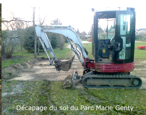
Décapage du sol du Parc Marie Genty