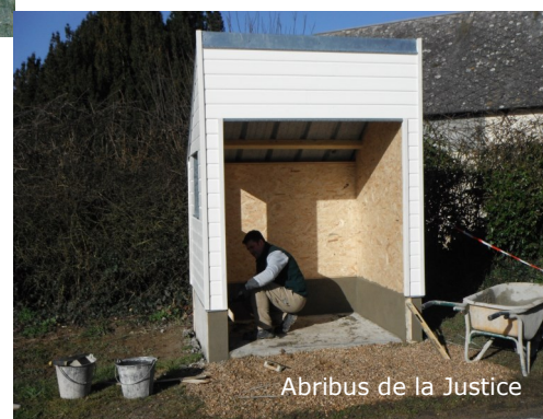
Abribus de la Justice

Avec les remerciements pour les artisans de la commune qui ont participé à ce projet.