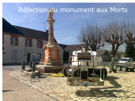
Réfection du monument aux Morts