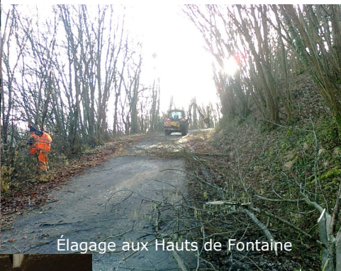
Élagage aux Hauts de Fontaine