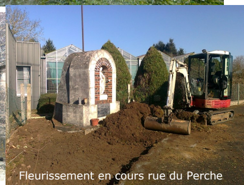
Fleurissement en cours rue du Perche