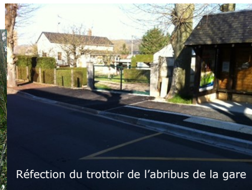
Réfection du trottoir de l'abribus de la gare