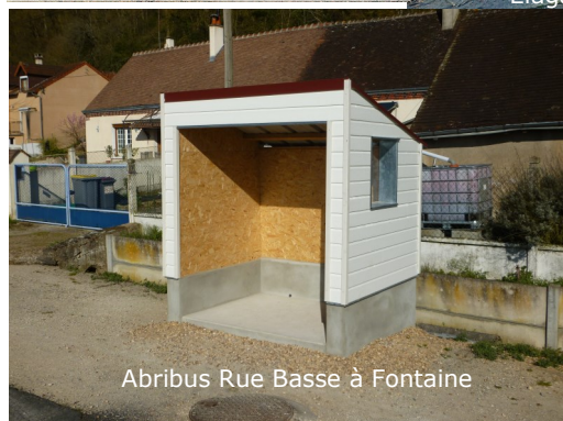
Abribus Rue Basse à Fontaine

Avec les remerciements pour les artisans de la commune qui ont participé à ce projet.