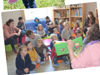
Puis lecture d'un conte dans la bibliothèque.