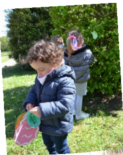
Cueillette des œufs dans le parc Marie Genty,

Le 27 avril dernier se déroulait la 7 ème chasse aux œufs, co-organisée par l'association le Rendez-vous des Doudous et les bénévoles de la bibliothèque