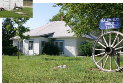
Maison Martin Monhart (USA) - 1925 2- Technique

La technique Nebraska est très adaptée aux régions peu boisées, pour des petits bâtiments d'architecture simple. Les bottes de pailles sont empilées, reliées entre elles et pré-compressées au moyen de sangles afin de recevoir et porter une toiture. Elle nécessite peu de moyens techniques et se range dans les techniques les plus alternatives et séduisantes. En effet, la paille joue 3 rôles : structure, isolation et support d'enduit, ce qui la rend difficilement diffusable, reproductible et réglementaire.