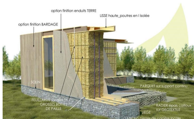
Technique Nebraska (petites bottes)

La technique Nebraska est très adaptée aux régions peu boisées, pour des petits bâtiments d'architecture simple. Les bottes de pailles sont empilées, reliées entre elles et pré-compressées au moyen de sangles afin de recevoir et porter une toiture. Elle nécessite peu de moyens techniques et se range dans les techniques les plus alternatives et séduisantes. En effet, la paille joue 3 rôles : structure, isolation et support d'enduit, ce qui la rend difficilement diffusable, reproductible et réglementaire.