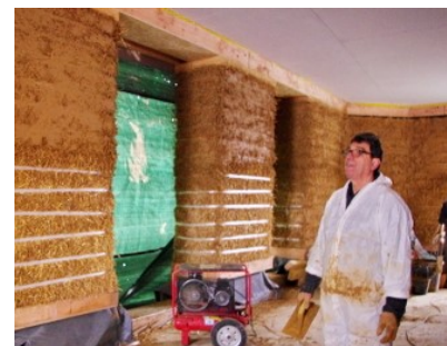
Une école en paille porteuse est actuellement en construction à Rosny-Sous-Bois (93)