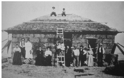
Pilgrim Holiness Church – Arthur (USA) - 1928

Initialement utilisés pour construire des abris, les ballots sont par la suite enduits pour construire des maisons. Entre 1896 et 1945, environ 70 bâtiments en paille porteuse, y compris des maisons, des bâtiments agricoles, des églises, des écoles, des bureaux et des épiceries ont été construits dans les Sand-hills. Les plus anciens bâtiments encore visibles datent du début du 20ème siècle et nous prouvent la durabilité de ce mode constructif.