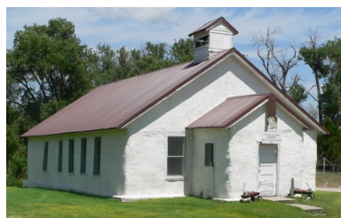
Simonton House Purdum -1908