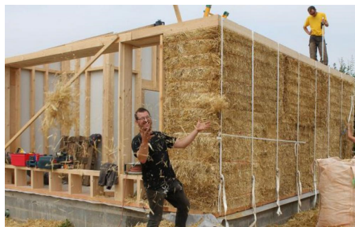
Maison en paille porteuse (grosses bottes) à Saint-Nom-la-Bretèche (78)

L'apparition des grosses bottes de paille fait renaître l'intérêt pour cette technique, en particulier dans le cadre de bâtiments agricoles ou de stockage. Quelques constructions ont été réalisées par cette méthode, mais l'épaisseur de ses murs (jusqu'à 80cm) présente d'autres contraintes, comme l'emprise au sol ou la complexité de réaliser des ouvertures.