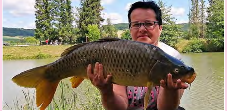
Nuit de la carpe