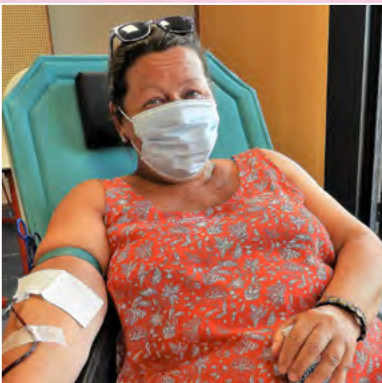
Don du sang