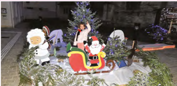
Décorations de Noël