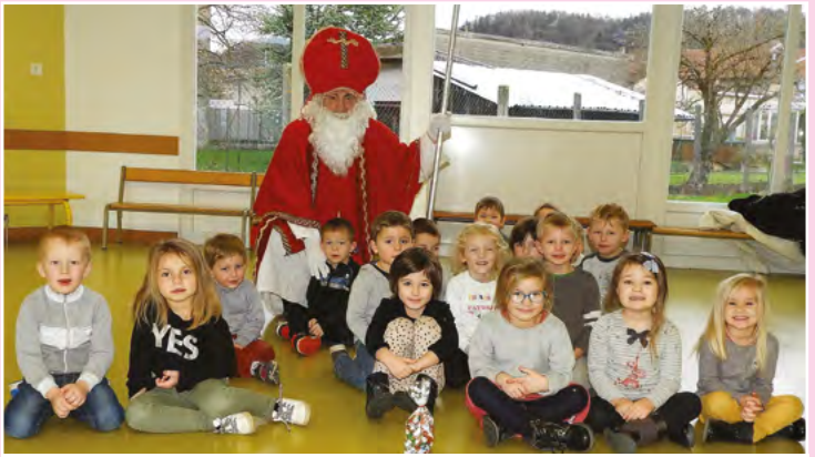
Saint-Nicolas à l'école François-Laux