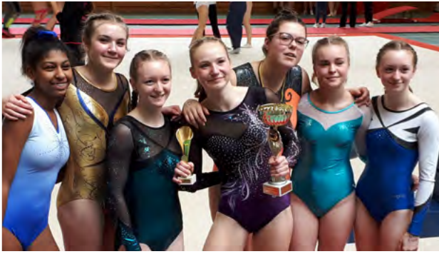
Cécillette médaille d'or coupe Lorraine