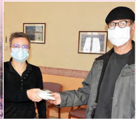
Distribution de masques