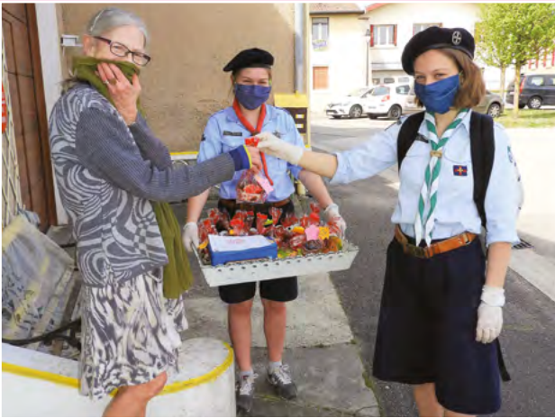
Confinement BA guides d'Europe