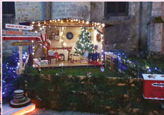
Illuminations de Noël