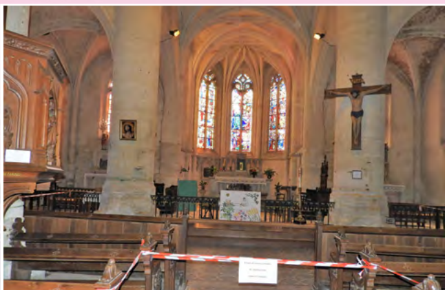
Fermeture église Saint-Hilaire