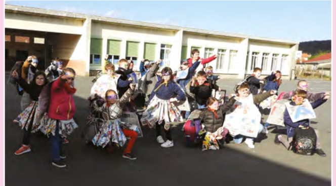
Carnaval de l'école