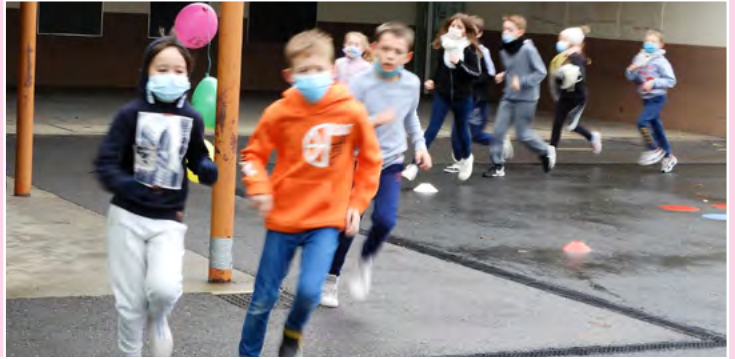
Téléthon de l'école