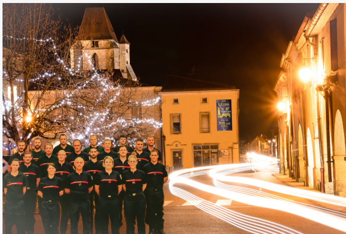
« La veillée des Anges »

"Une photo qui évoque 2020 pour ses confinements, le manque d'air sous nos masques et le fait que nous marchons tout de même un peu sur la tête depuis quelques mois !"