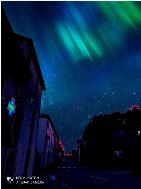
« Bastide et Aurore Boréale »