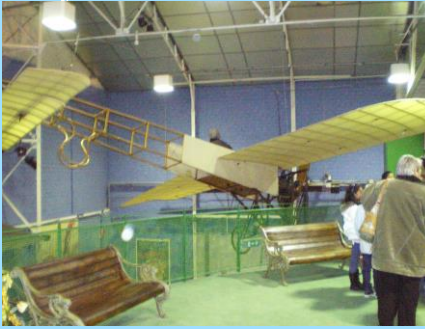
Visite du Musée SAFRAN