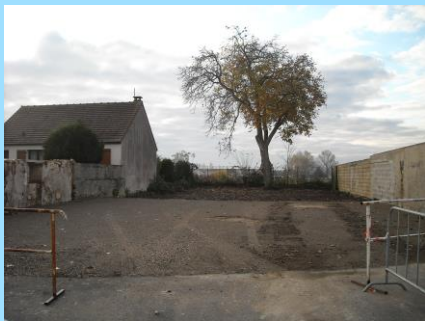
Création d'un nouveau parking