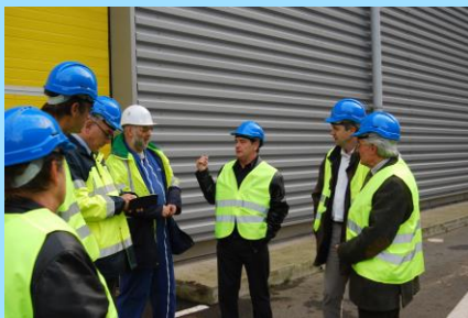
Visite d'une usine de compostage