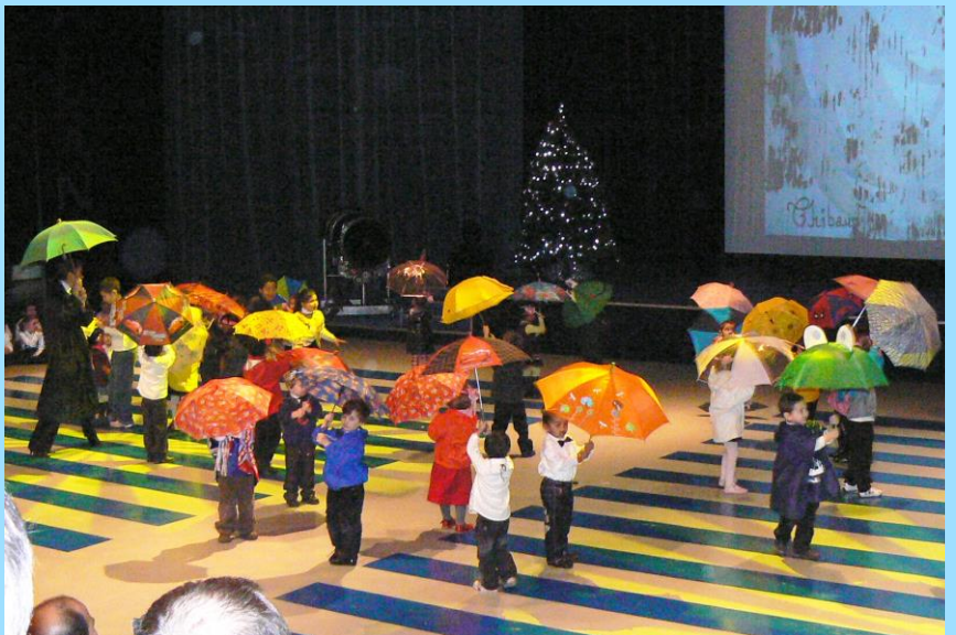
Spectacle de Noël