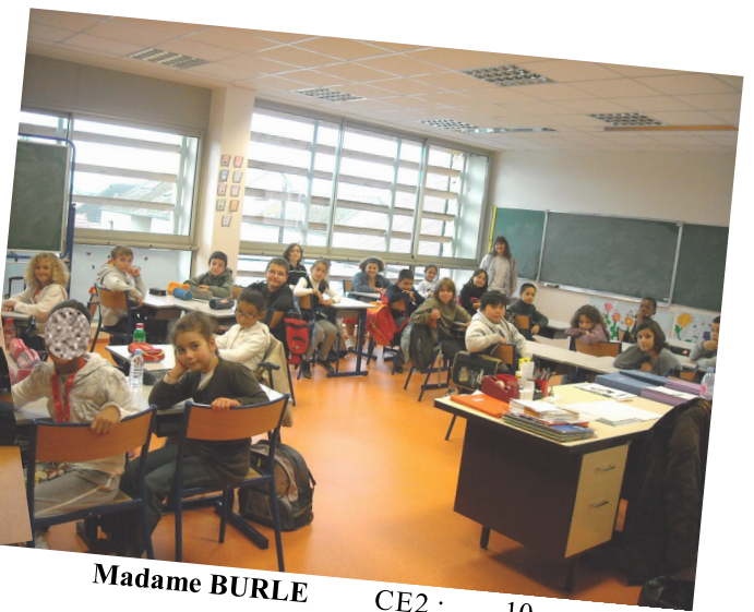
Madame BURLE CE2 : 10 CM1 : 14