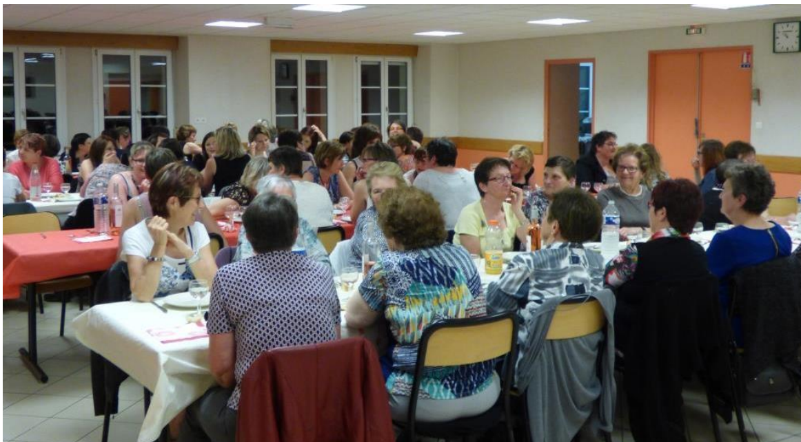
Repas de la fête des mères, mai 2016