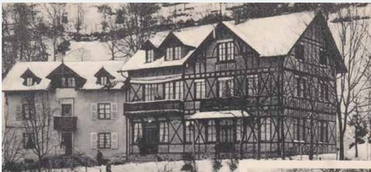
L'ancien Hôtel Beau Séjour à l'emplacement de l'actuel Centre La Roche.