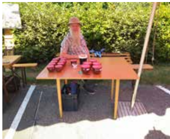
Les exposants à l'oeuvre.