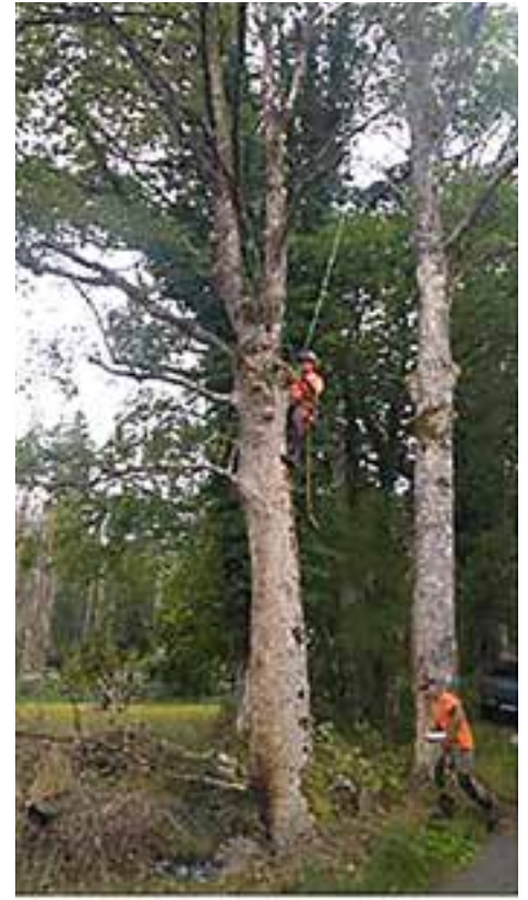
L'abattage d'un arbre Chemin Saegmatt.