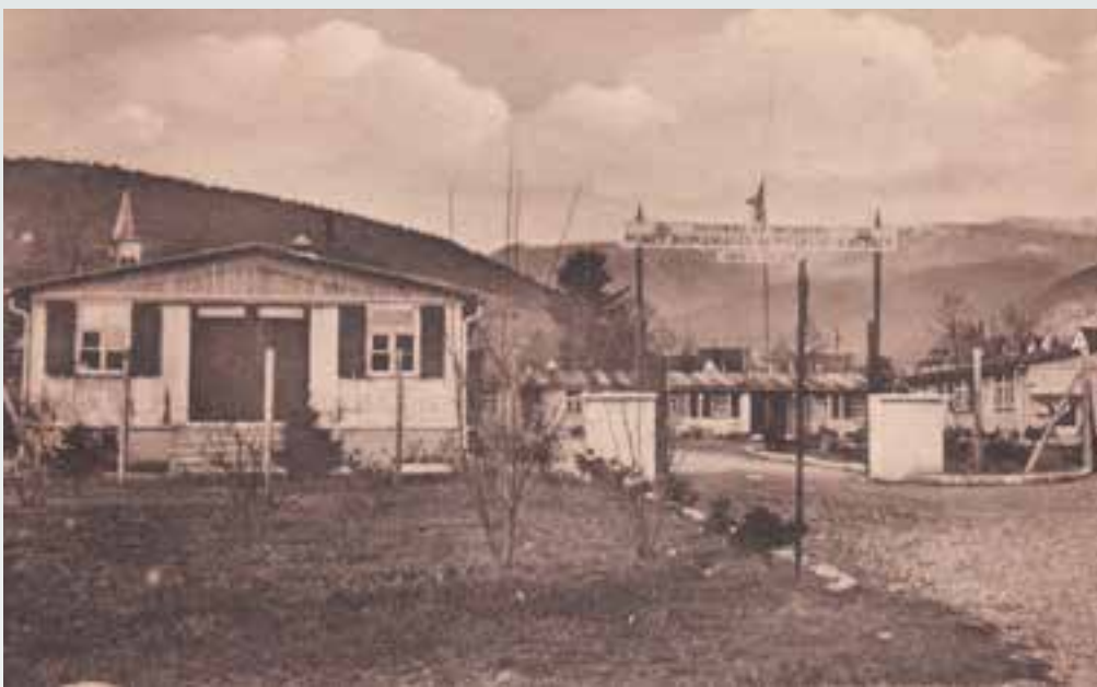
Quand la salle des fêtes était une colonie de vacances des Mines Domaniales des Potasses d'Alsace avant de devenir un camp de prisonnier pendant la guerre.