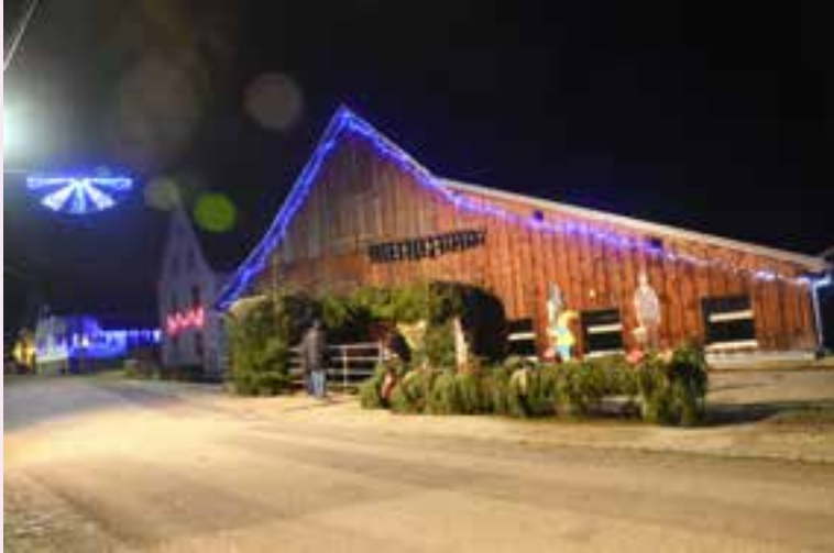
La ferme Schubnel.