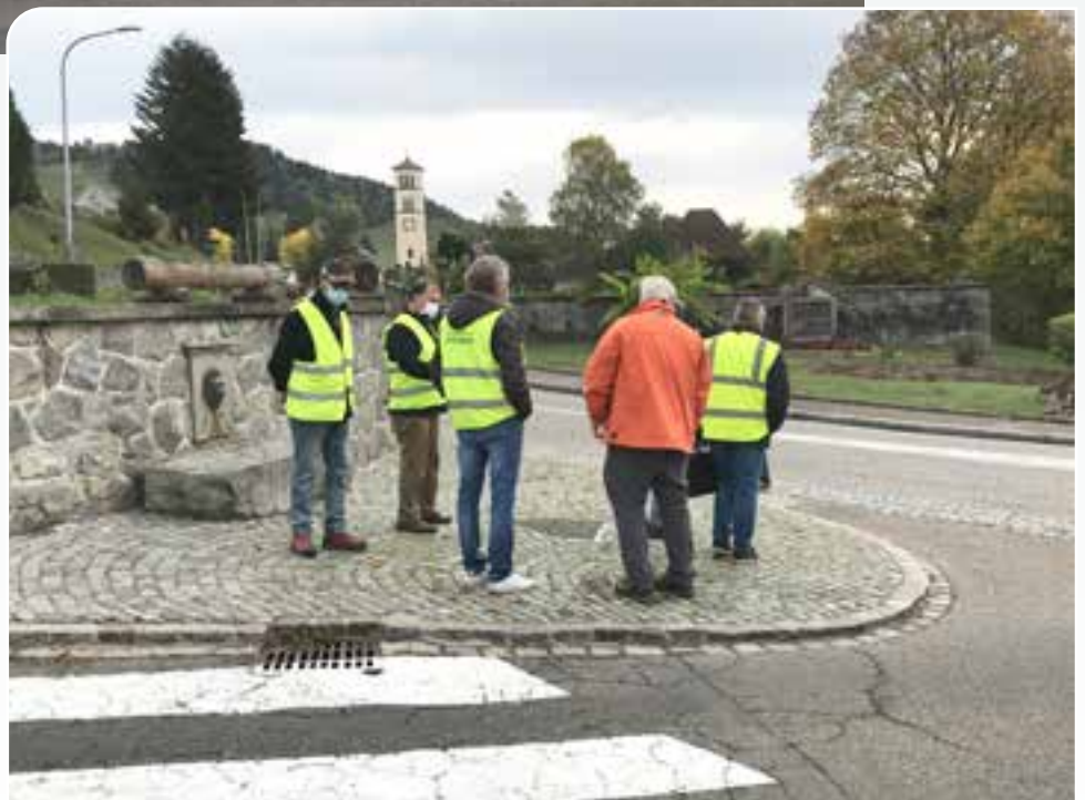
Réunion avec le Service des Routes du Département dans le cadre d'une étude de la sécurisation du croisement.