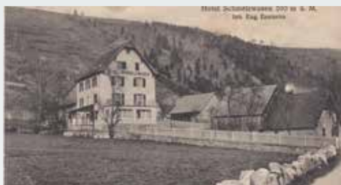
L'ancien Hôtel Schmelzwesen.