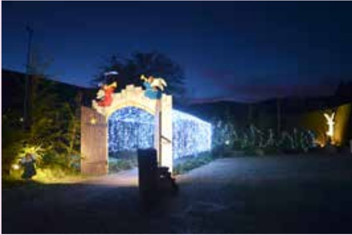
L'entrée du Sentier de Noël du Silberwald.