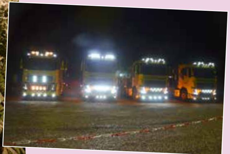
Insolite : des camions qui se prennent au jeu des illuminations.