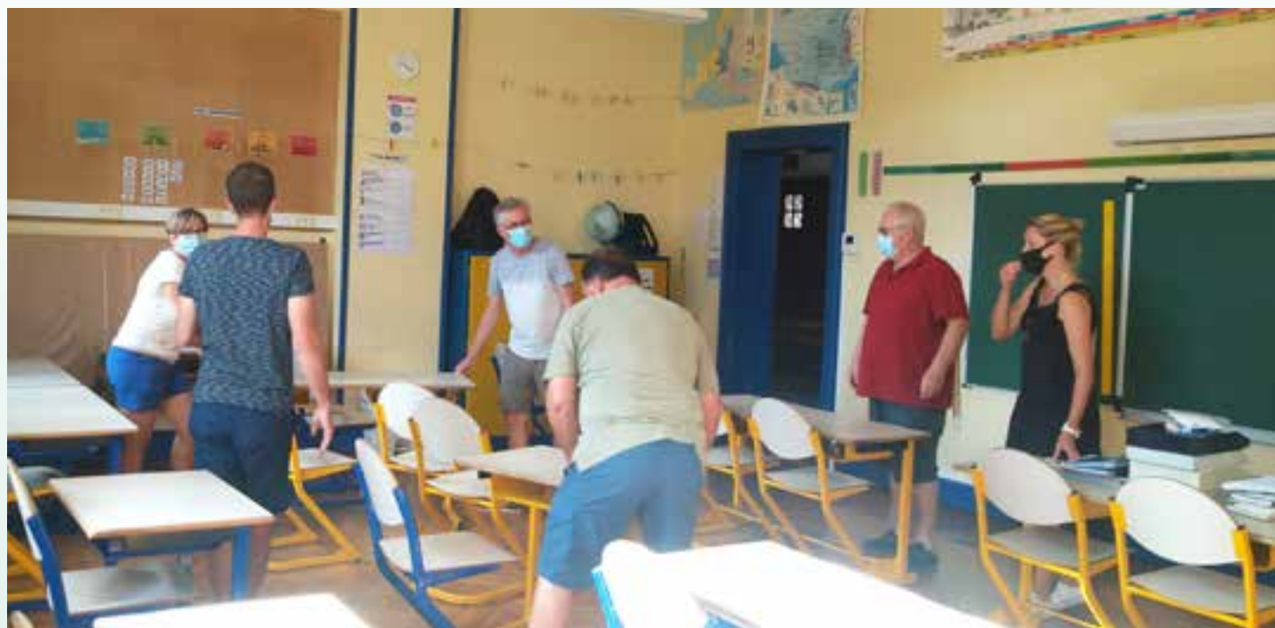
Les élus se sont mobilisés avec l'équipe enseignante pour préparer les salles de classe pour la rentrée.