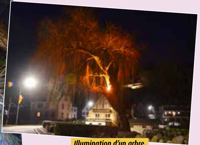
Illumination d'un arbre.