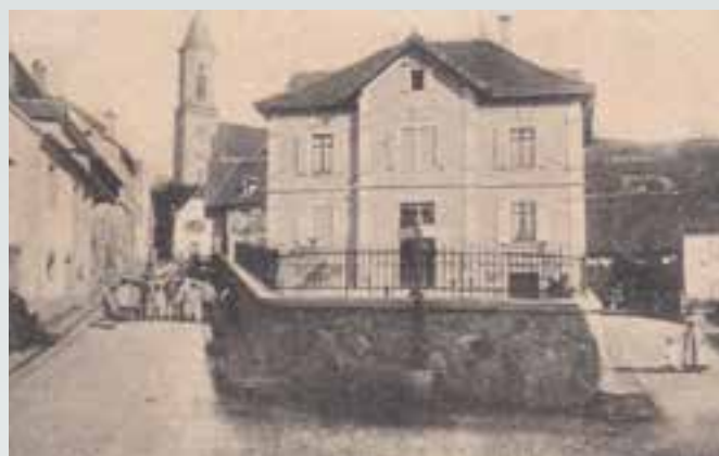
Le presbytère protestant à l'emplacement de la mairie.