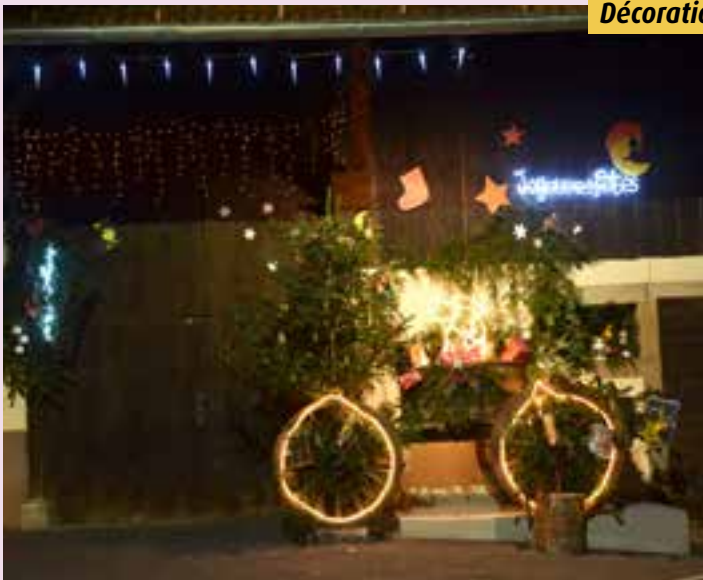
Décorations chez des habitants.