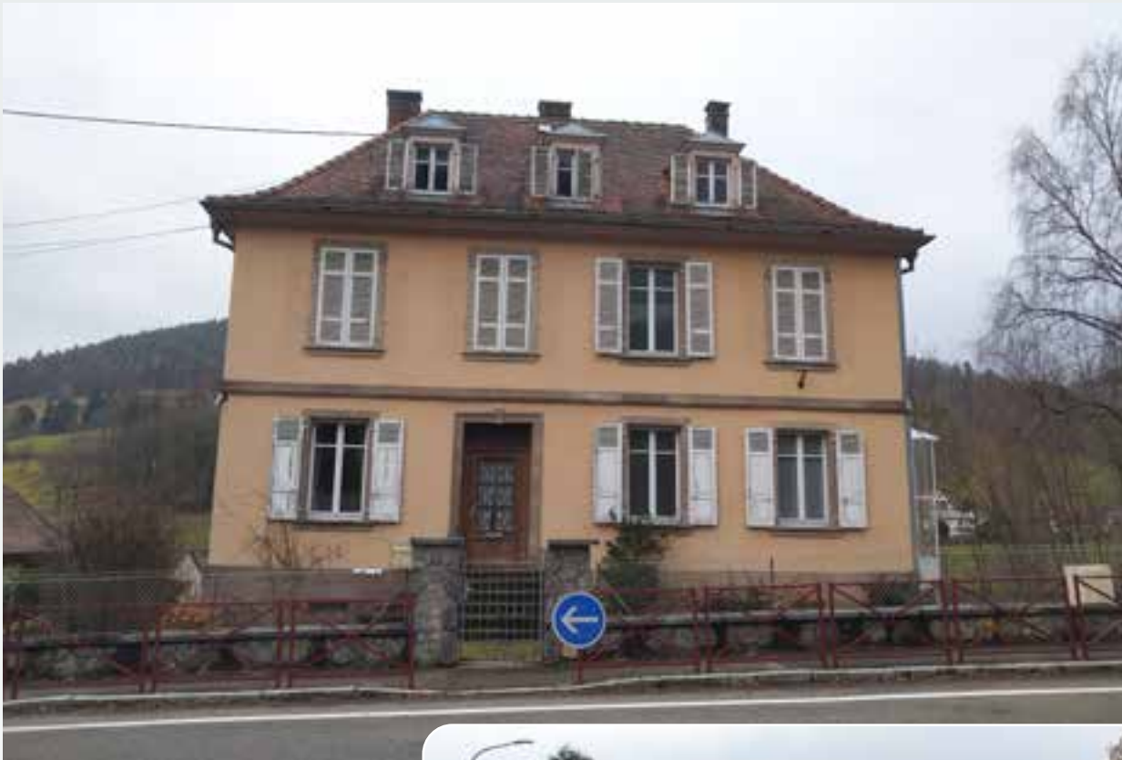
Le presbytère protestant.