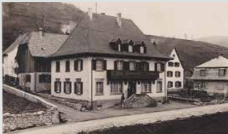
L'ancien Hôtel Saegmatt.