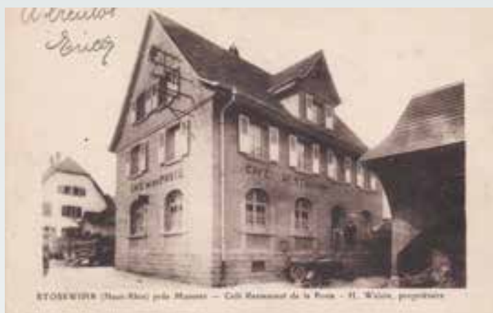
Le Restaurant « A l'Ancienne Poste ».