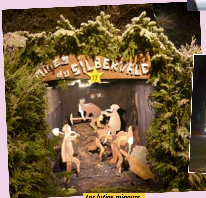
Les lutins mineurs.