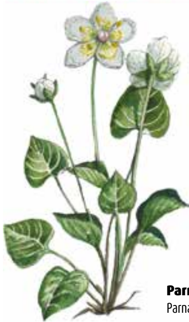
Parnassie des marais Parnassia palustris - Linné, 1753

La réputation de la flore du Frankenthal n'est plus à faire. Pour retracer les pérégrinations des botanistes qui ont arpenté les couloirs du Hohneck depuis près de 200 ans, le gestionnaire de la Réserve naturelle présente dans une exposition quelques espèces qui font la réputation de la Réserve naturelle.