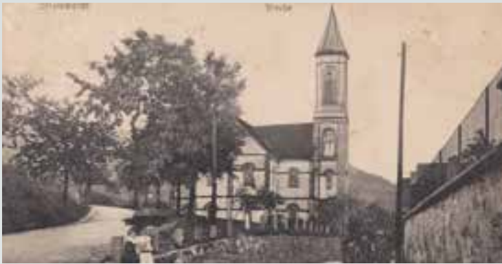
Le mur du cimetière était bien plus haut avant...