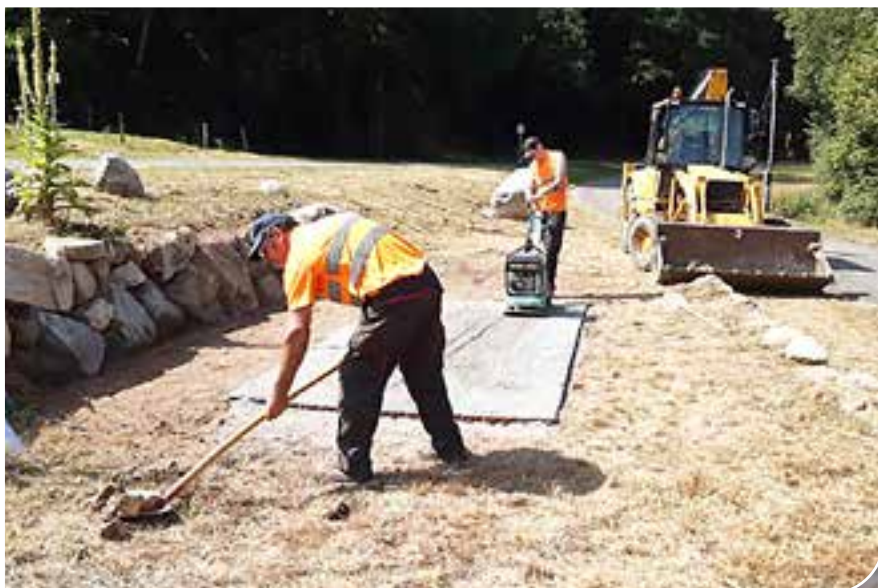
Réaménagement paysagé au croisement de la Rue du Hohneck et du Chemin du Saegmatt.