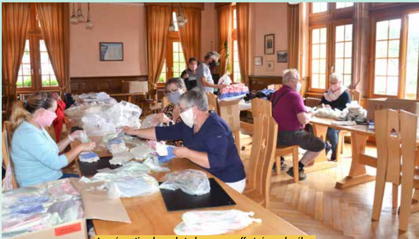
La préparation des sachets de masques effectuée par les élus.