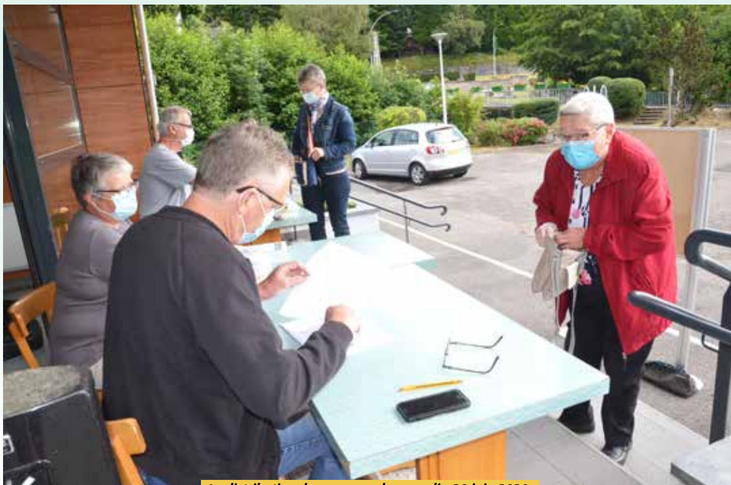
La distribution des masques le samedi - 20 juin 2020.