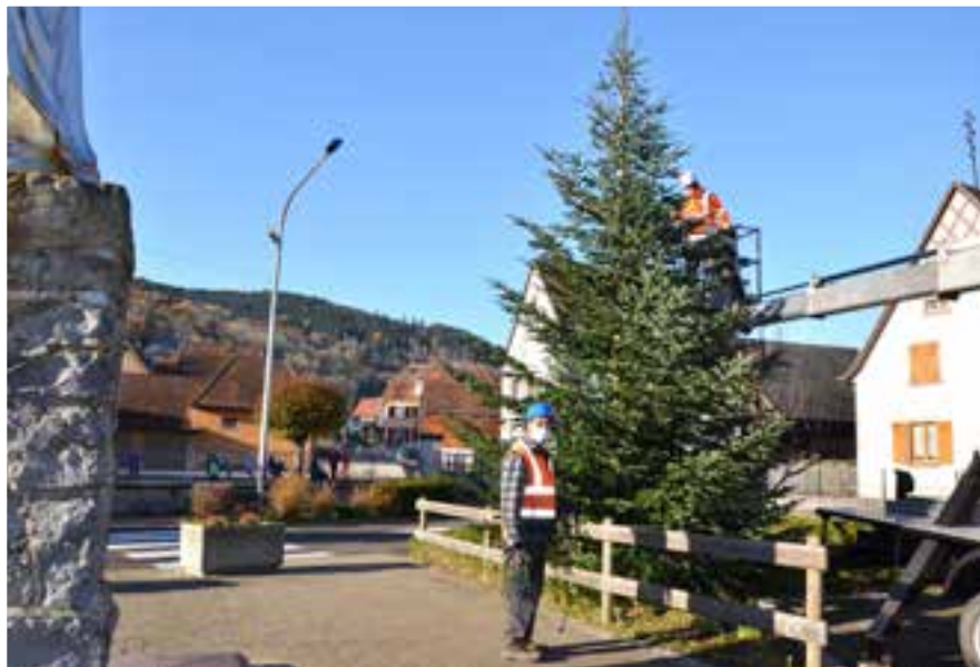
Mise en place par les agents techniques des décorations de Noël

Suite à la détection d'une fuite d'eau importante sur le réseau d'eau chemin du Looch, des travaux de réparation ont été menés en urgence par l'entreprise A. BAUMGART de Muhlbach/Munster.