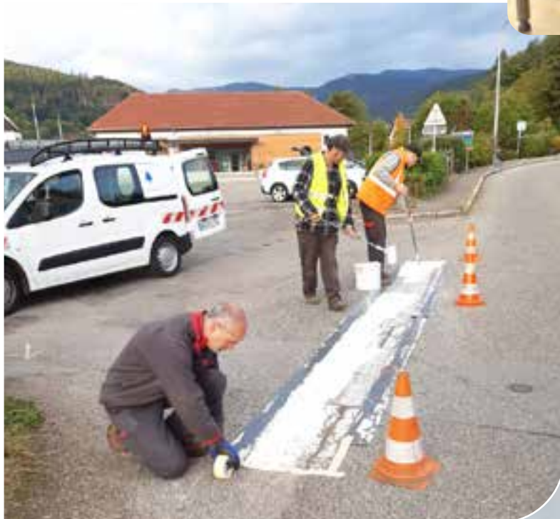
Les ouvriers communaux ont procédé au rafraîchissement des marquages au sol de tout le village.