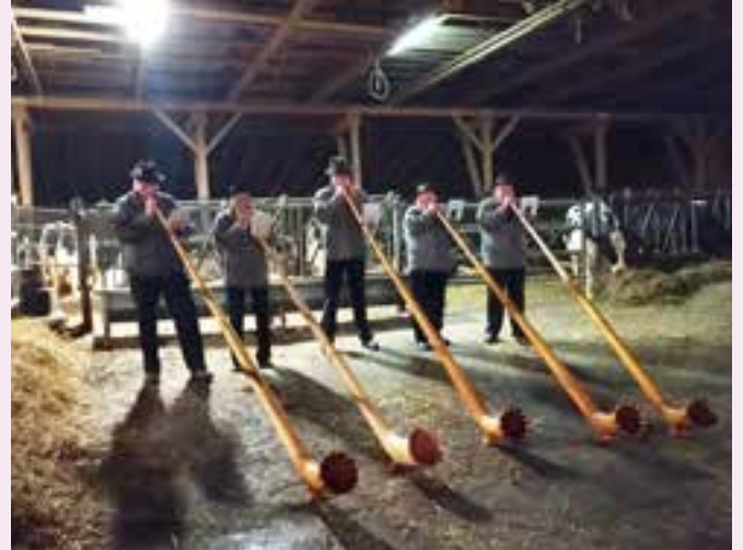
Les cors des Alpes.