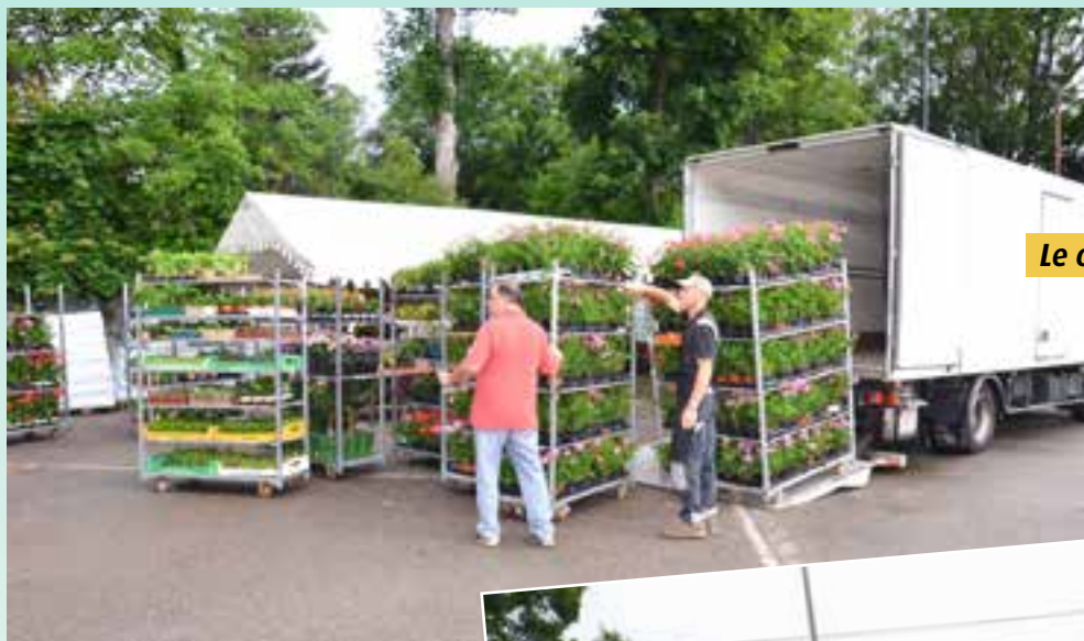
Le déchargement des fleurs.

Le 23 mai 2020 s'est tenu le marché aux fleurs qui a connu un franc succès tout en respectant les conditions sanitaires. Les commandes ont été multipliées par 2 par rapport à 2019 (128 commandes contre 63 l'année passée).