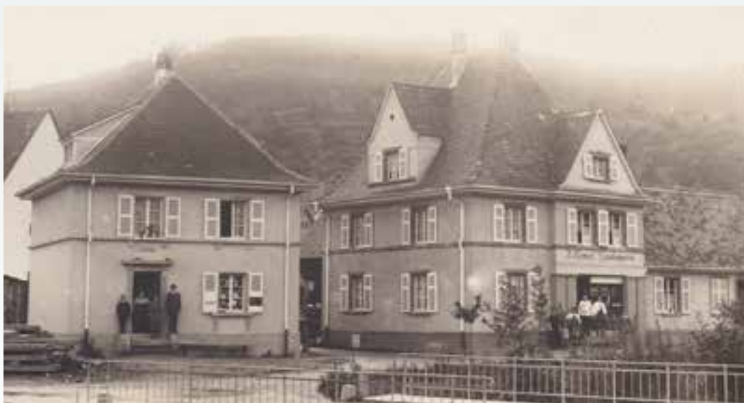
L'ancienne boulangerie de Mme Kempf.

Un grand merci à Laurent SCHAFFHAUSER pour la mise à disposition de ces photos et cartes postales.