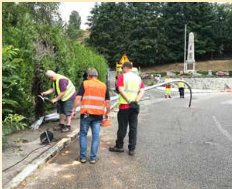
Enlèvement du poteau abîmé suite à un accident de voiture sur la RD417.

Une personne a mis le feu aux poubelles sur le pont près de l'étang de pêche ce qui a occasionné des dégâts au pont. La facture non prise en charge par les assurances s'élève à plus de 10 000 €.