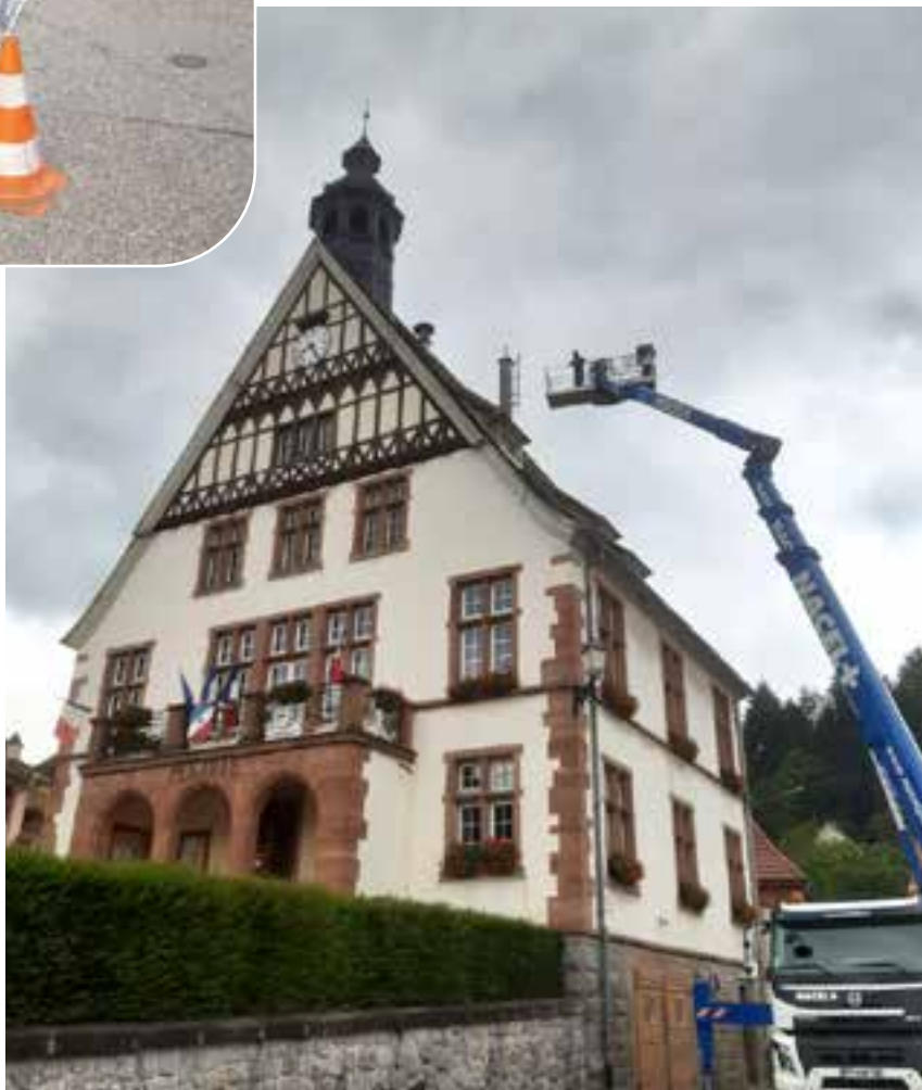
Travaux de réfection de la toiture de la mairie et à l'église protestante suite à un coup de tempête.