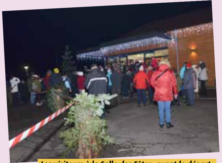
Les visiteurs à la Salle des Fêtes, avant le départ.