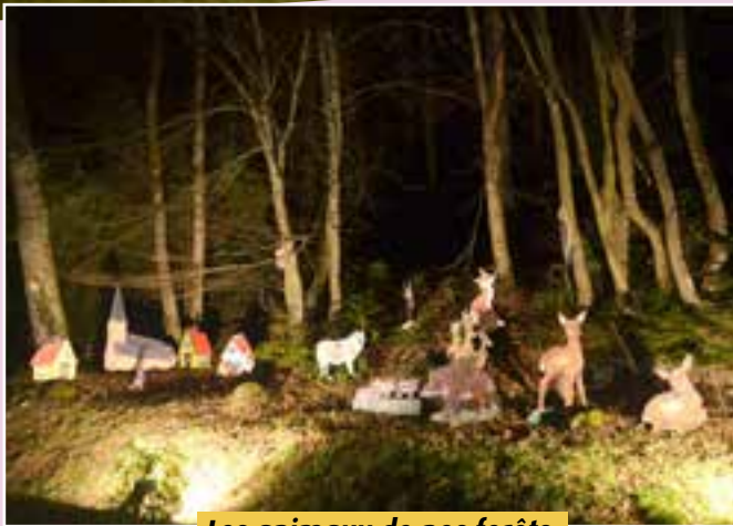
Les animaux de nos forêts.