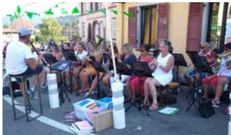
Un grand merci à l'Harmonie de la Petite Vallée qui a égayé ce moment convivial.