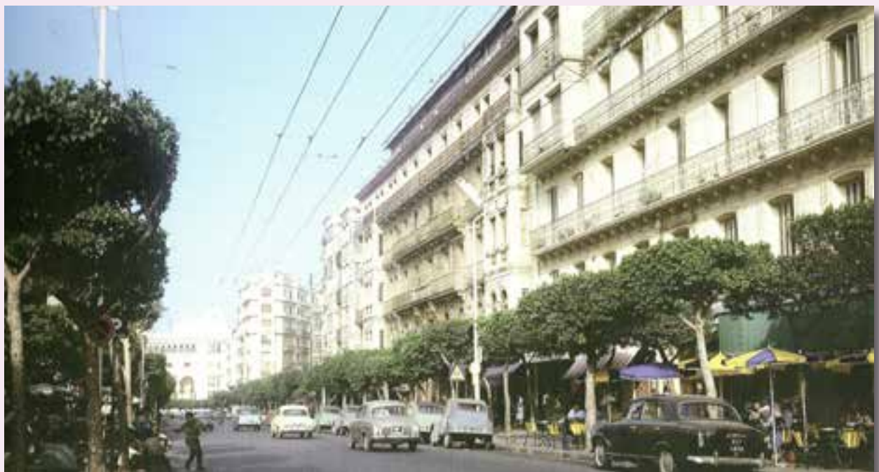
La rue Michelet à Alger, une rue emblématique d'Alger