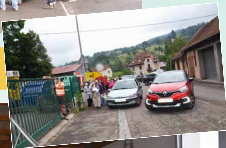
Le retrait des commandes.

A l'heure de pointe le flot des véhicules était impressionnant dans la rue G.Motte.