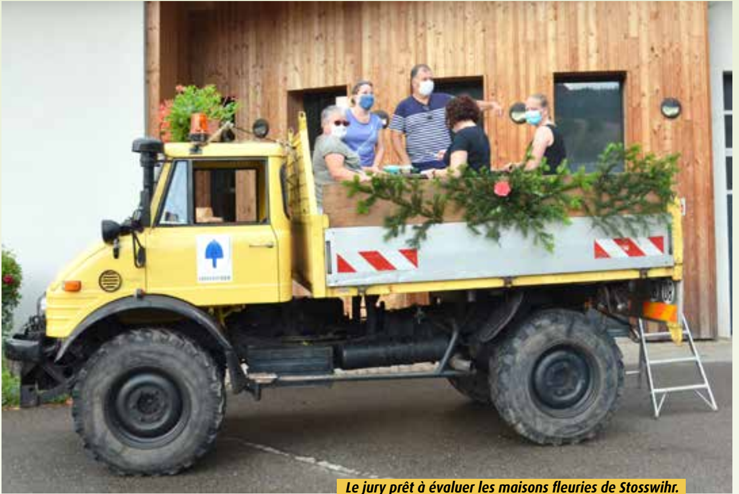
Le jury prêt à évaluer les maisons fleuries de Stosswihr.