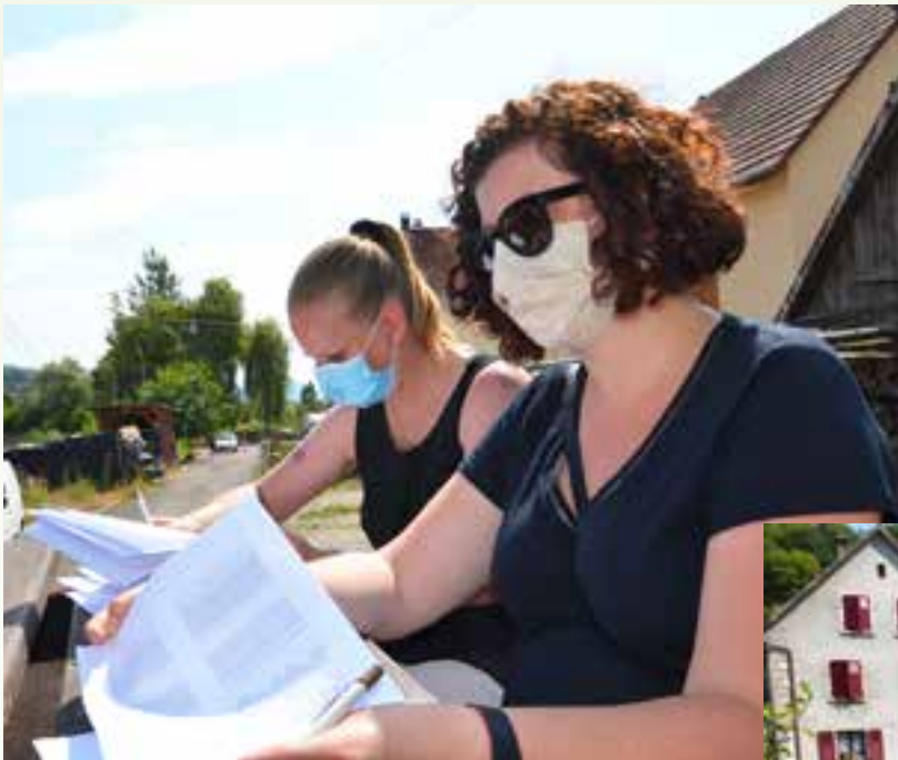
Un jury très studieux.