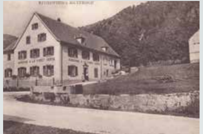
L'ancienne auberge du Marcaire.