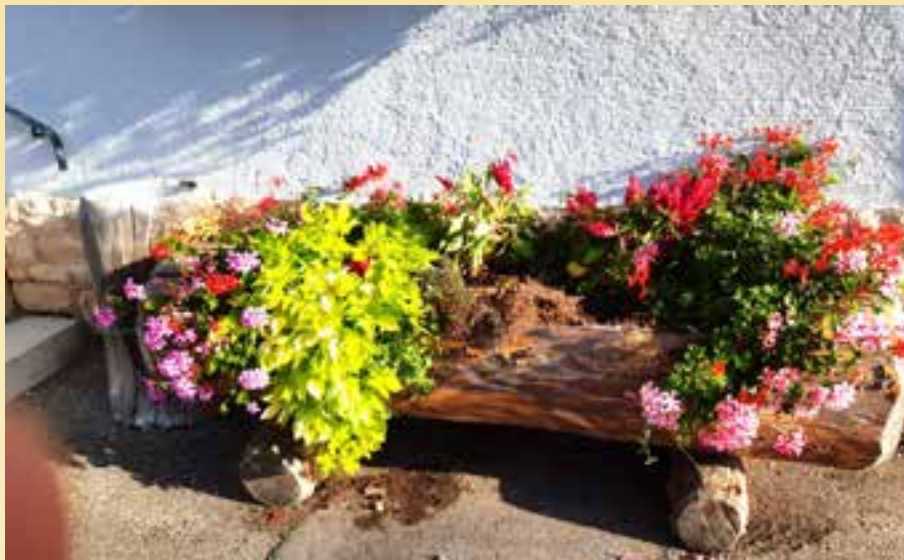
Les fleurs plantées à la salle des Fêtes ont fait l'objet de vandalisme.

Depuis de nombreuses années, la commune fait un effort pour embellir le village et malheureusement des personnes mal intentionnées n'hésitent pas à saccager le travail réalisé par l'équipe technique sans tenir compte du coût et du travail supplémentaires que cela engendre.