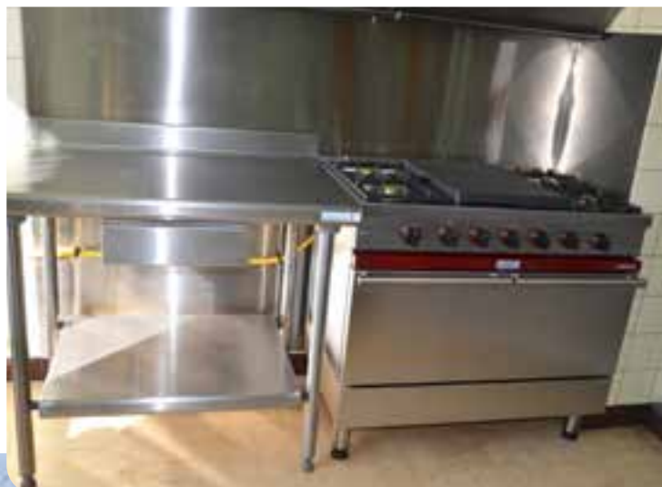
Acquisition d'un nouvel ensemble four / plaque de cuisson pour la cuisine de la Salle des Fêtes.