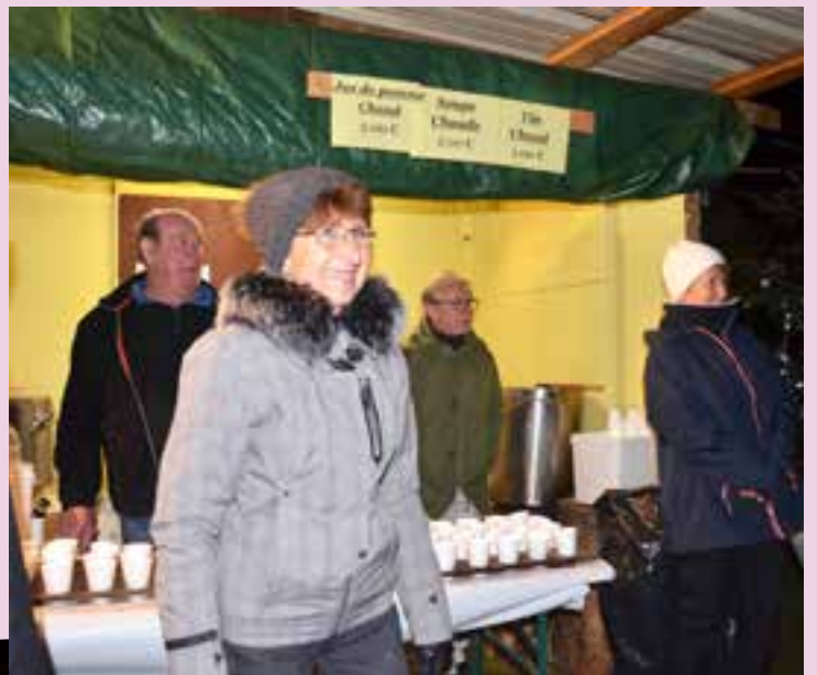
Les bénévoles prêts à servir le vin chaud et avec le sourire.