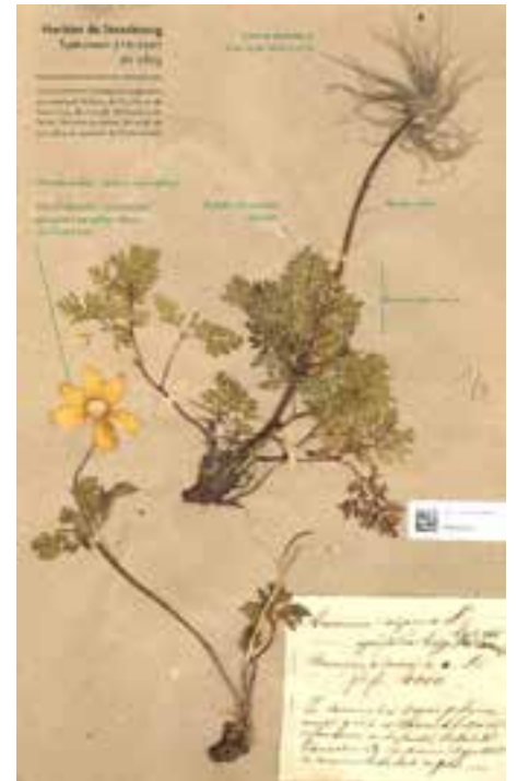
Pulsatille blanche Anémone scherfelii - Ullep, 1887

Pour cette exposition, l'Herbier de l'Université de Strasbourg a été consulté pour retrouver des plantes historiquement récoltées sur la Réserve naturelle. Ces planches d'herbiers constituent le plus souvent des références pour ces espèces.