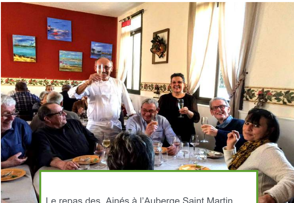
Le repas des Aînés à l'Auberge Saint Martin.