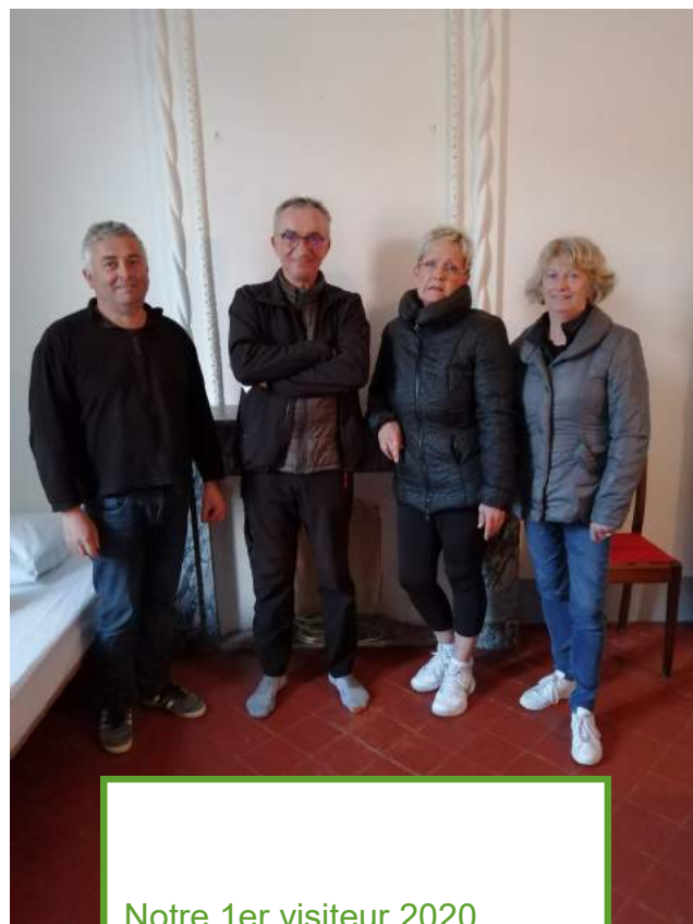
Notre 1er visiteur 2020