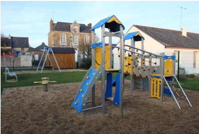
L'AIRE DE JEUX ENFANTS