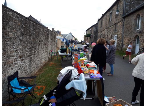
LA BRADERIE DU COMITÉ DES FÊTES