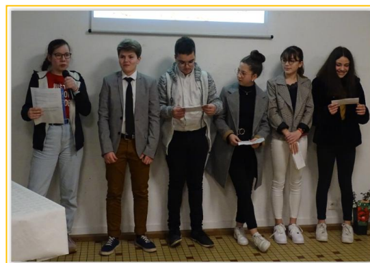
Les élus du CMJ

Le CMJ entame sa troisième et dernière année du mandat en cours prévu sur la période 2018-2020.