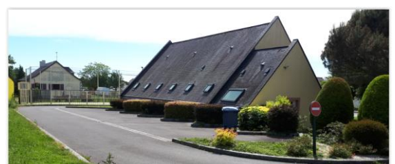
FENÊTRES DE TOIT ET VMC