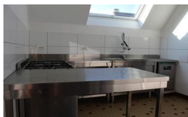
RÉNOVATION : LA CUISINE ET LES WC