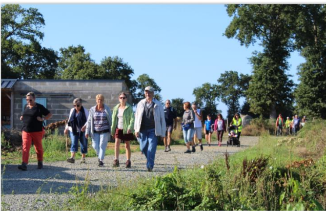
LA RANDONNÉE MUNICIPALE