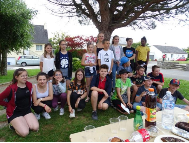
CMJ : LA CHASSE AU TRÉSOR