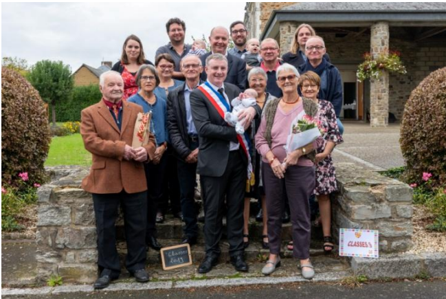
LA FÊTE DES CLASSES 9