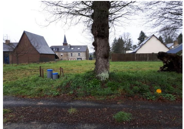
LA VIABILISATION DE LA PARCELLE A484