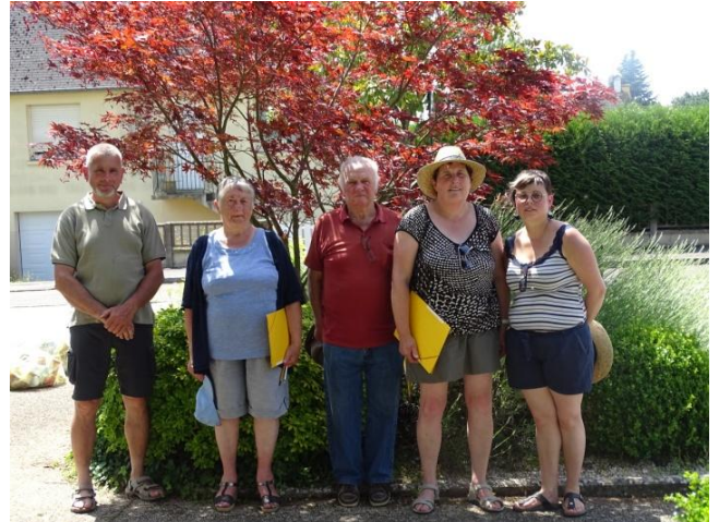
LE JURY DU CONCOURS DES MAISONS FLEURIES