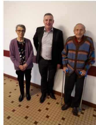
CCAS : LE REPAS DES AÎNÉS