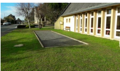
PEINTURES DES HUISSEES EXTERNES