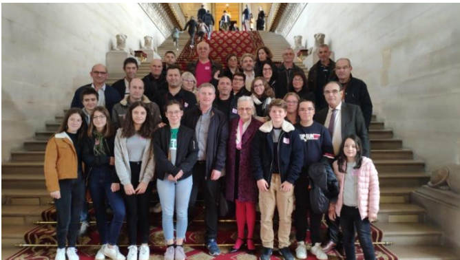
LES AUBINOIS EN VISITE AU SÉNAT