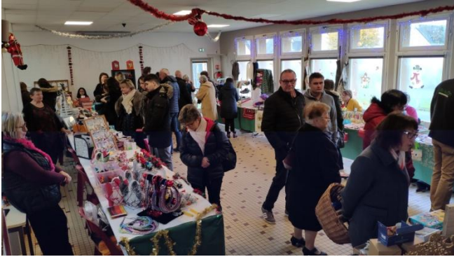
LE MARCHÉ DE NOËL DU COMITÉ DES FÊTES