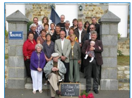
Les conscrits de 2009

Pour toute question en lien avec cette réunion, contacter Dominique Champalaune en mairie.