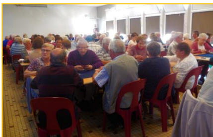
Le concours de belote organisé le 28 septembre