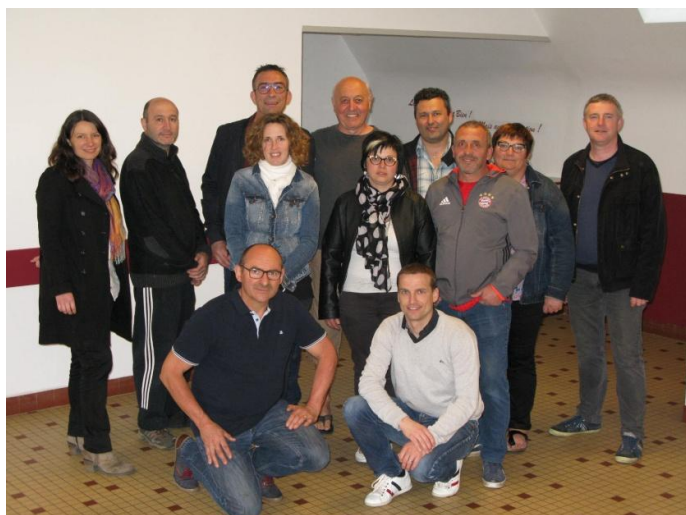
L'équipe des bénévoles

(absents sur la photo : Frédéric Bouillon et Pascal Le Roux)