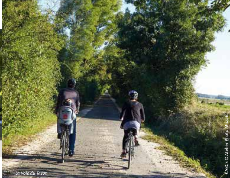
La Voie du Tacot