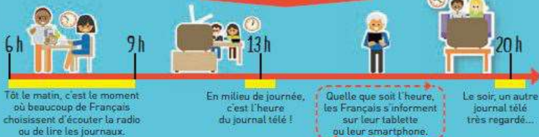
Illustration : Alexandre V. Petitfils