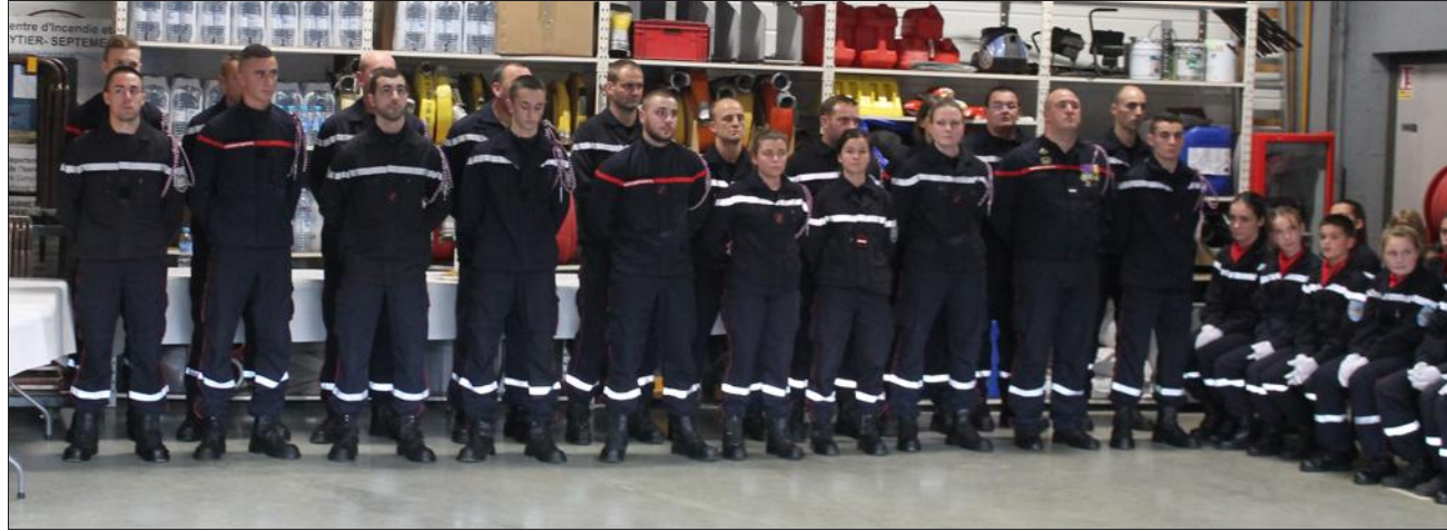
Les pompiers et jeunes sapeurs-pompiers ont été mis à l'honneur samedi.