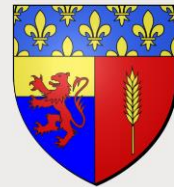
LA FORÊT-LE-ROI (91410)