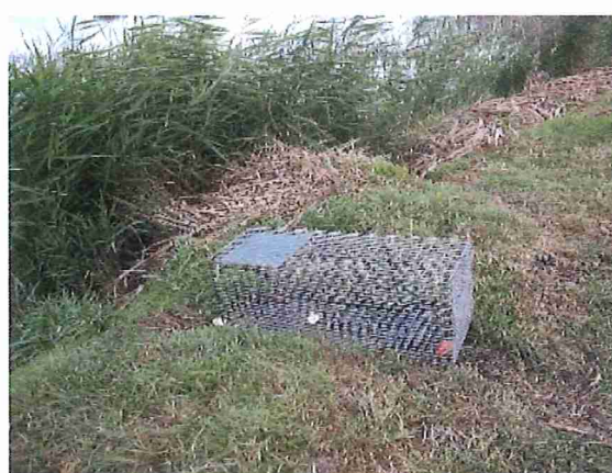
Cage-piège sélective

☛ La lutte contre les rongeurs aquatiques (ragondins et rats musqués) permet de diminuer les risques de contracter la leptospirose (20 % des ragondins et 35 % des rats musqués sont potentiellement excréteurs de cette bactérie - étude 2010).