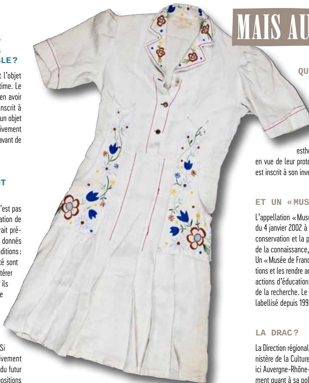
Robe de pénurie réalisée dans un drap de lin, Les Avenières (Isère), 1942 environ. Coll. Musée de la Résistance et de la Déportation – Département de l'Isère

L'ensemble des collections conservé par le musée n'est pas exposé. Au Musée de la Résistance et de la Déportation de l'Isère, ce serait près de 8 000 éléments qu'il faudrait présenter dans les espaces de longue durée. Les objets donnés seront avant tout conservés dans d'excellentes conditions : réserves dont la lumière, la température et l'humidité sont contrôlées, emballage soigné ne risquant pas de s'altérer avec le temps, haut niveau de sécurité, etc. Classés, ils seront inscrits dans l'inventaire informatique du musée et visibles sur le site https://collections.isere.fr/ . Ils pourront alors être étudiés par des chercheurs, photographiés pour être publiés dans des journaux, ouvrages, sur des affiches ou empruntés pour être exposés dans d'autres musées. Si cela s'avère pertinent, les objets pourront effectivement être présentés au sein du parcours de longue durée du futur musée ou dans le cadre d'une des nombreuses expositions temporaires.