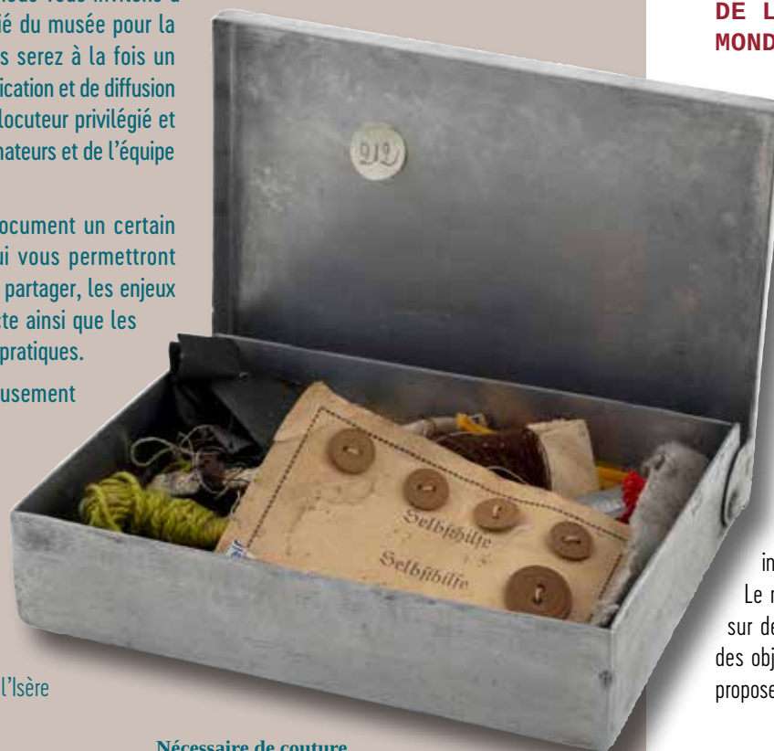
Nécessaire de couture d'un déporté, années 1940. Coll. Musée de la Résistance et de la Déportation – Département de l'Isère