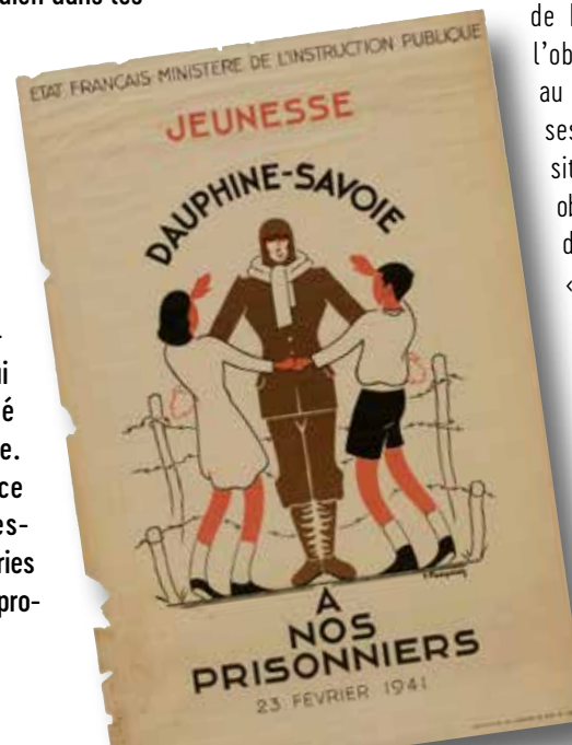
Affiche éditée par le ministère de l'Instruction publique invitant la jeunesse à penser aux prisonniers de guerre, Dauphiné – Savoie, 23 février 1943.

Le musée se charge intégralement du transport des dons acceptés et l'équipe en profitera peut-être pour poser quelques questions complémentaires au donateur. Un reçu de don lui sera alors remis attestant que l'objet a bien changé de main. Un courrier de remerciement lui parviendra alors dans les semaines suivantes. Il comportera les nouvelles références de l'objet dans la collection du musée afin qu'il puisse « prendre de ses nouvelles ».