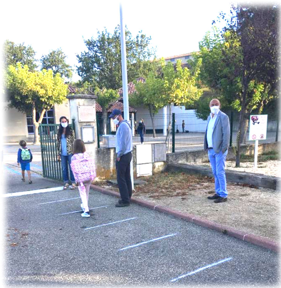
Photo rentrée scolaire 2020