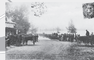
CRUES DE LA LOIRE (1904) - 110 - 111 - 112 - 113 - 114 - 115 - 116 - 117 - 118 - 119 - 120 - 121 - 122 - 123 - 124 - 125 - 126 - 127 - 128 - 129 - 130 - 131 - 132 - 133 - 134 - 135 - 136 - 137 - 138 - 139 - 140 - 141 - 142 - 143 - 144 - 145 - 146 - 147 - 148 - 149 - 150 - 151 - 152 - 153 - 154 - 155 - 156 - 157 - 158 - 159 - 160 - 161 - 162 - 163 - 164 - 165 - 166 - 167 - 168 - 169 - 170 - 171 - 172 - 173 - 174 - 175 - 176 - 177 - 178 - 179 - 180 - 181 - 182 - 183 - 184 - 185 - 186 - 187 - 188 - 189 - 190 - 191 - 192 - 193 - 194 - 195 - 196 - 197 - 198 - 199 - 200