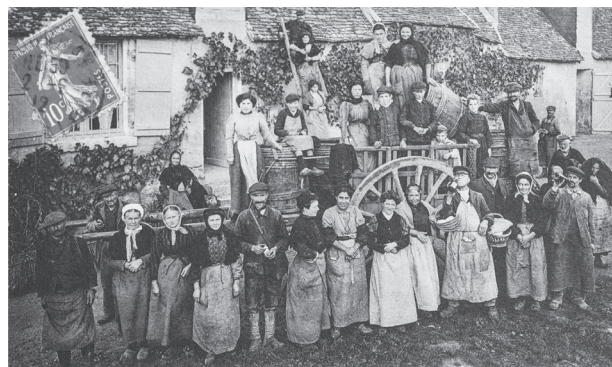
VOUVRAY (Indre-et-Loire) — 104 — Groupe de vendeurs, au « Clos des Roches ».

12 FOYER DES EURASIENS THE EURASIANS' HOSTEL