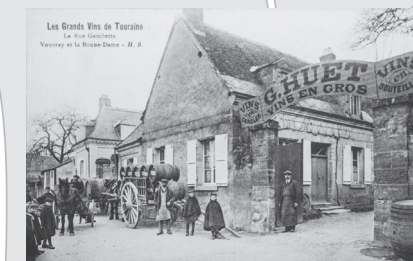
Les Grands Vins de Touraine Le Vin Gaudissart Vouvray et la Bouteille - H. B.