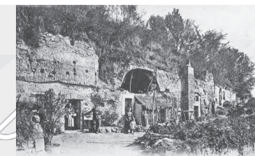
25 — VOUVRAY (I-et-L) — L'Écheveau - Habitations dans le Rocher A. P.