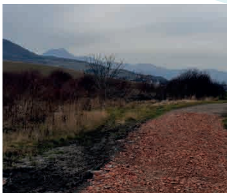
En direction du rond-point de Pérignat

Dans certaines parties, le sens de la pente a été retravaillé pour un écoulement naturel des eaux de pluie.