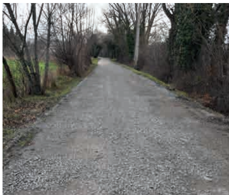
Chemin de Bourdelas