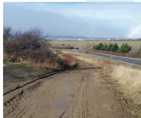
En direction du rond-point de Pérignat