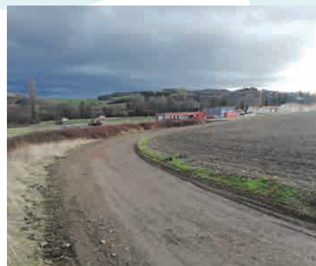
En arrivant à Orcet, devant la caserne