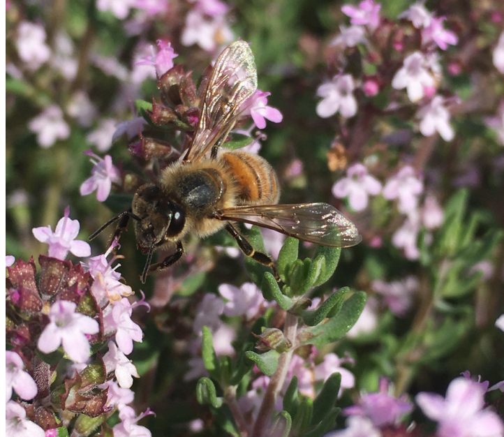
Thym Linalol à Milly-la-Forêt