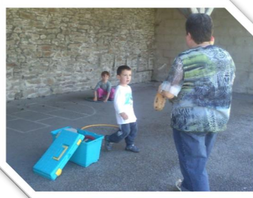
TAP : Petite et Moyenne sections

➤ Une cinquantaine d'élèves a fait sa rentrée.