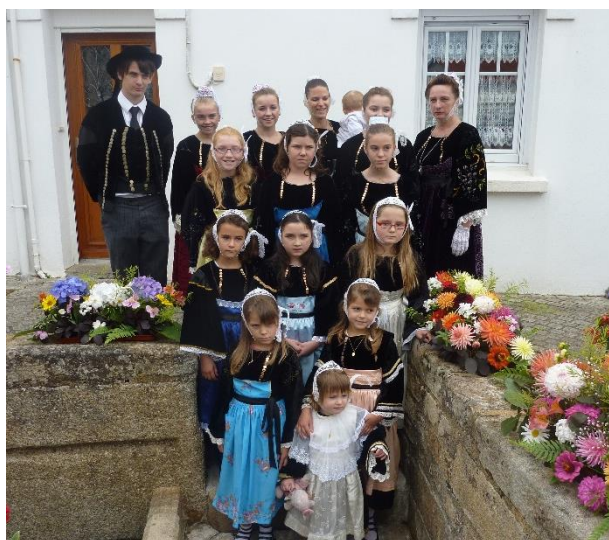
Les petits danseurs costumés de Plijadur ba'r vro Pourlet ( Séglien )

Les Ségliennais s'illustrent à la traditionnelle fête de l'andouille de Guémené-sur-Scorff.