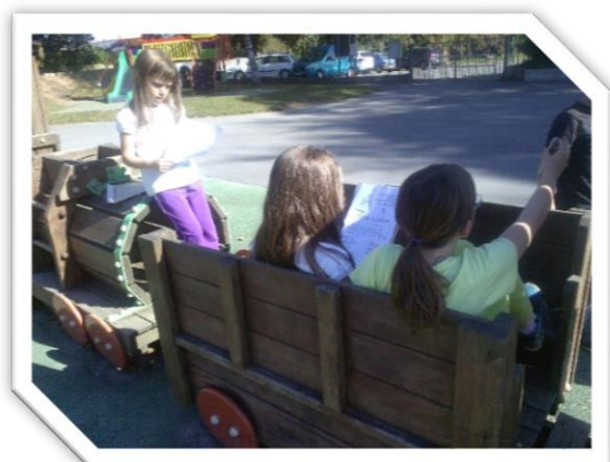
TAP : rallye citoyen CE2, CM1 et CM2