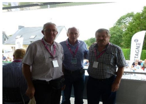
Le parrain de l'épreuve JOOP ZOETEMELK et les invités de Séglien