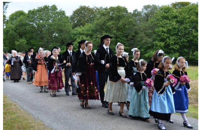
Pardon de notre Dame de Crénéan