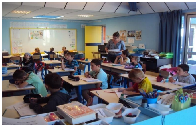
CLASSE DE LISE CP CE1