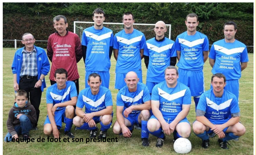
L'équipe de foot et son président

Le 8 novembre nous organisons un repas : omelette/ frites suivi d'une soirée disco à la salle polyvalente .