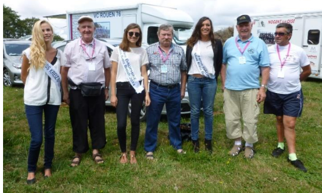
Invités Séglien, les Miss et les chauffeurs