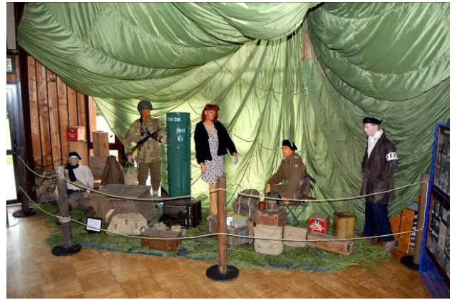
La scène de l'exposition