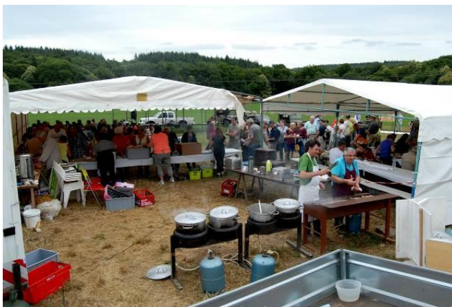
Une vue partielle du repas à Guern