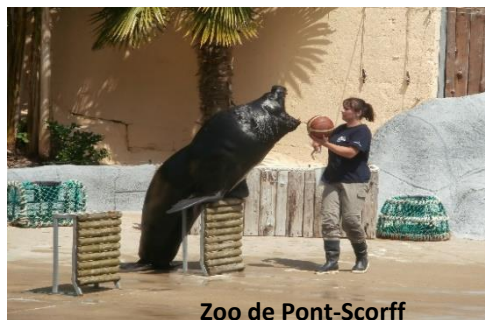
Zoo de Pont-Scorff