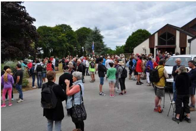
Avant le départ