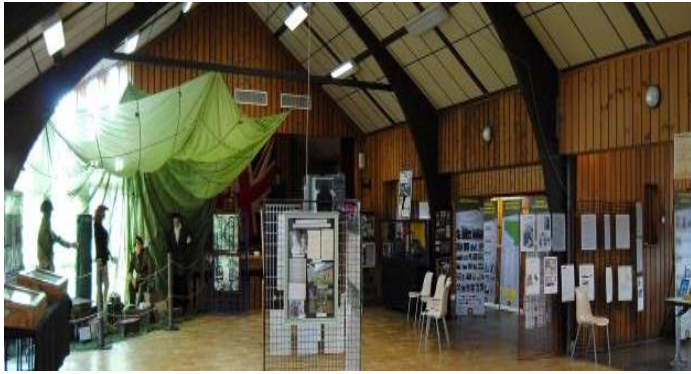
Une partie de l'exposition