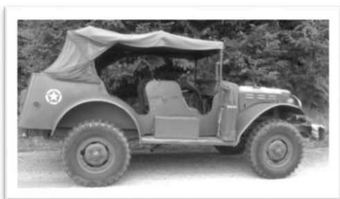
Rando du Capitaine Déplante