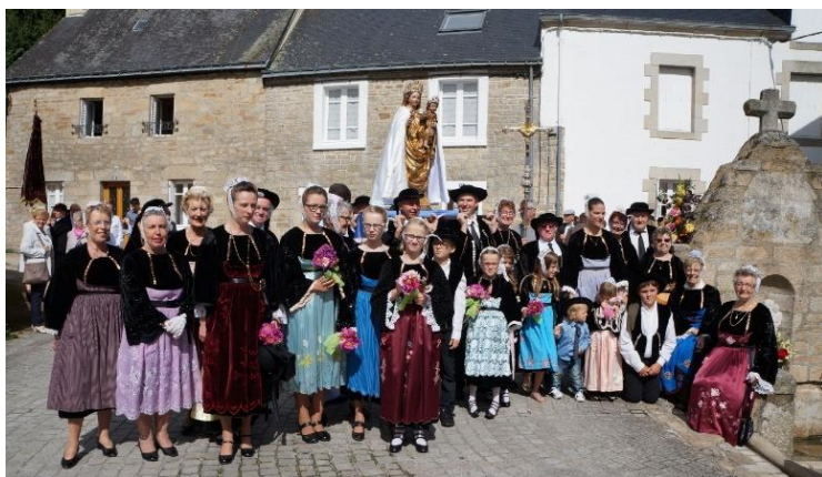
pardon de Notre Dame de la Fosse à Guéméné.

Tout d'abord la reprise des cours de danse bretonne est effective depuis le Mardi 29 Septembre.