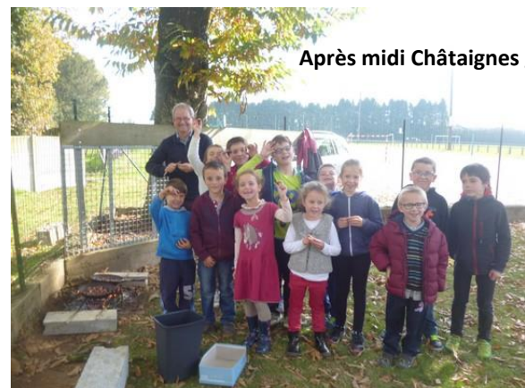
Après midi Châtaignes grillées