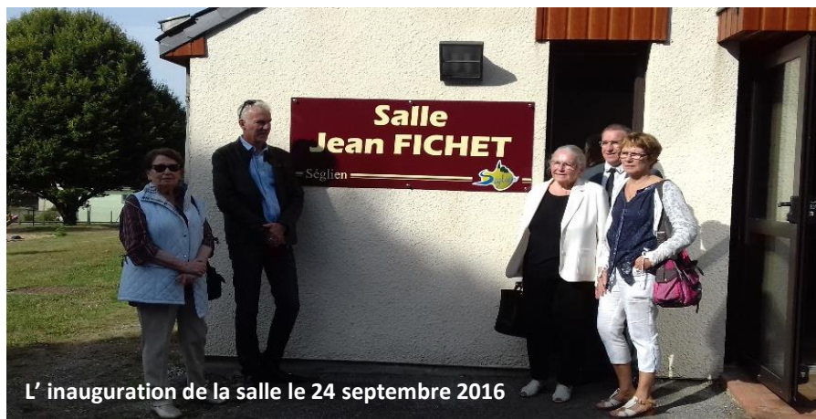
L'inauguration de la salle le 24 septembre 2016