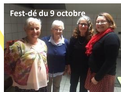
Fest-dé du 9 octobre

Le 29 juin, les adhérents du club ont participé à la sortie qui, cette année, nous a fait découvrir la ville côtière de Roscoff, en petit train dans le centre. Les maisons sont en belles pierres, c'est une « Petite Cité de caractère ».