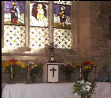
Saint-Jean 2 juillet