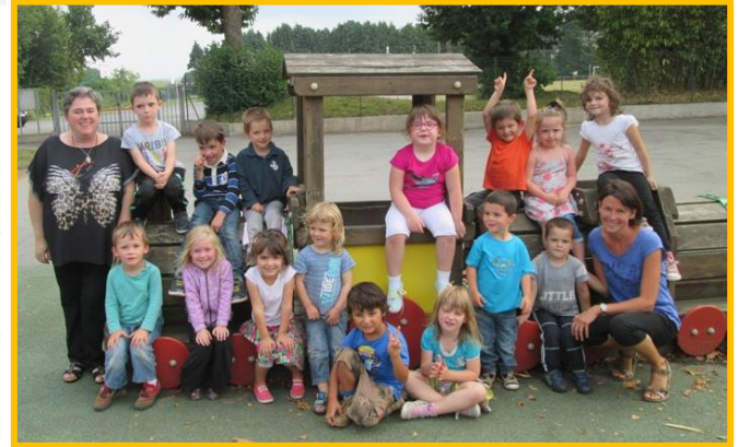
Les enfants de Maternelle sur la cour de récréation

Les élèves de Maternelle ont visité le zoo de Pont-Scorff le jeudi 29 septembre 2016. Les enfants ont apprécié la visite du parc et tout particulièrement les animaux de la savane et le spectacle des rapaces et des oiseaux marins, sous un soleil radieux. La plupart des élèves se sont endormis dans le car après cette belle journée.