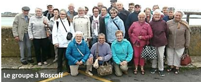
Le groupe à Roscoff