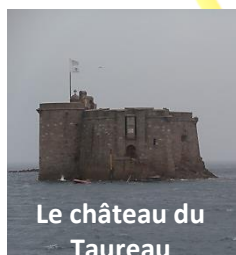
Le château du Taureau