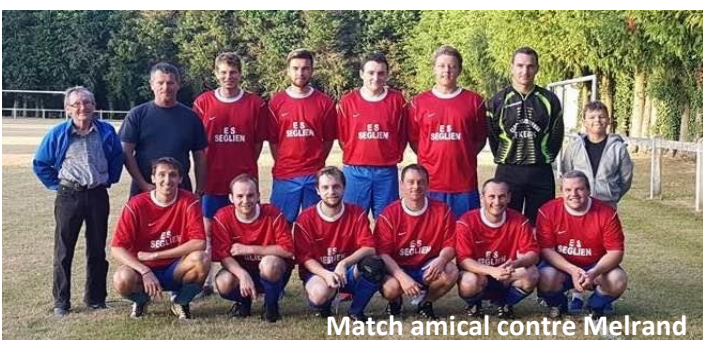
Match amical contre Melrand

En cette nouvelle saison 2016/2017, nous évoluons dans la plus basse division du championnat : la division 4.