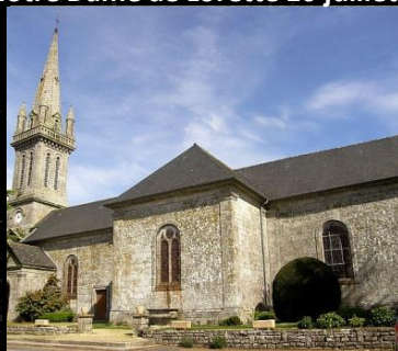
Notre Dame de Lorette 10 juillet