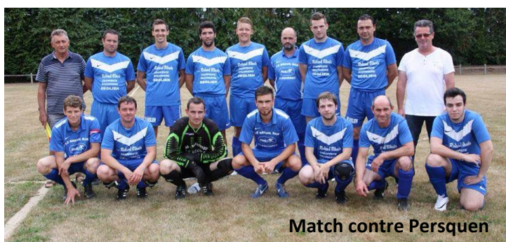
Match contre Persquen