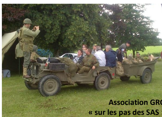
Association GROG - marche « sur les pas des SAS » le 3 juillet 2016